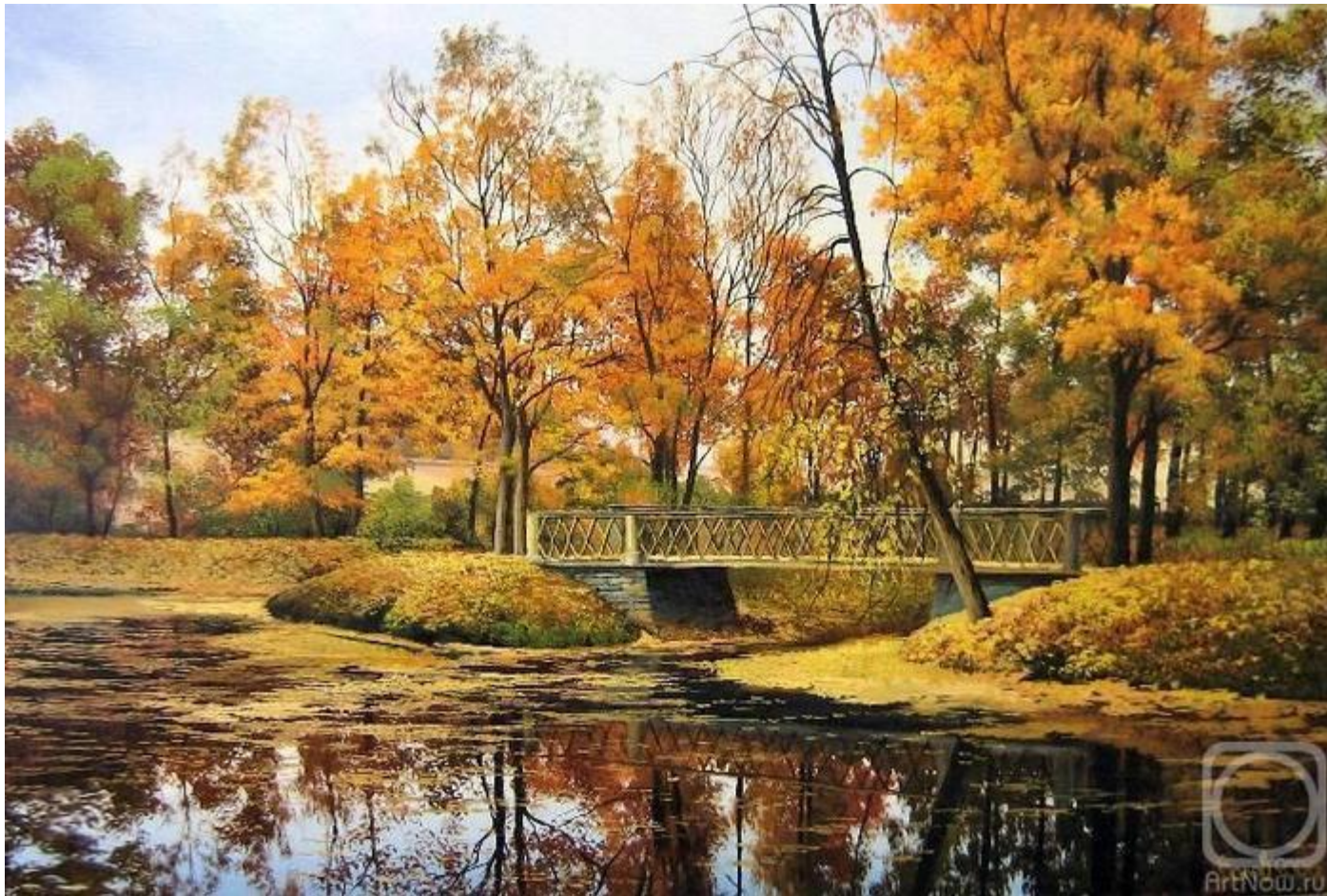
Старый парк осенью