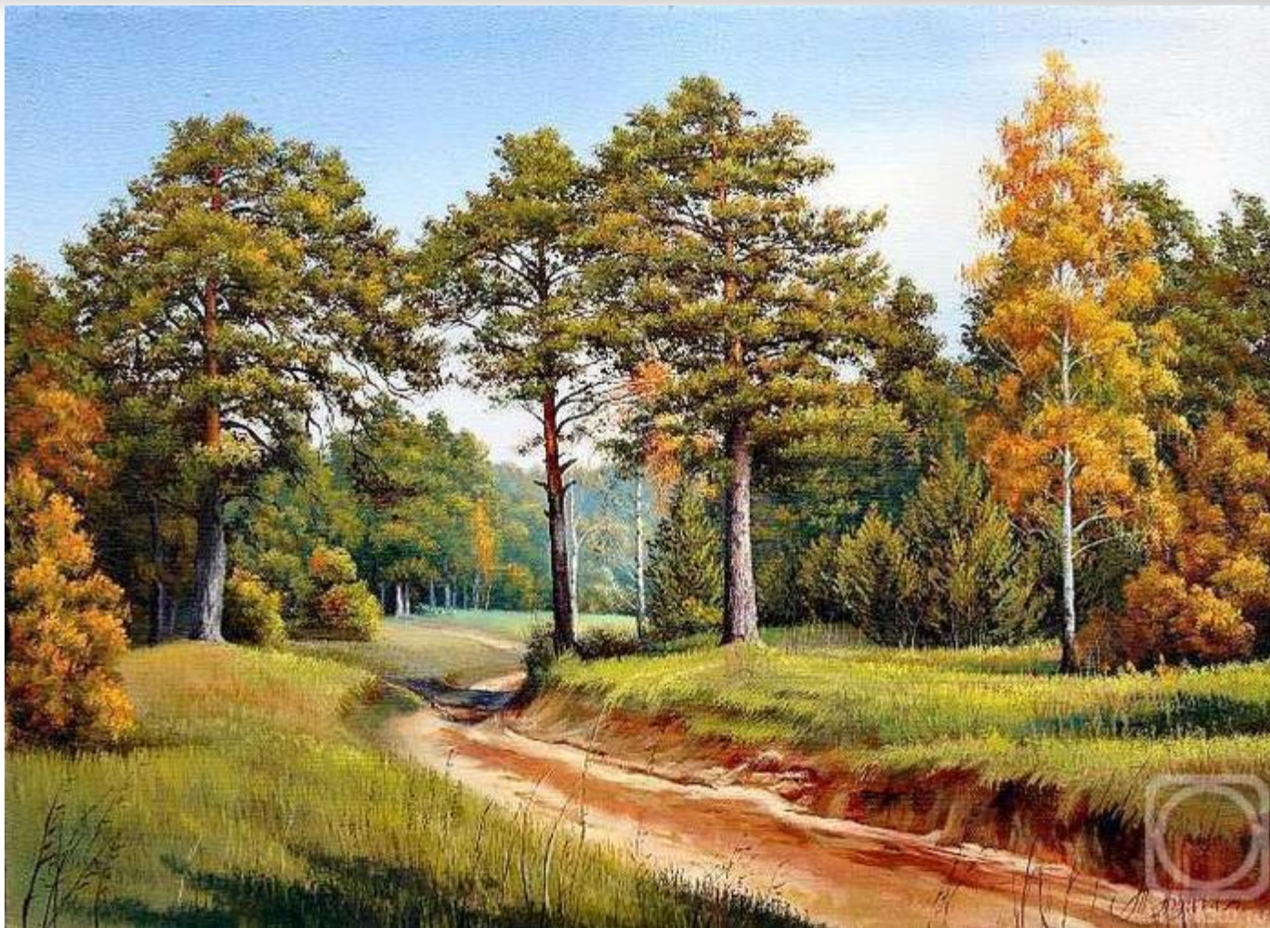
Дорога в лес