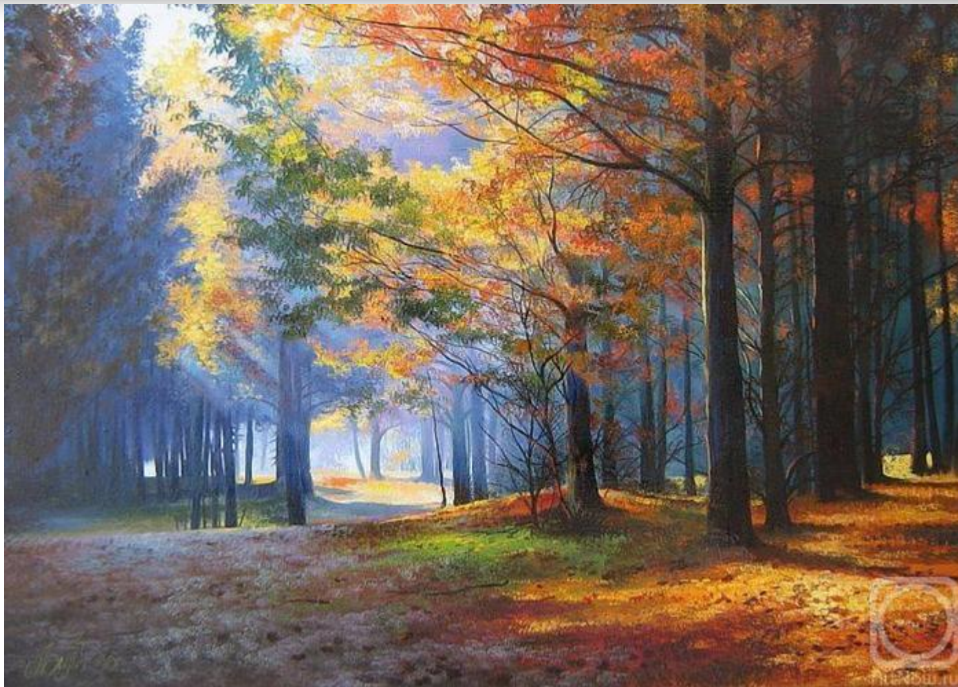
Гуляя по лесу