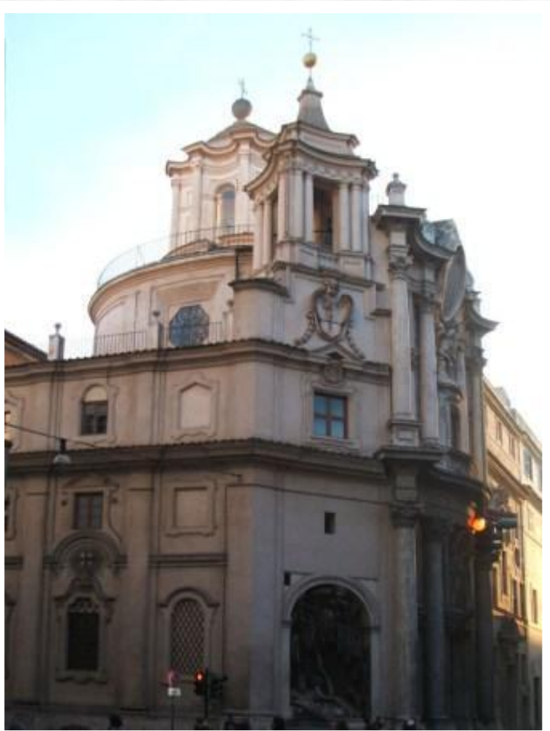
Франческо Борромини Сан-Карло-алле-Куаттро- Фонтане