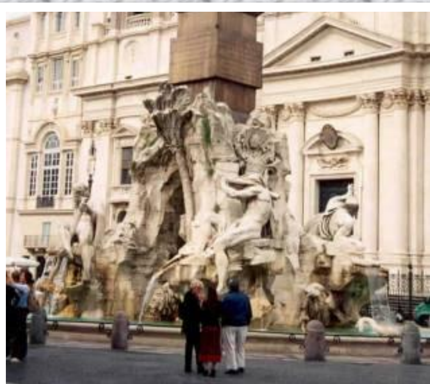
Фонтан четырёх рек.