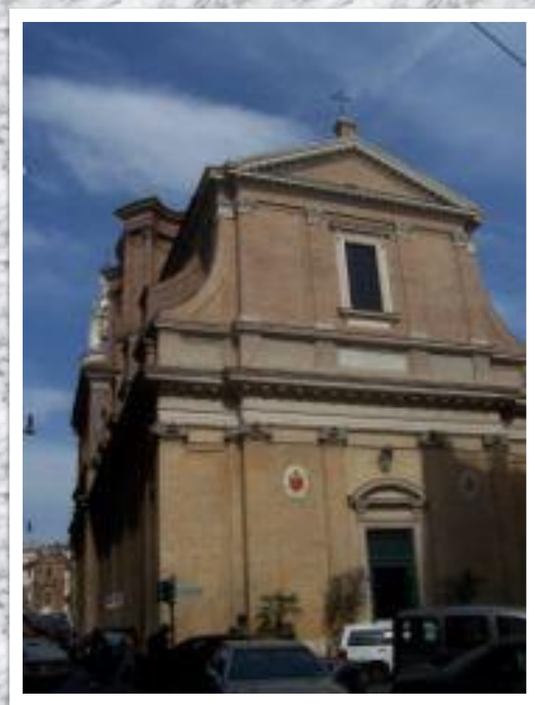
Фасад Сант- Андреа- делле-Фратте