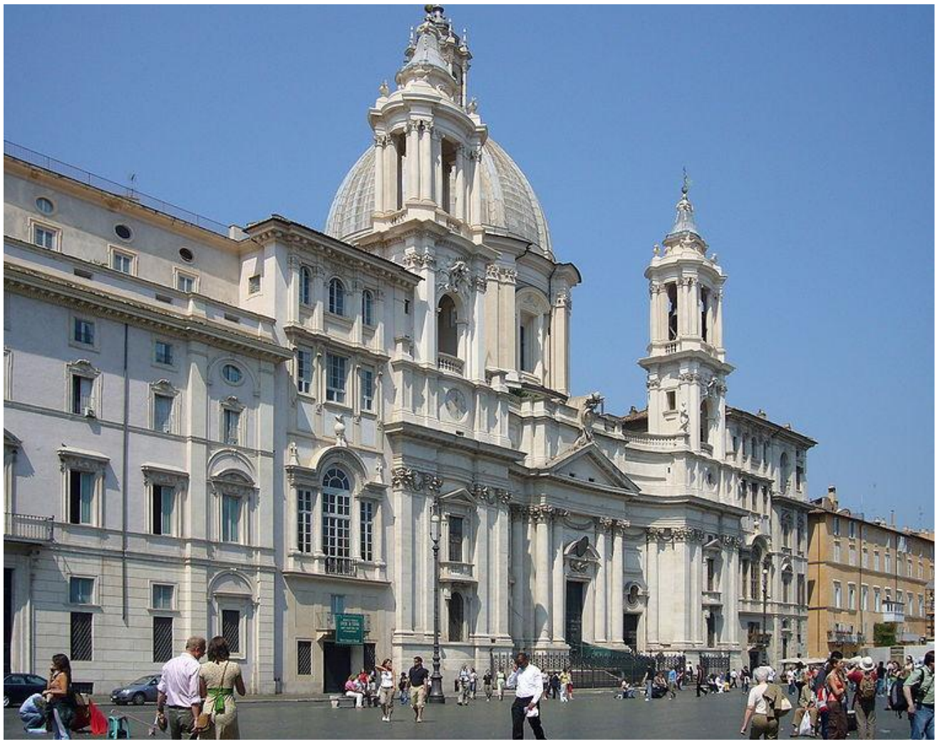
Франческо Борромини Церковь Сант Анъезе в Риме