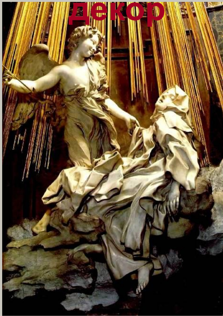
Экстаз святой Терезы.