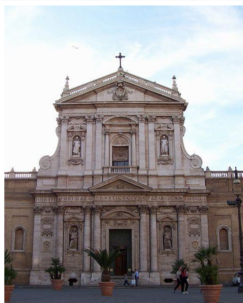
Карло Мадерна Церковь Святой Сусанны