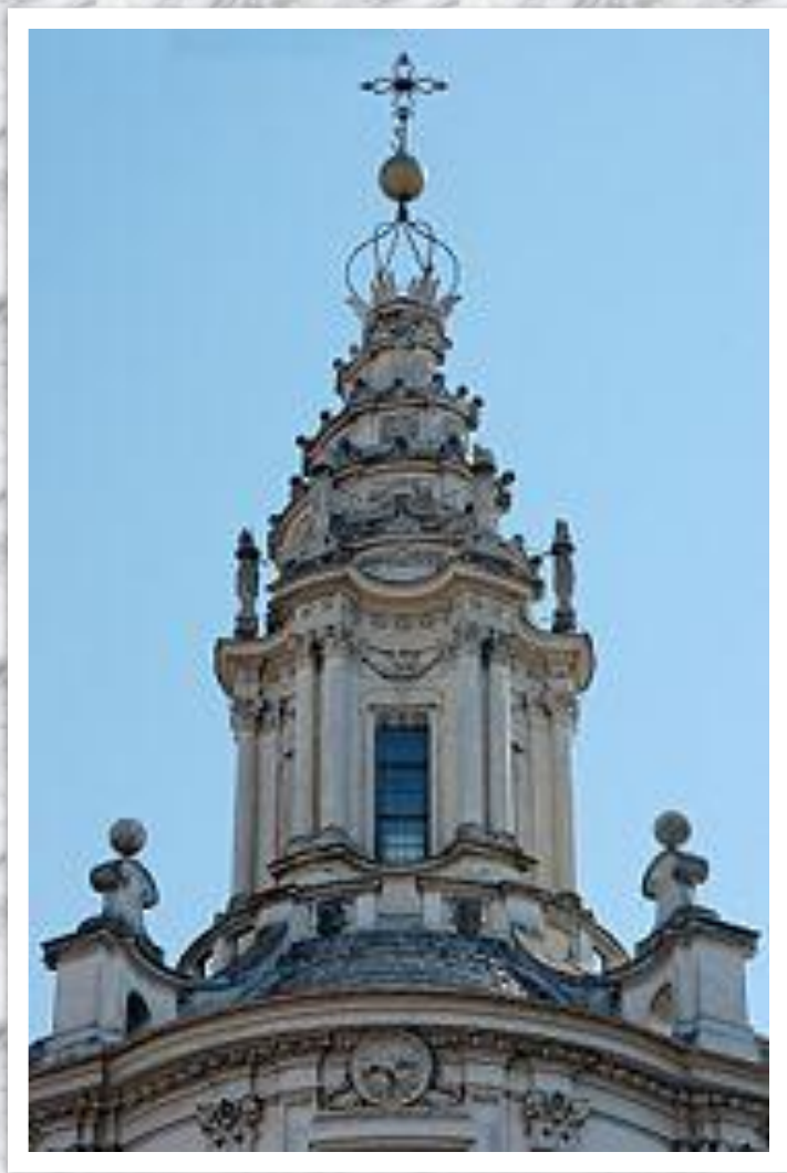
Навершие университетской Церкви в Риме.