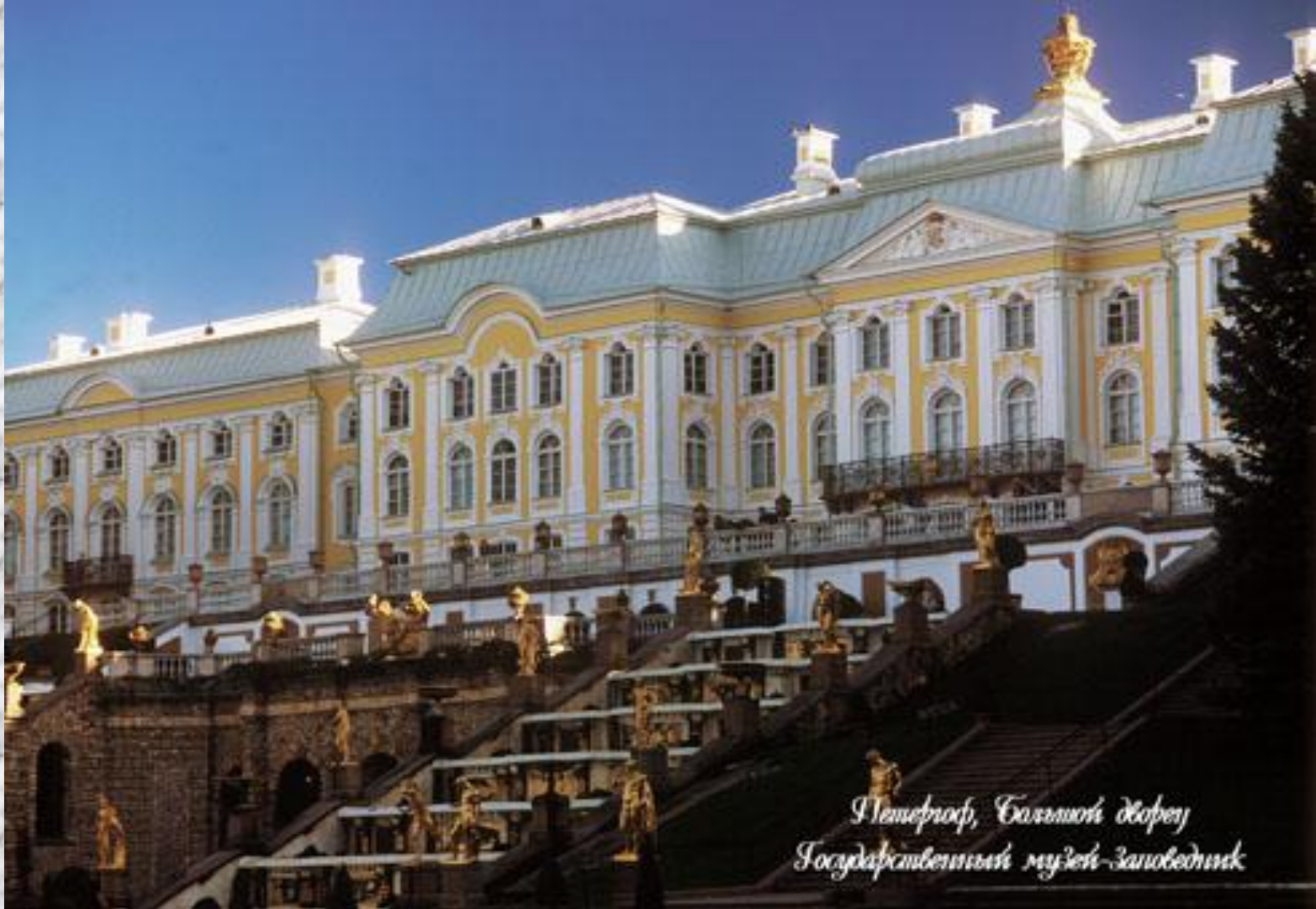
Санкт-Петербург, Большой двор Государственный музей-заповедник