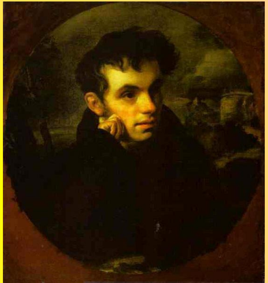
Портрет В.А. Жуковского 1819 год

Портрет В. А. Жуковского имеет меланхолическое выражение. Поэт представлен в задумчивости; местоположение дико и мрачно; на небе ночь, и в облаках виден отсвет луны»