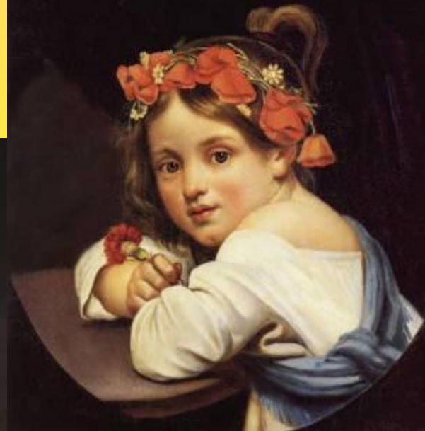
Девочка в маковом венке с гвоздикой в руке. 1819 г