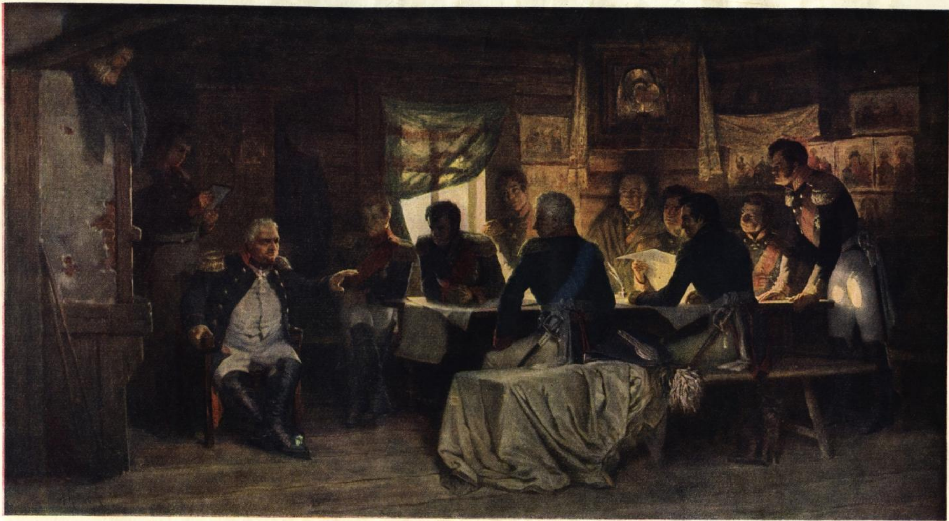
А. Д. Кившенко (1851—1895)