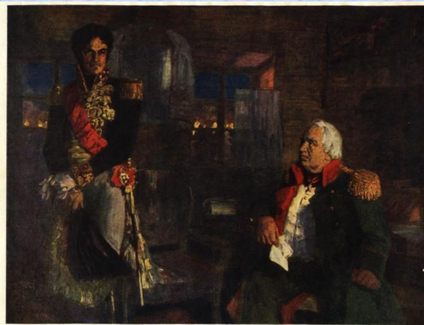
Н. П. Ульянов (1875—1949)