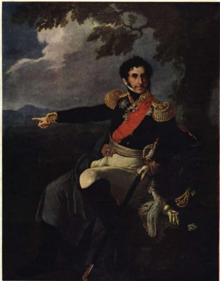
В. А. Тропинин (1776—1857)