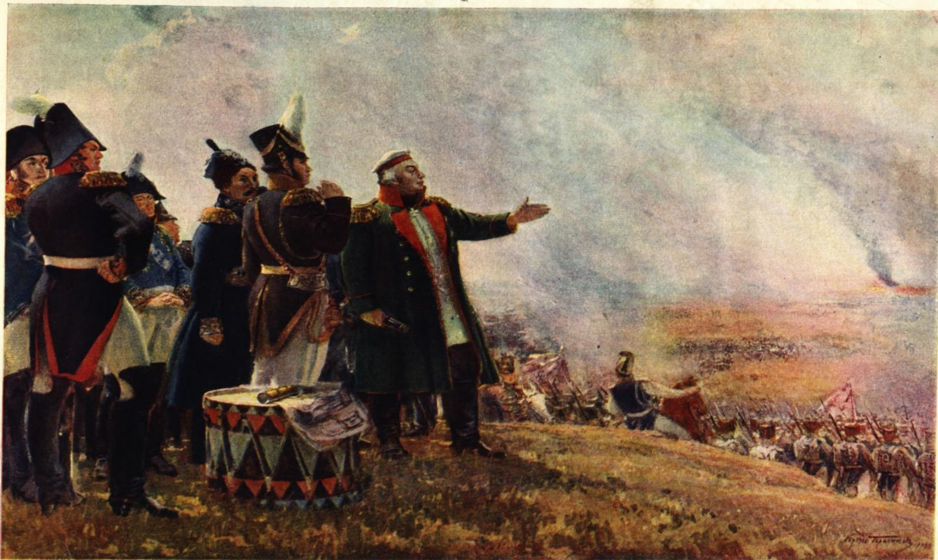
С. В. Герасимов (Род. 1885 г.)