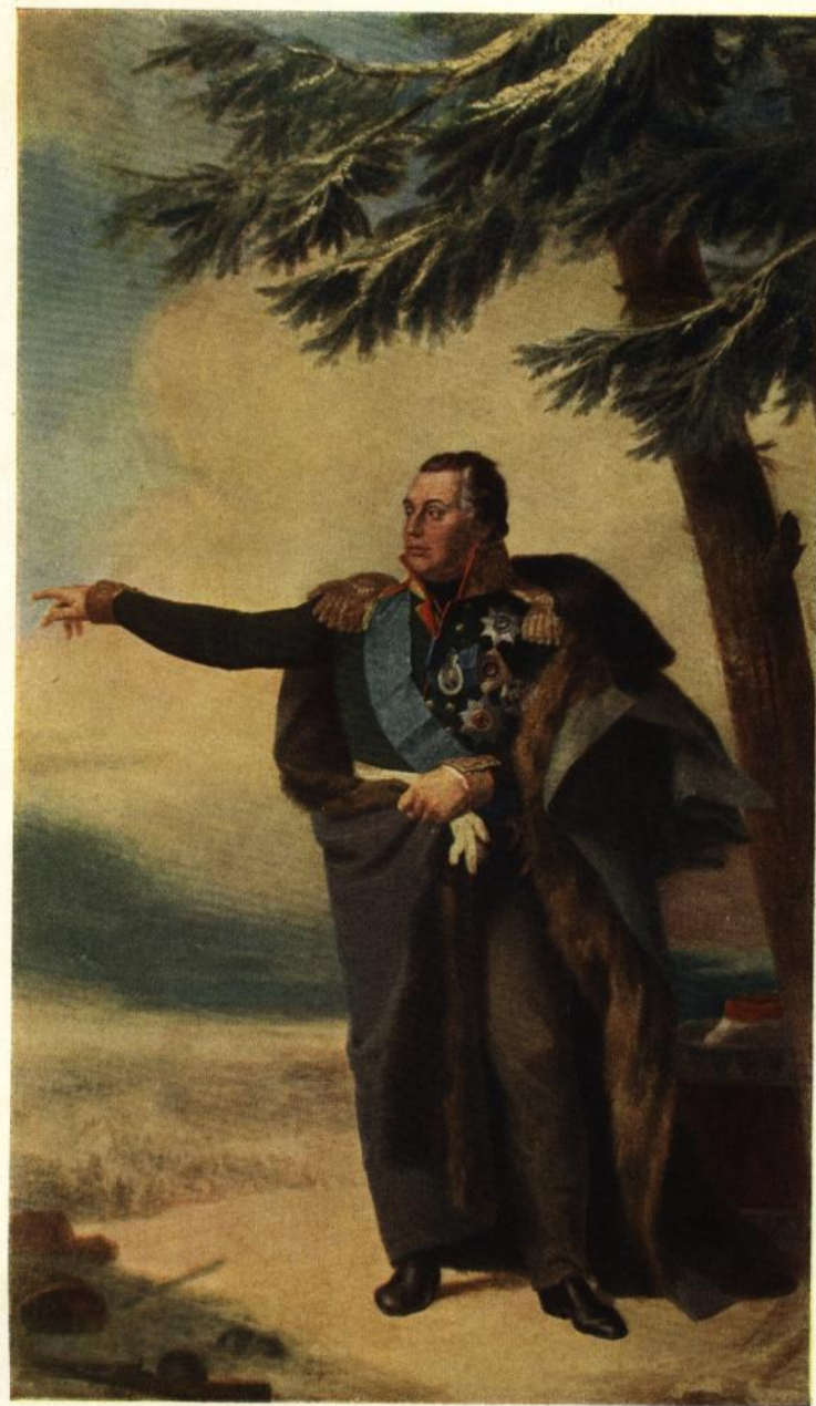
М. И. КУТУЗОВ.