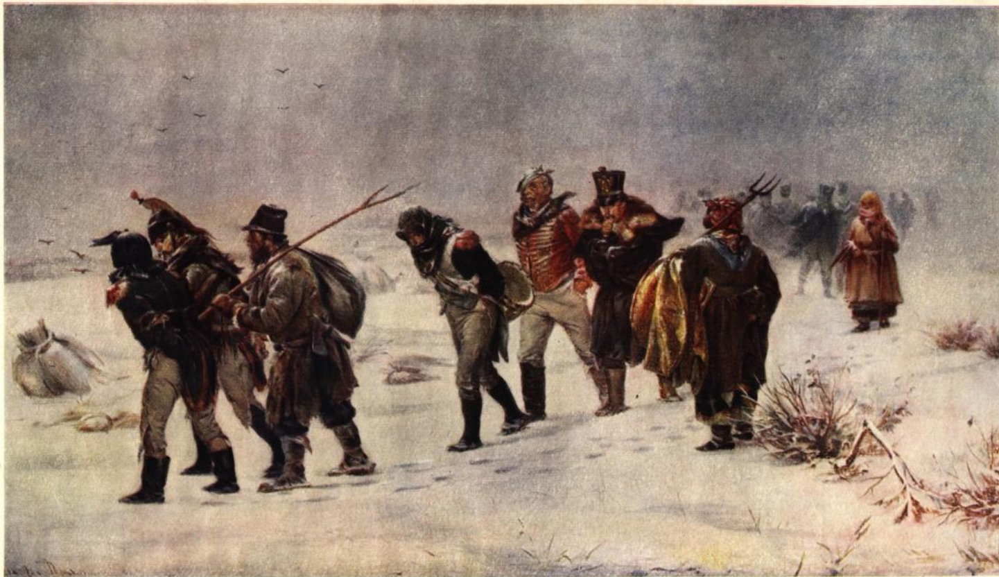
И. М. Прянишников (1840—1894)