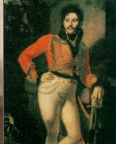
А.С.Фигнер и Денис Давыдов-прототипы Денисова и Долохова-командиров партизанских отрядов.