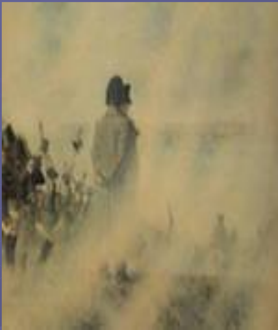
«Наполеон у Москвы. В ожидании делегации бояр»

Напрасно ждал Наполеон, Последним счастьем упоенный, Москвы коленапреклоненной, С ключами старого Кремля: Нет, не пошла Москва моя К нему с повинной головою». «Не праздник, не приемный дар, Она готовила пожар Нетерпеливому герою».