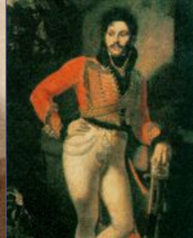
А.С.Фигнер и Денис Давыдов-прототипы Денисова и Долохова-командиров партизанских отрядов.