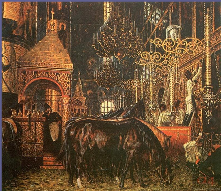
В Успенском Соборе