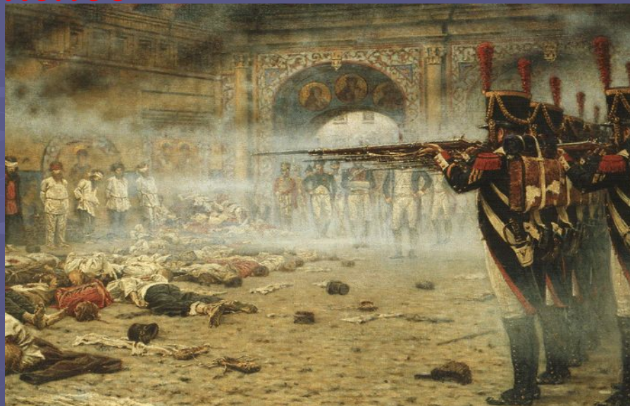
В.В.Верещагин. "Расстрел поджигателей". Из серии картин "1812 год". 1897-1898 гг.