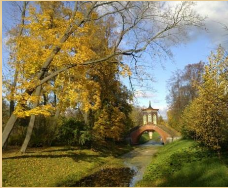
Большой китайский мост