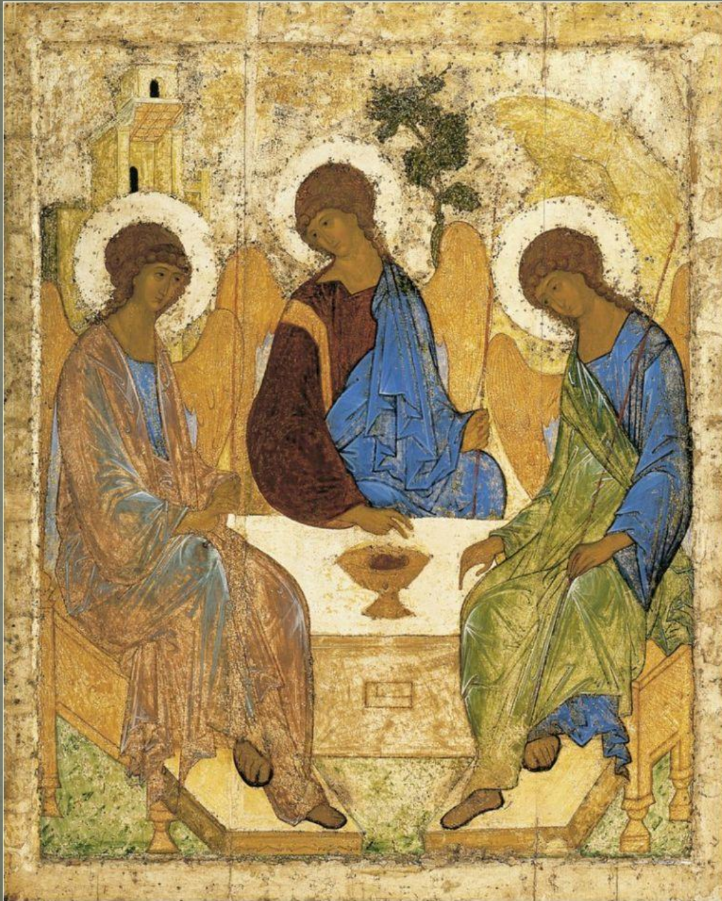
Андрей Рублев «Святая Троица»