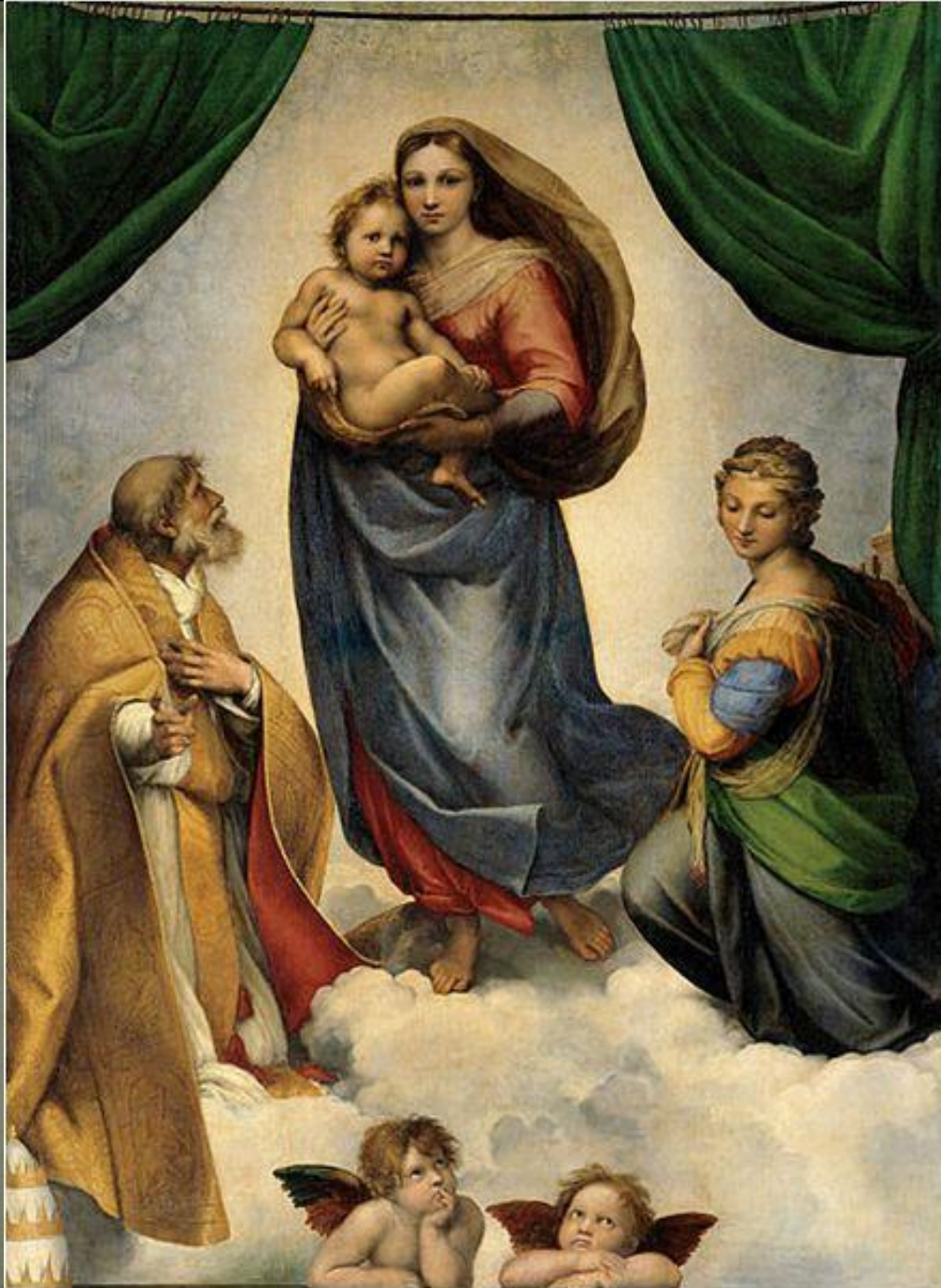
Рафаэль . « Сикстинская мадонна»