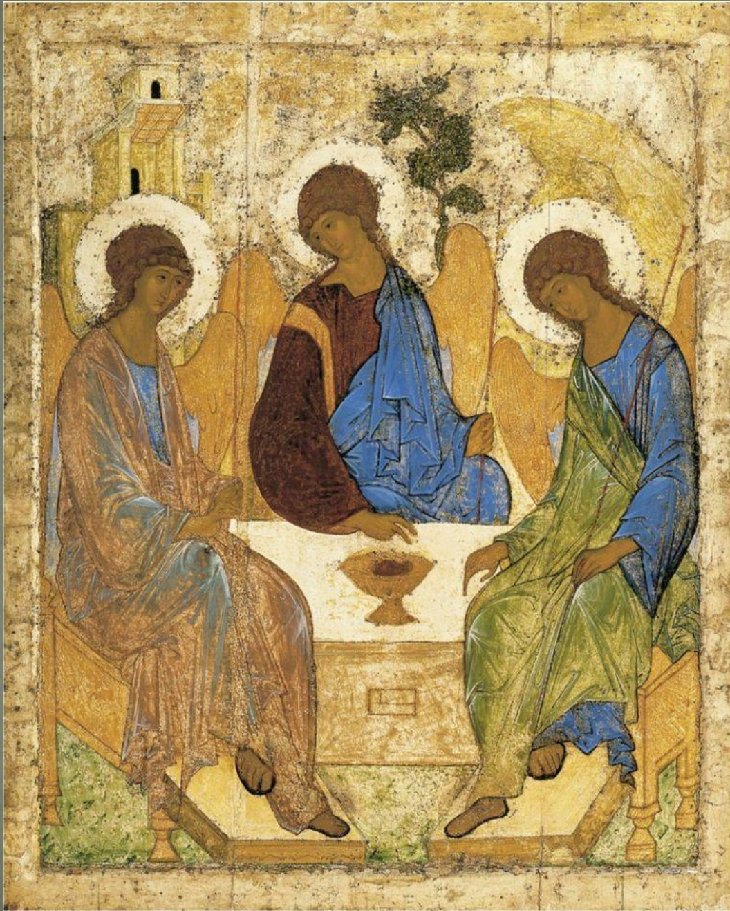
Андрей Рублев «Святая Троица»