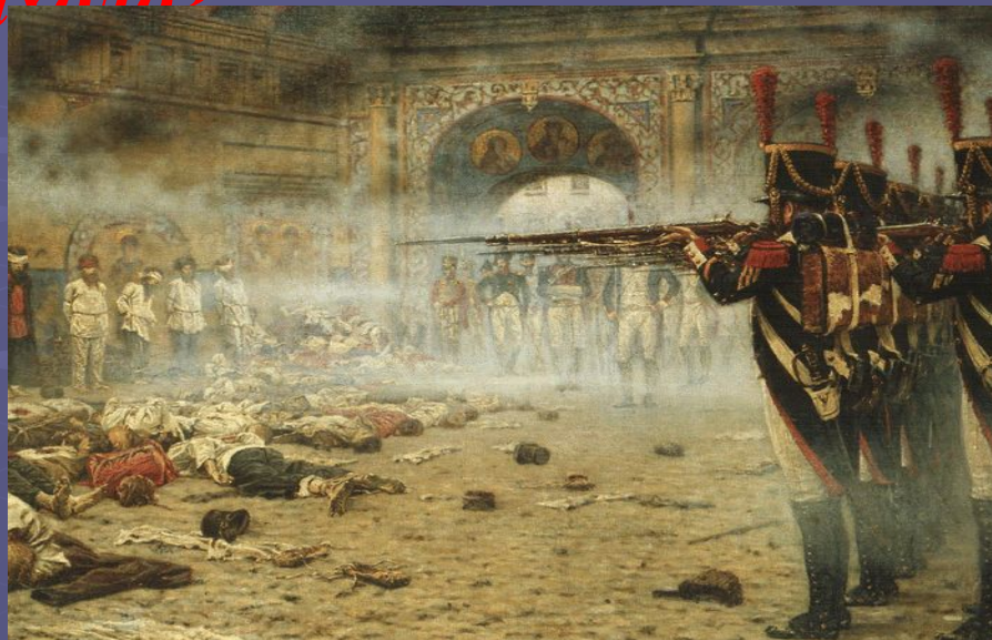
В.В.Верещагин. "Расстрел поджигателей". Из серии картин "1812 год". 1897-1898 гг.