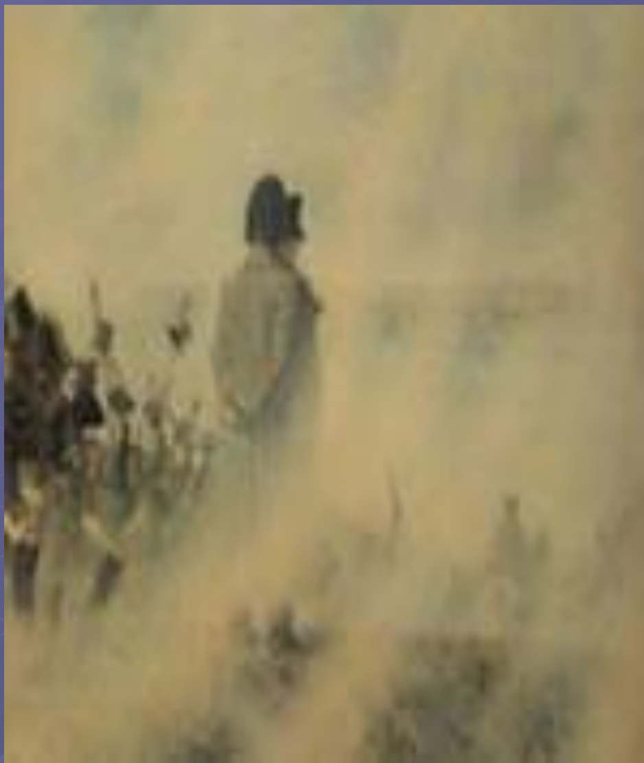
«Наполеон у Москвы. В ожидании делегации бояр»

Напрасно ждал Наполеон, Последним счастьем упоенный, Москвы коленопреклоненной, С ключами старого Кремля: Нет, не пошла Москва моя К нему с повинной головою». «Не праздник, не приемный дар, Она готовила пожар Нетерпеливому герою».