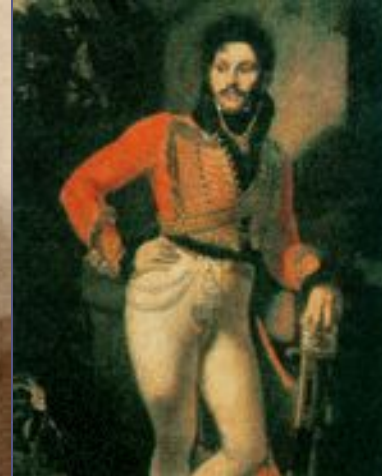
А.С.Фигнер и Денис Давыдов-прототипы Денисова и Долохова-командиров партизанских отрядов.