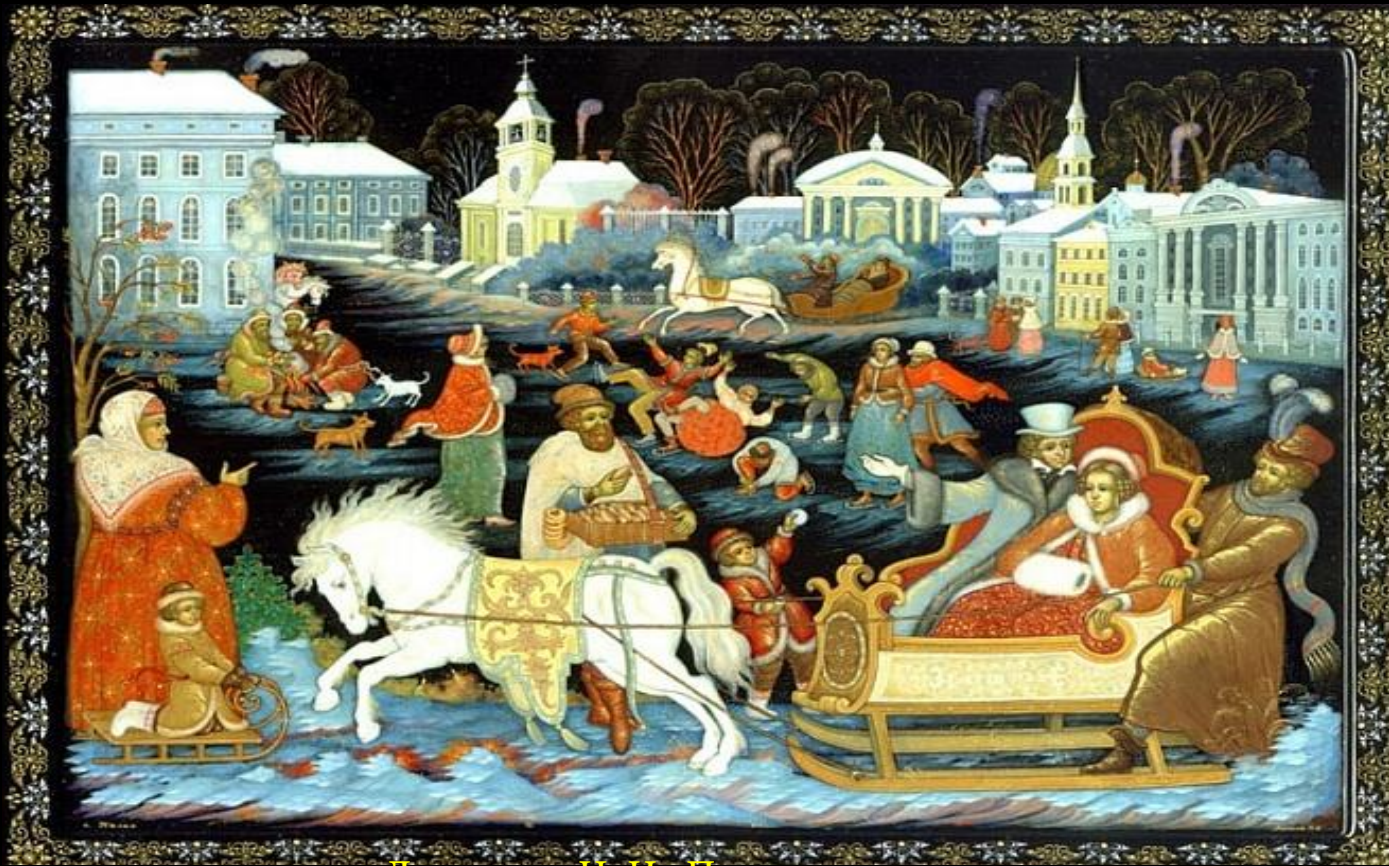
Лукина Н. И. Пушкин. Шкатулка.

характерны бытовые, литературные, фольклорные, исторические сюжеты, яркие локальные краски на черном фоне, тонкий плавный рисунок, обилие золота, изящные удлиненные фигуры.