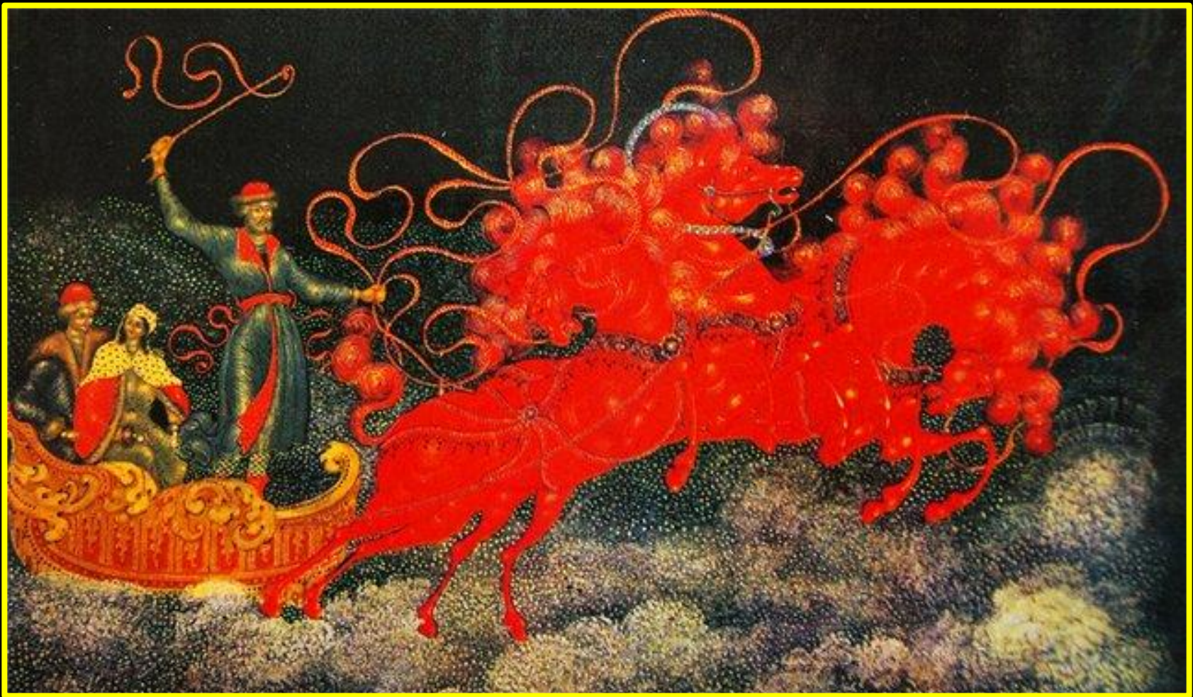
Голиков И. И. Тройка. Шкатулка. 1926.