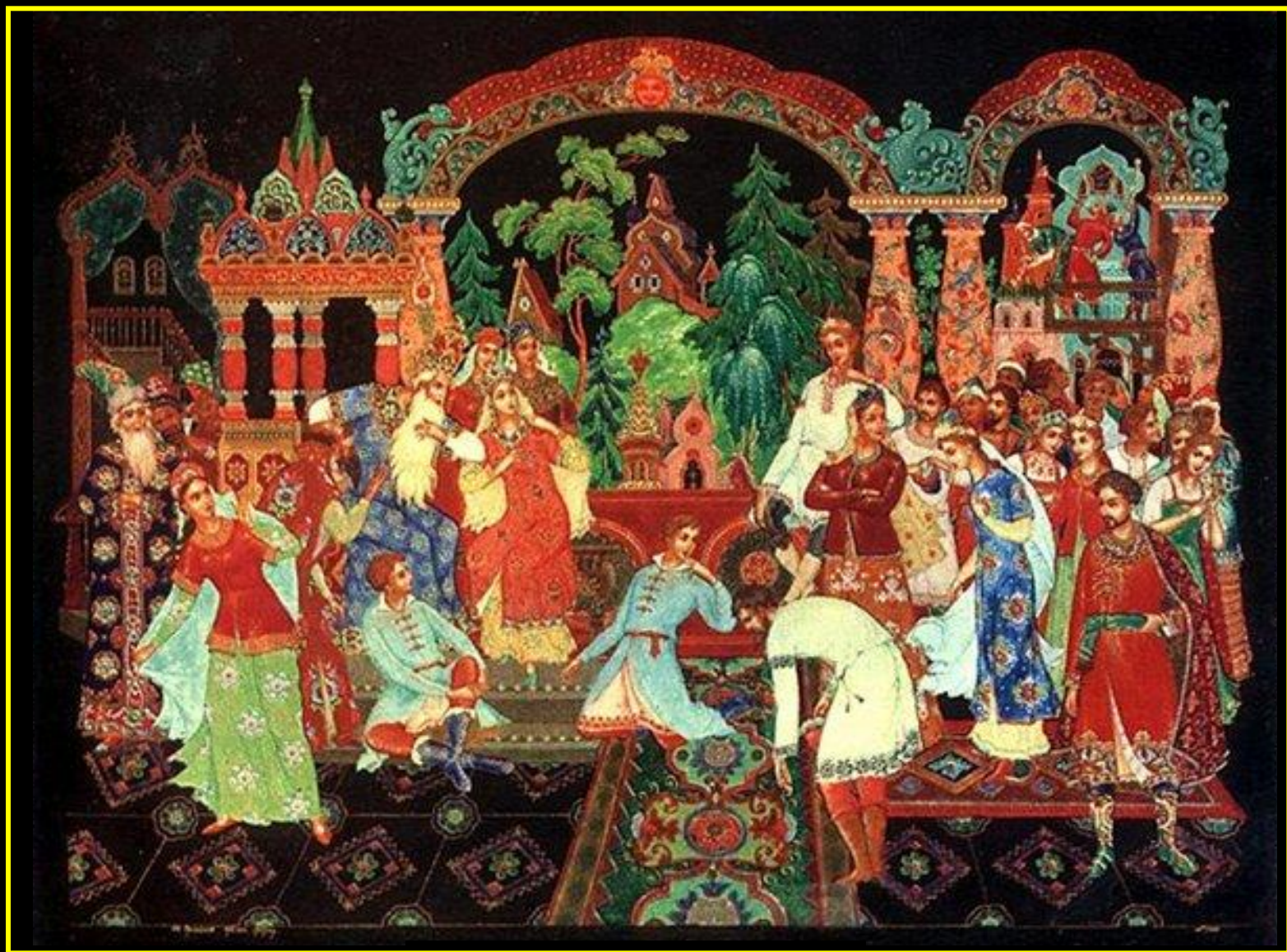
Ермолаев Б. М. Снегурочка. Шкатулка.