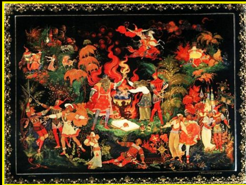
Голиков Н. И. Фауст. Шкатулка. 1957