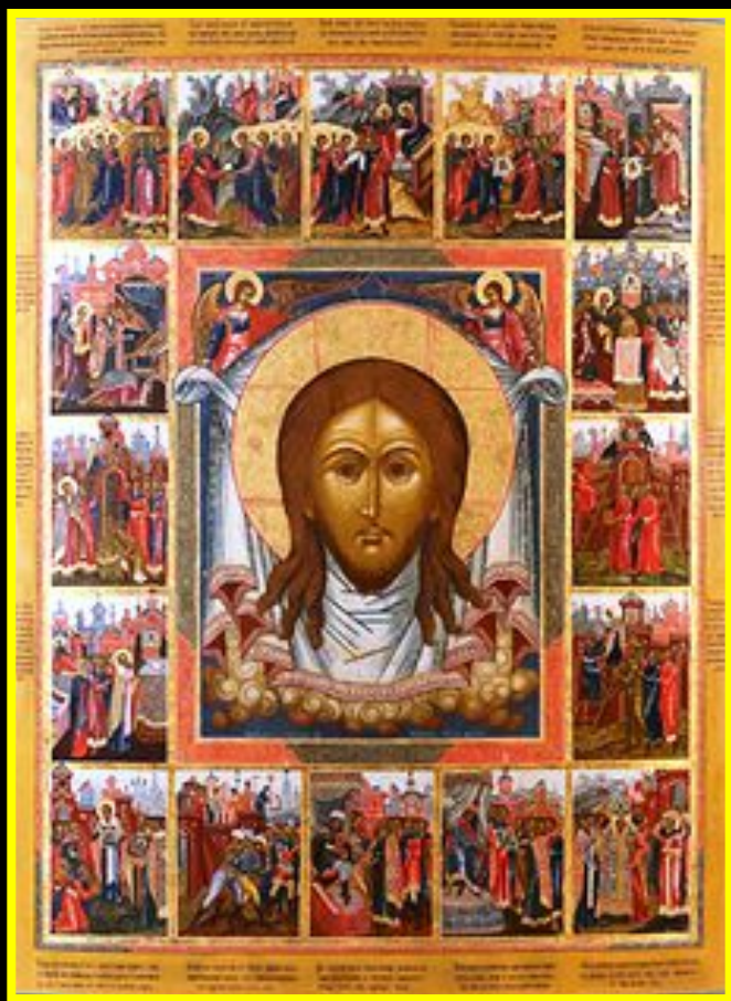
Хренов И. Спас Нерукотворный. 1924.

Палех еще с допетровских времен славился своими иконописцами. Наибольшего расцвета палехское иконописание достигло в XVIII — начале XIX века. После революции 1917 года иконописный промысел в Палехе прекратил свое существование.