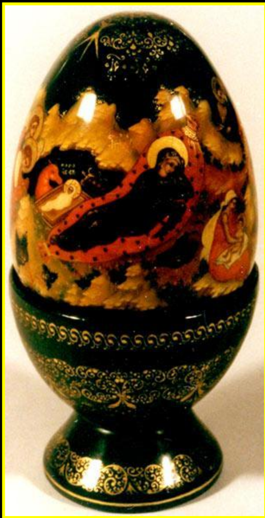
Лукина Н. И. Рождество Христово. Пасхальное яйцо.