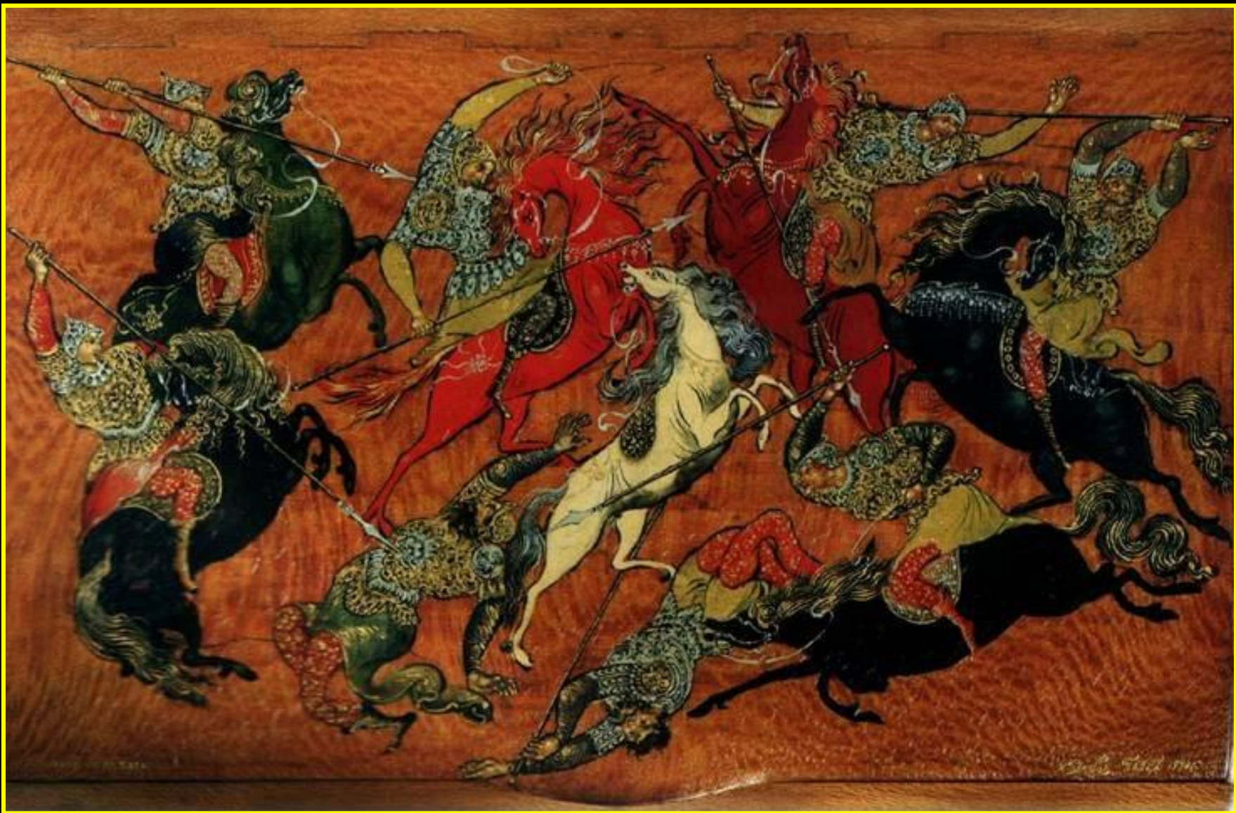
Голиков И. И. Битва. Портсигар. 1930