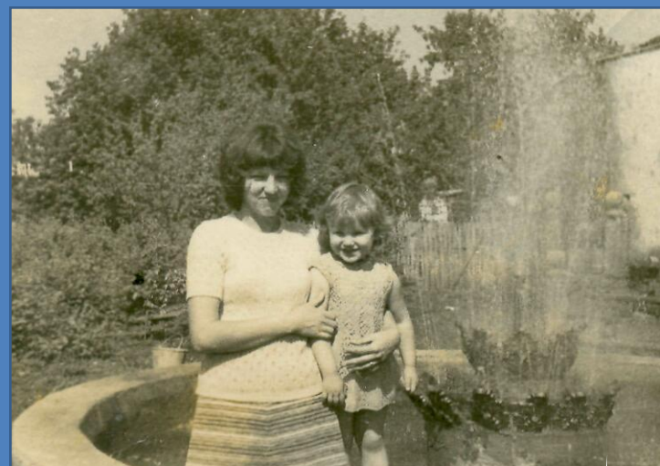
Фонтан в саду семьи Маркеловых. Работа Н.Ф Маркелова.