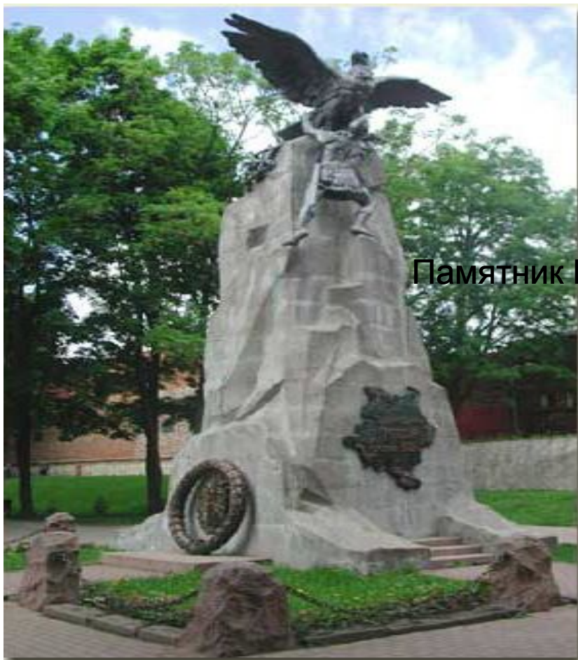
Памятник Героям 1812 г.