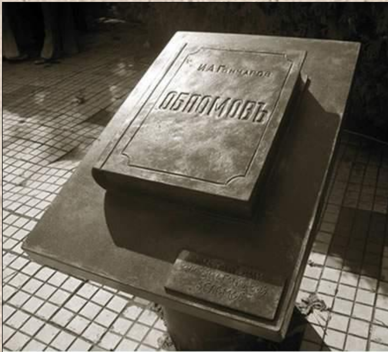
Россия. Симбирск. Памятник роману Гончарова “Обломов”.