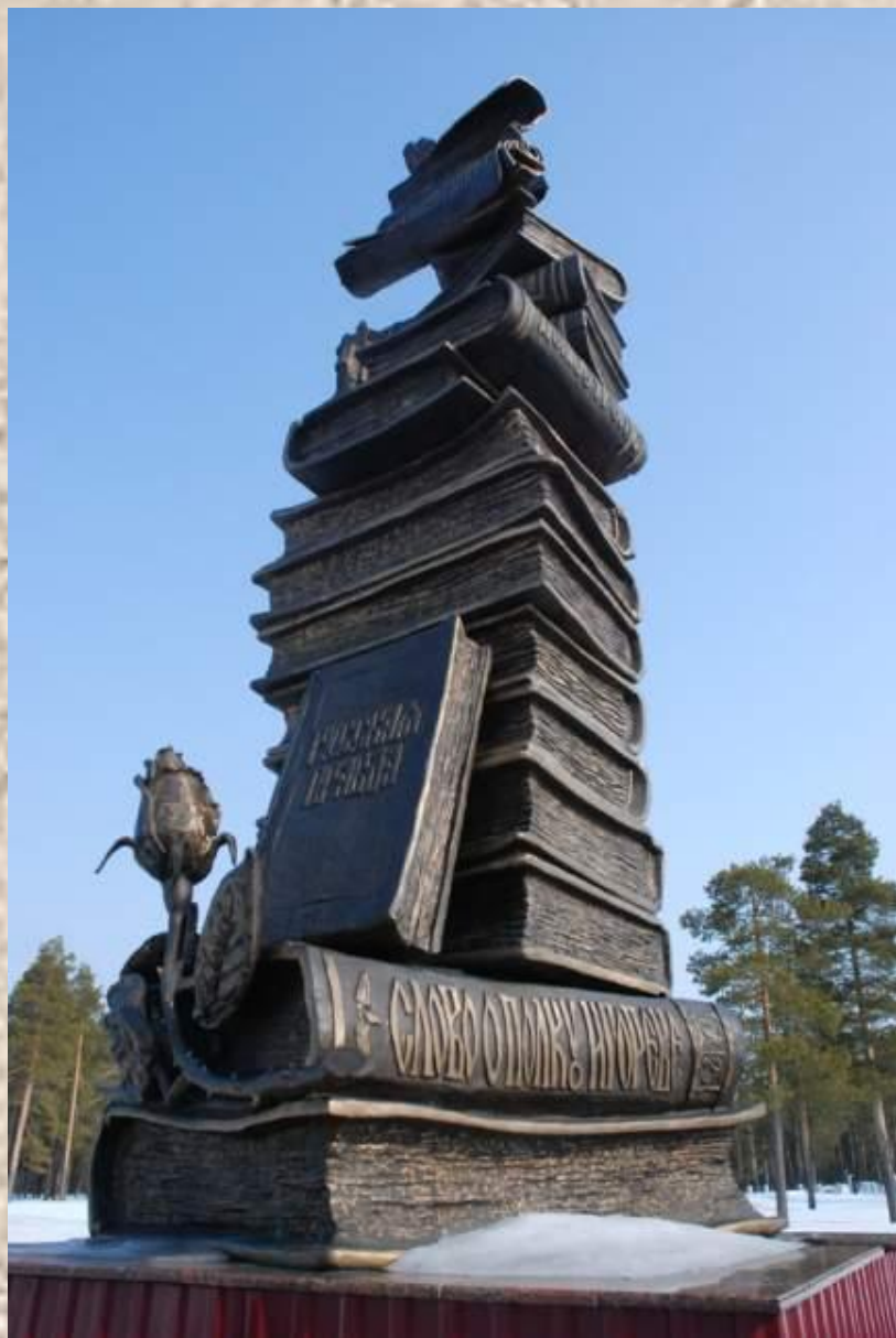
Памятник работы З. Церетели