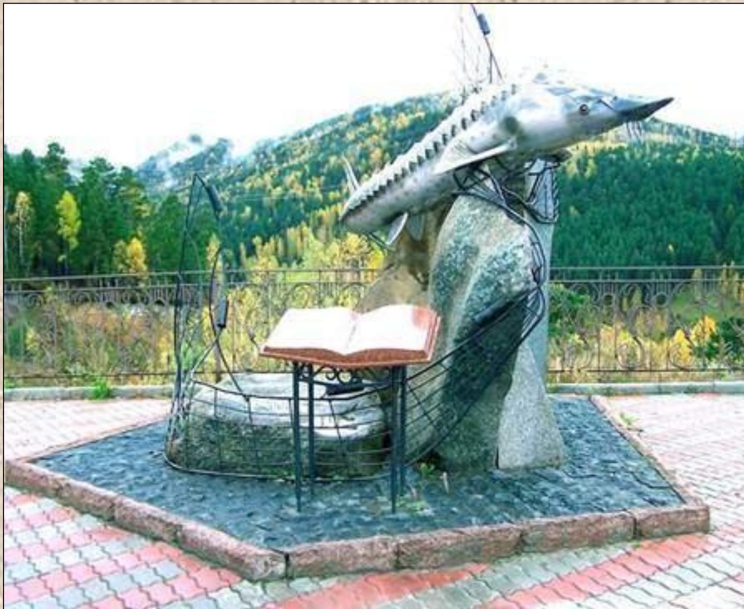
Красноярск. Памятник повести В. Астафьева «Царь-рыба».