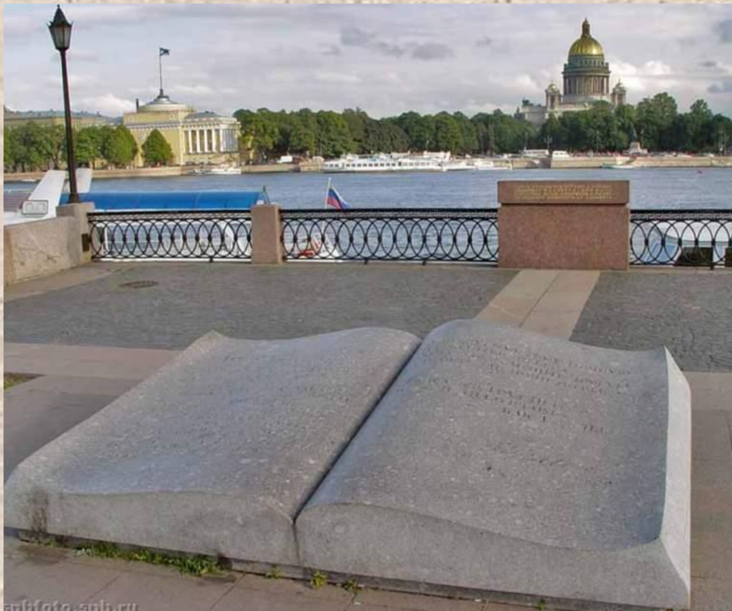
Россия. Санкт-Петербург. Книга на Университетской набережной. На книге высечены строки Пушкина “Люблю тебя, Петра творенье...”