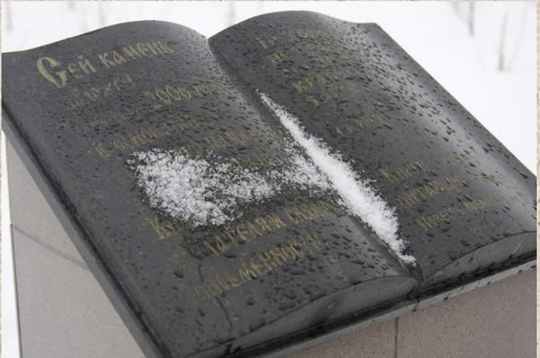
Россия. Сургут. Памятник книге.