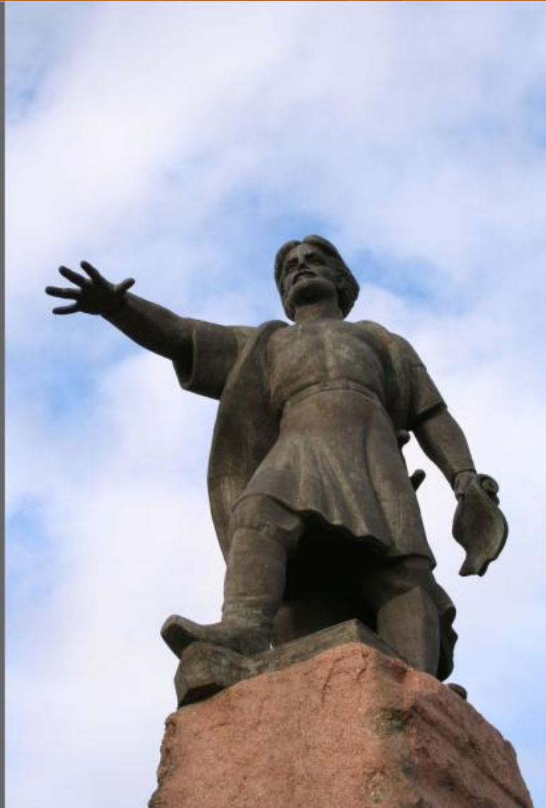
Воеводе А. Дубенскому.