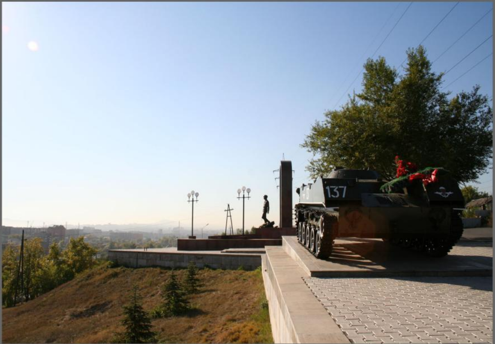
Мемориал Воинам -Интернационалистам.