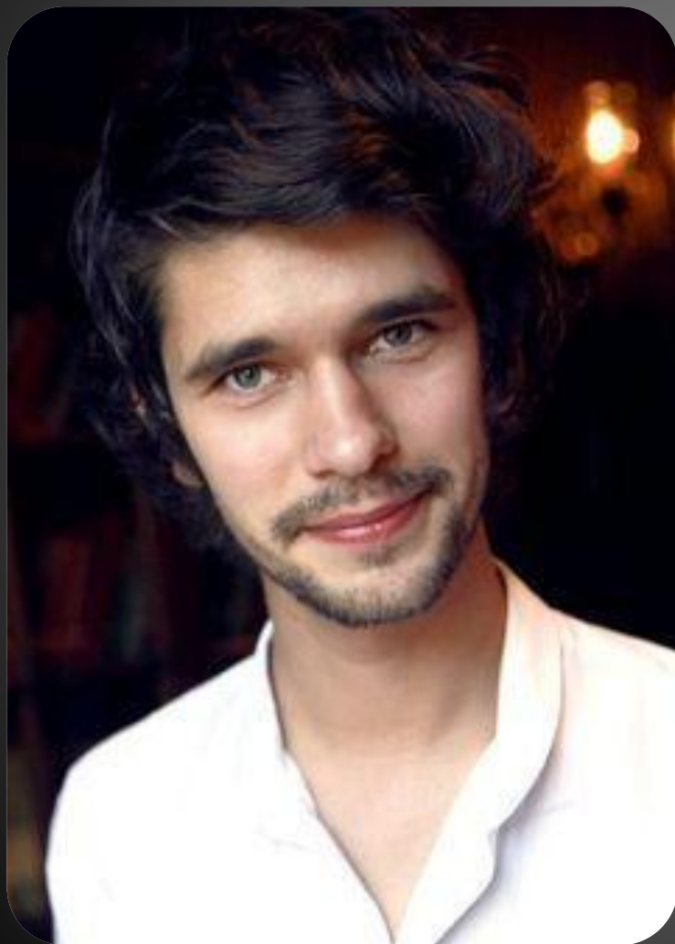
Джон Уишоу (Жан-Батист Гренуй )