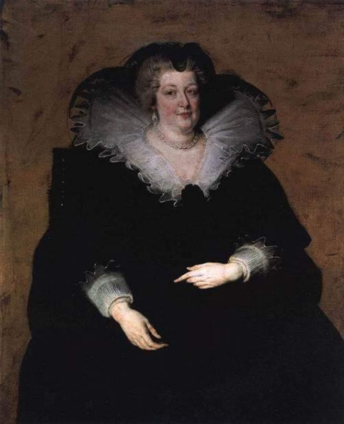
Питер Пауль Рубенс. Портрет королевы Франции Марии Медичи, 1622