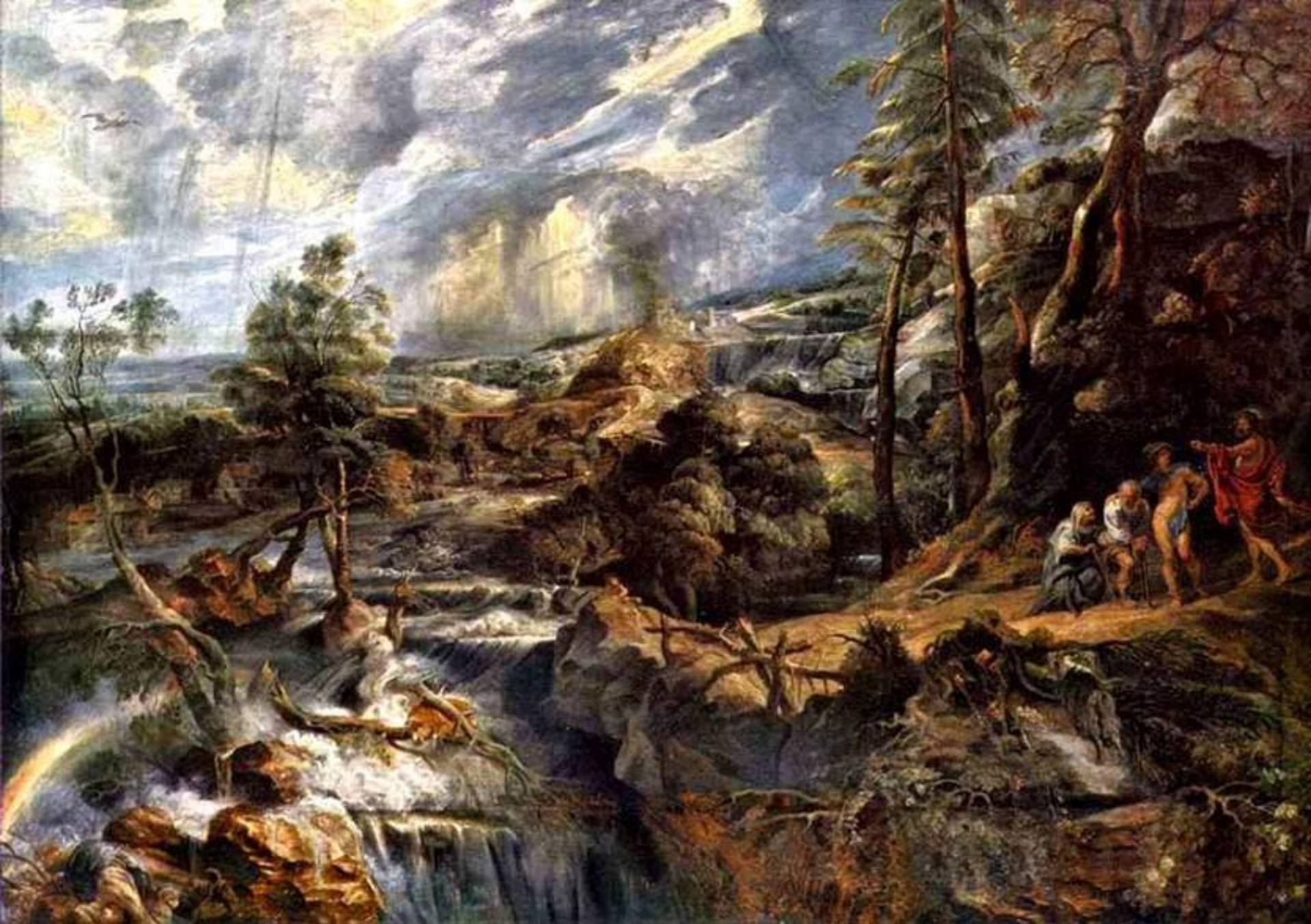
Пейзаж с Филемоном и Бавкидой 1637