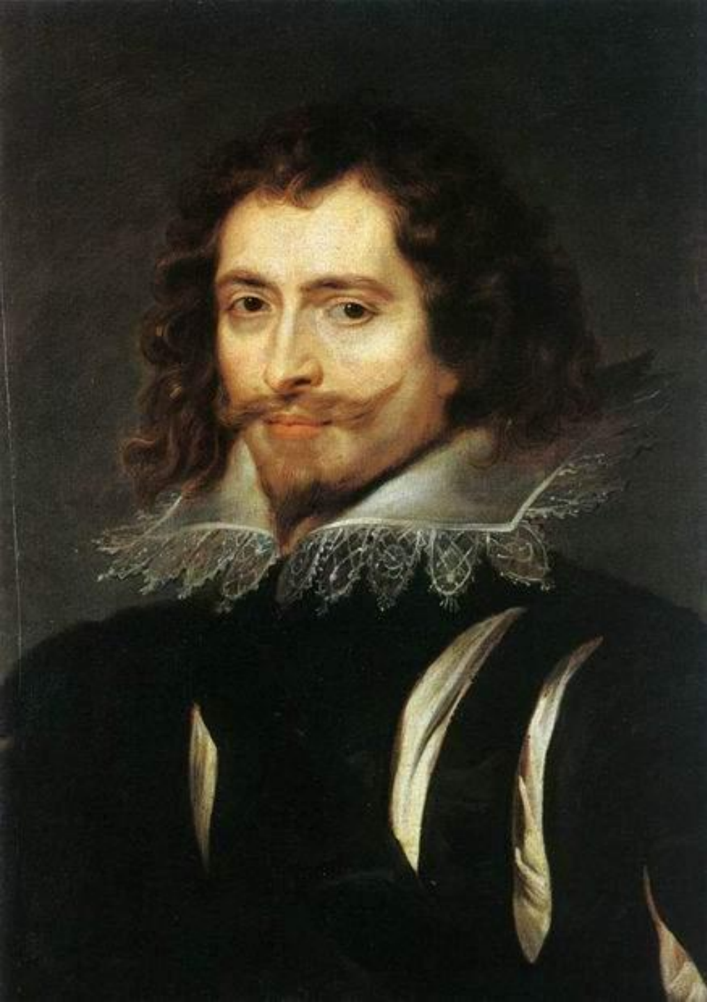
Портрет Дьюка Букингхема, 1625. Холст, масло, 63х48. Галерея Палатина, Флоренция, Италия