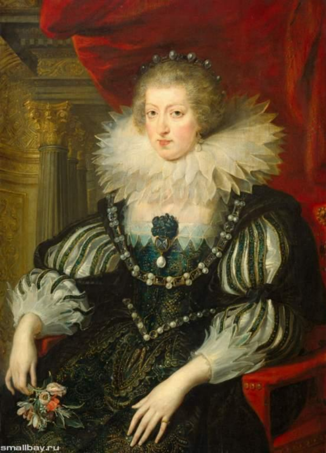
Анна Австрийская 1622