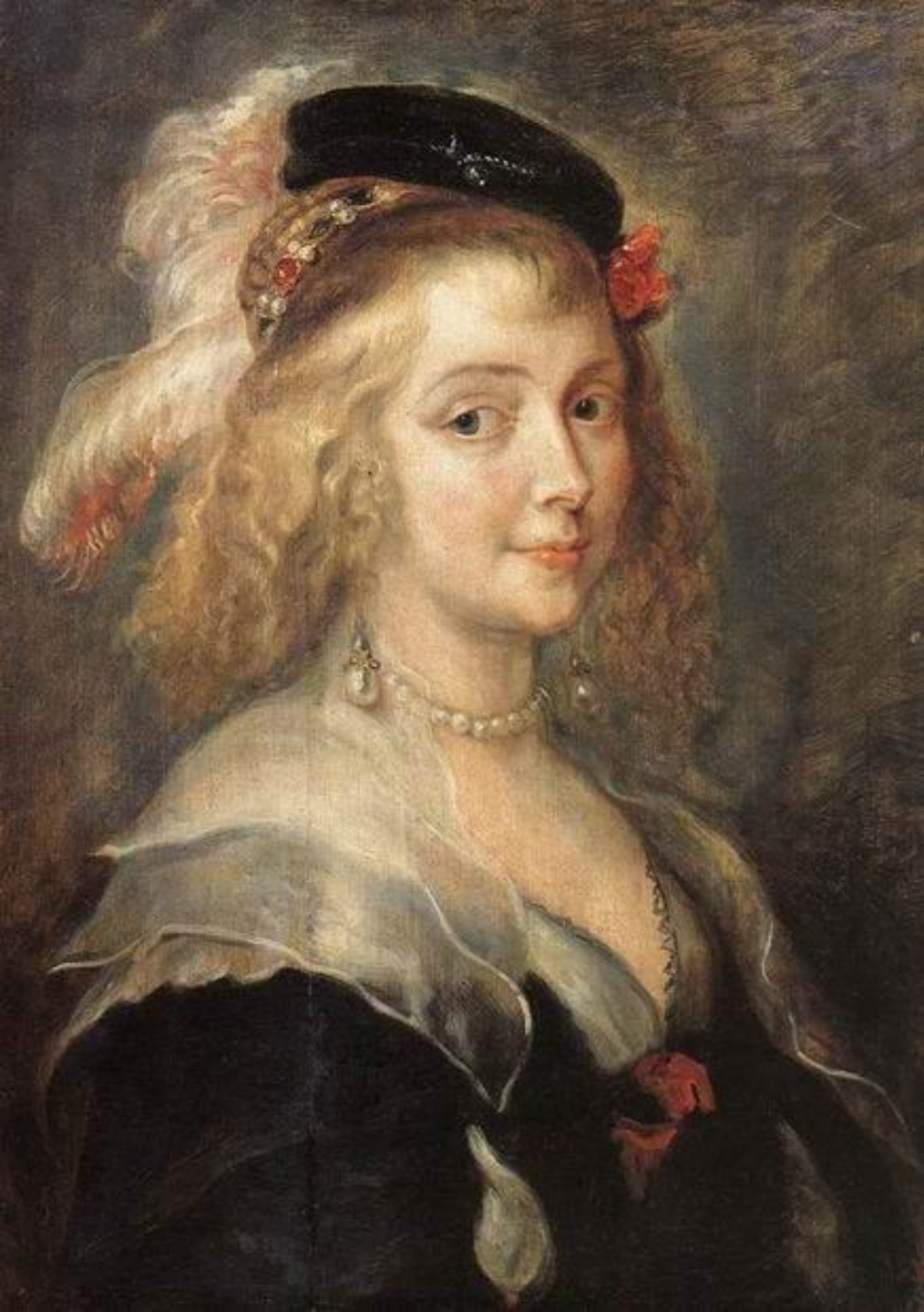
Портрет Елены Фоурмен, второй жены художника, 1630. Холст, масло, 262х206. Королевский Музей Изобразительных Искусств, Брюссель