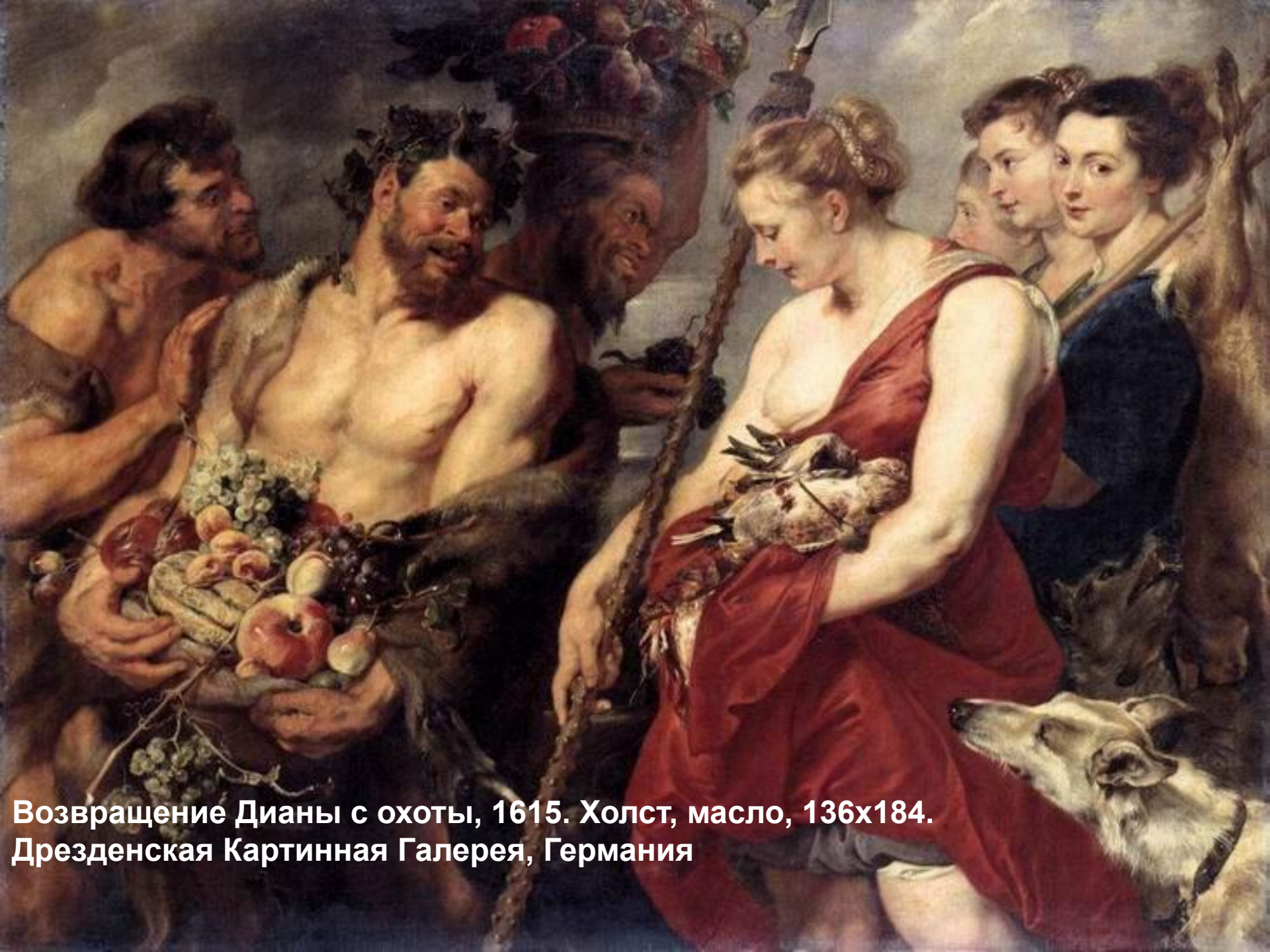
Возвращение Дианы с охоты, 1615. Холст, масло, 136x184. Дрезденская Картинная Галерея, Германия