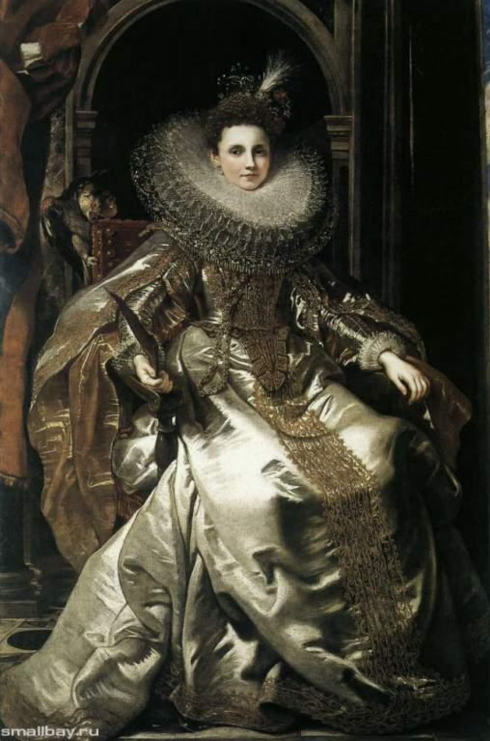
Мария Паллавичино 1606