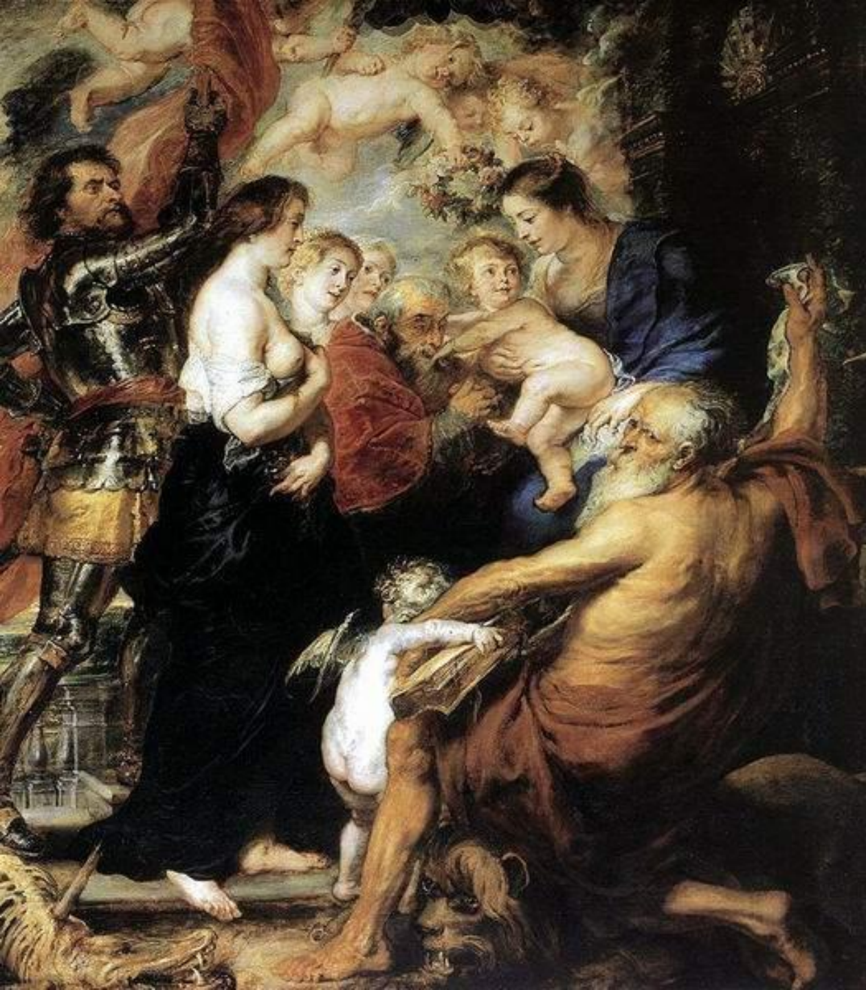
Мадонна со святыми и ангелами, 1634. Холст, масло Церковь Святого Иакова в Антверпене