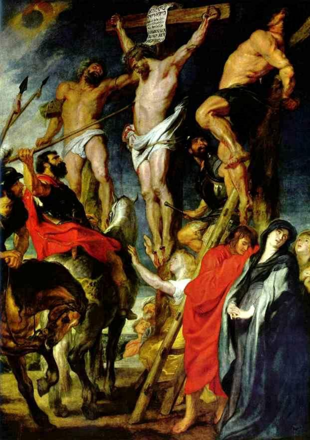
Распятие (Удар копья)1610