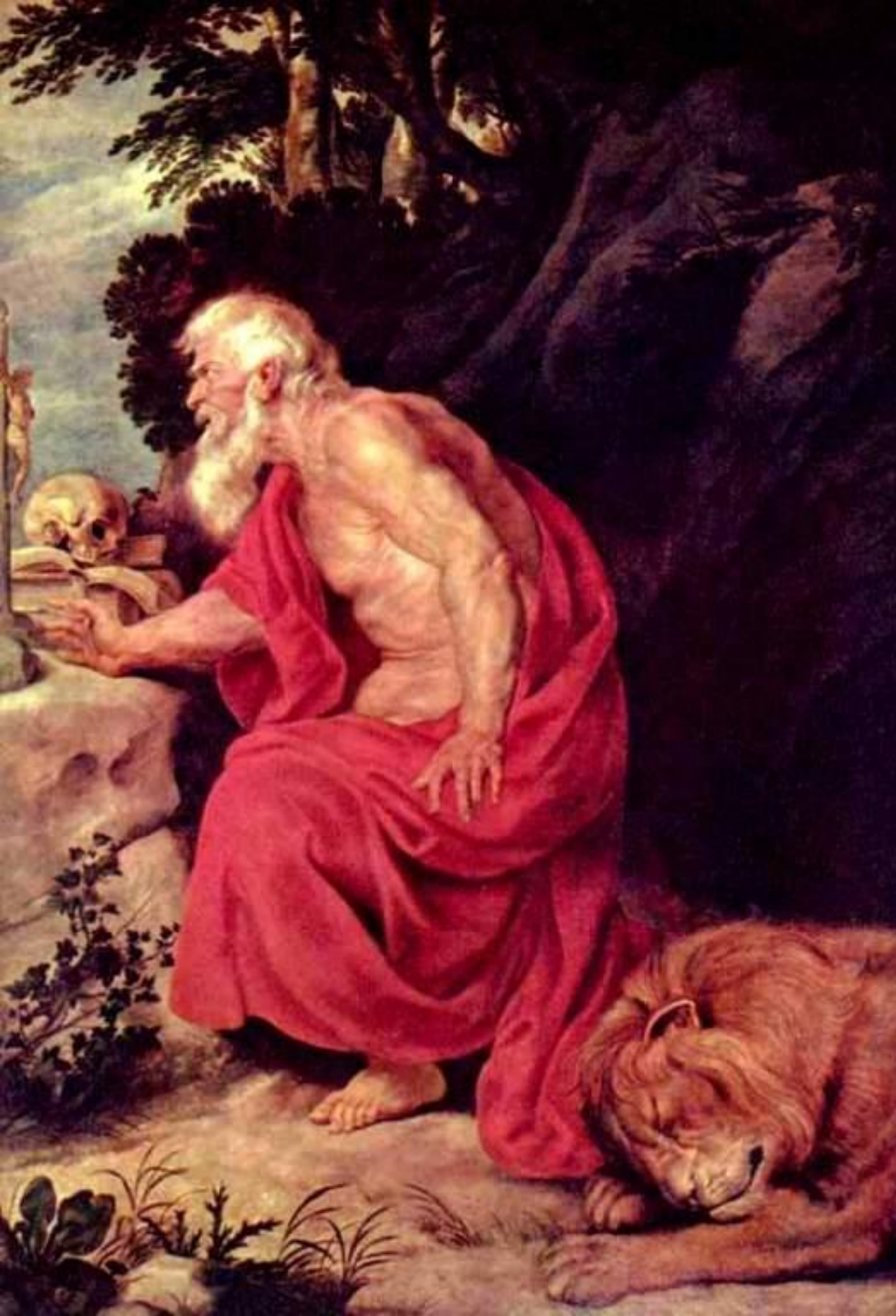
Святой Иероним 1635