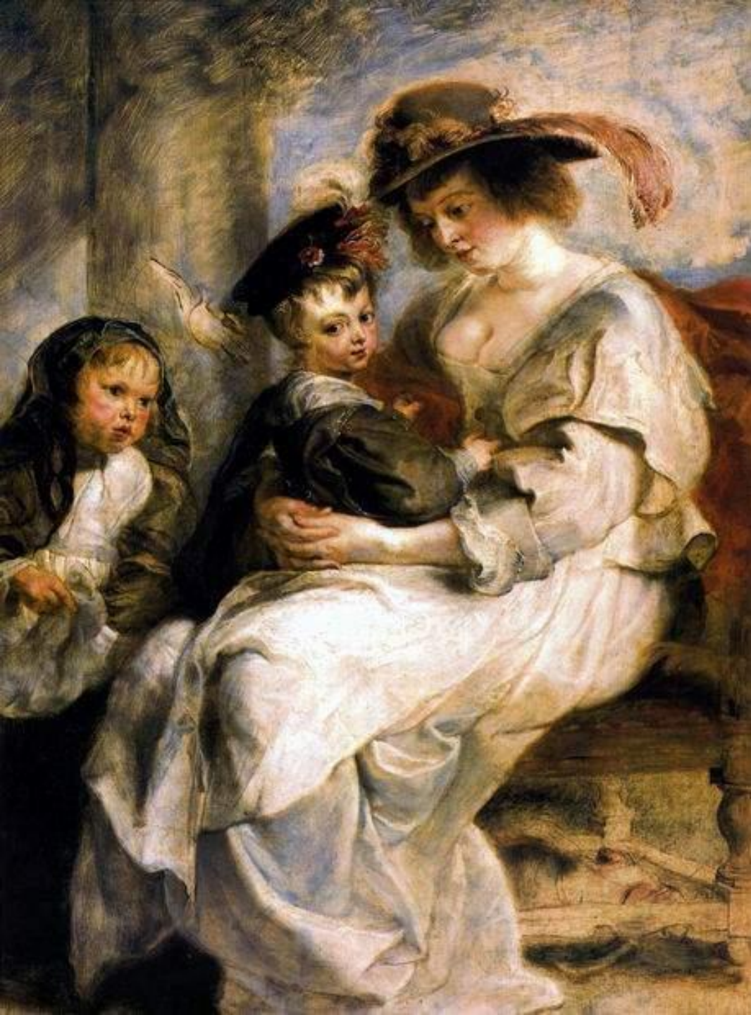
Елена Фоурмен с детьми, 1636-1637. Дерево, масло, 115x85. Музей Лувр, Париж