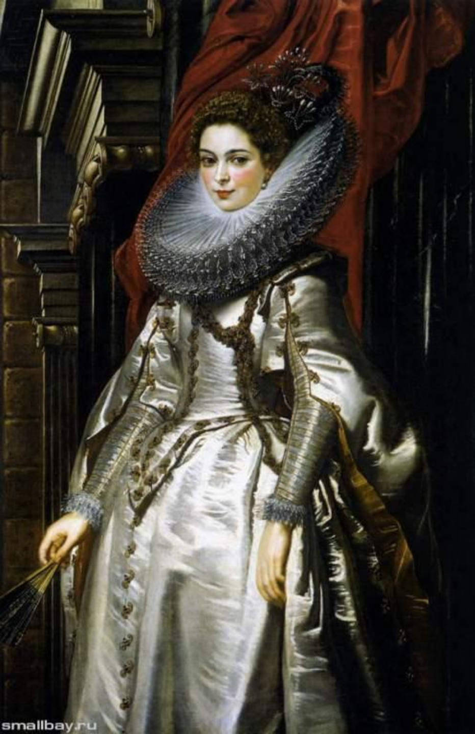
Маркиза Бригитта Спинола Дориа 1606, Галерея искусства, Вашингтон