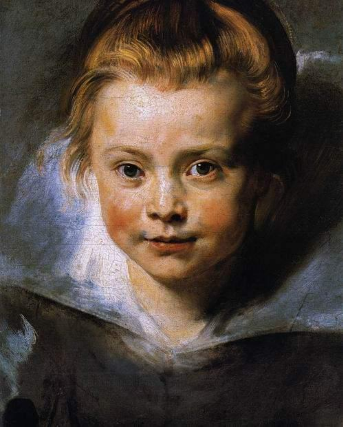
Портрет юной девочки, 1615-16. Холст, масло, 37х27. Вадус, Музей Лихнетштейна