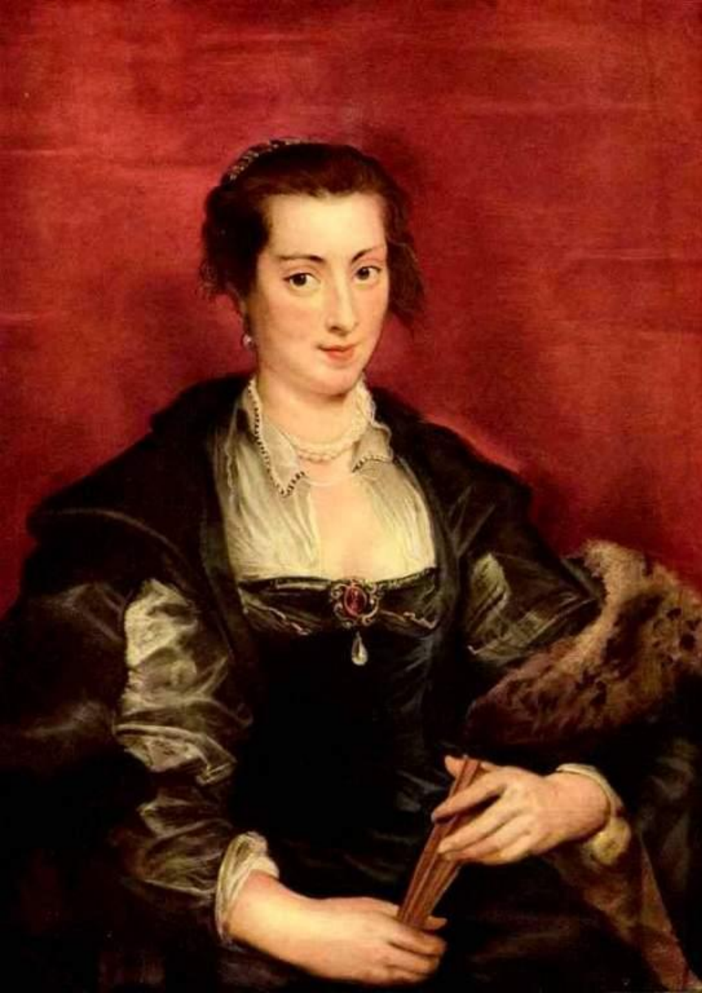
Портрет Изабеллы Брант 1610