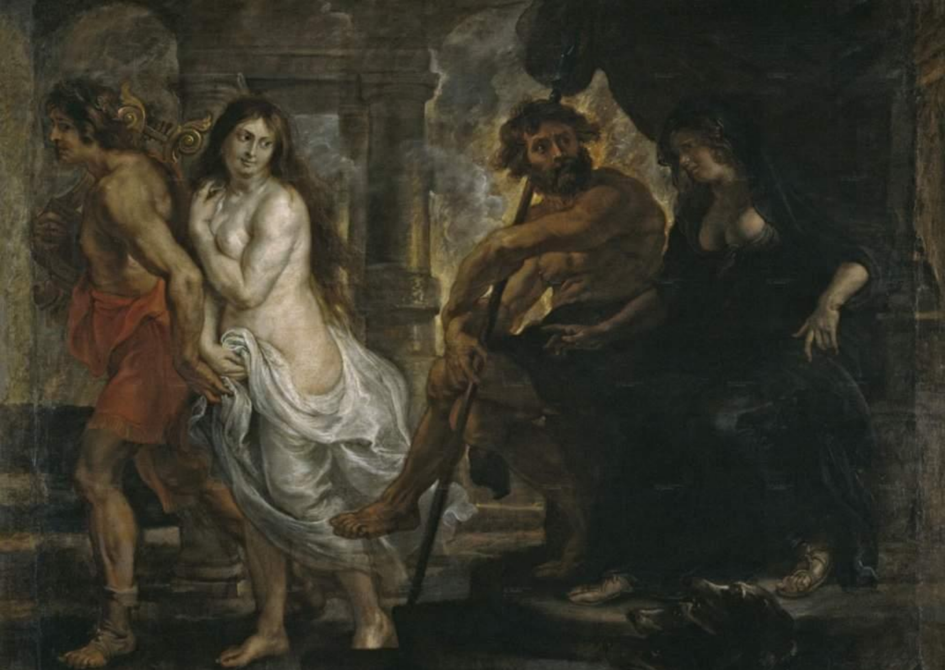
Орфей и Эвридика, 1636-1638