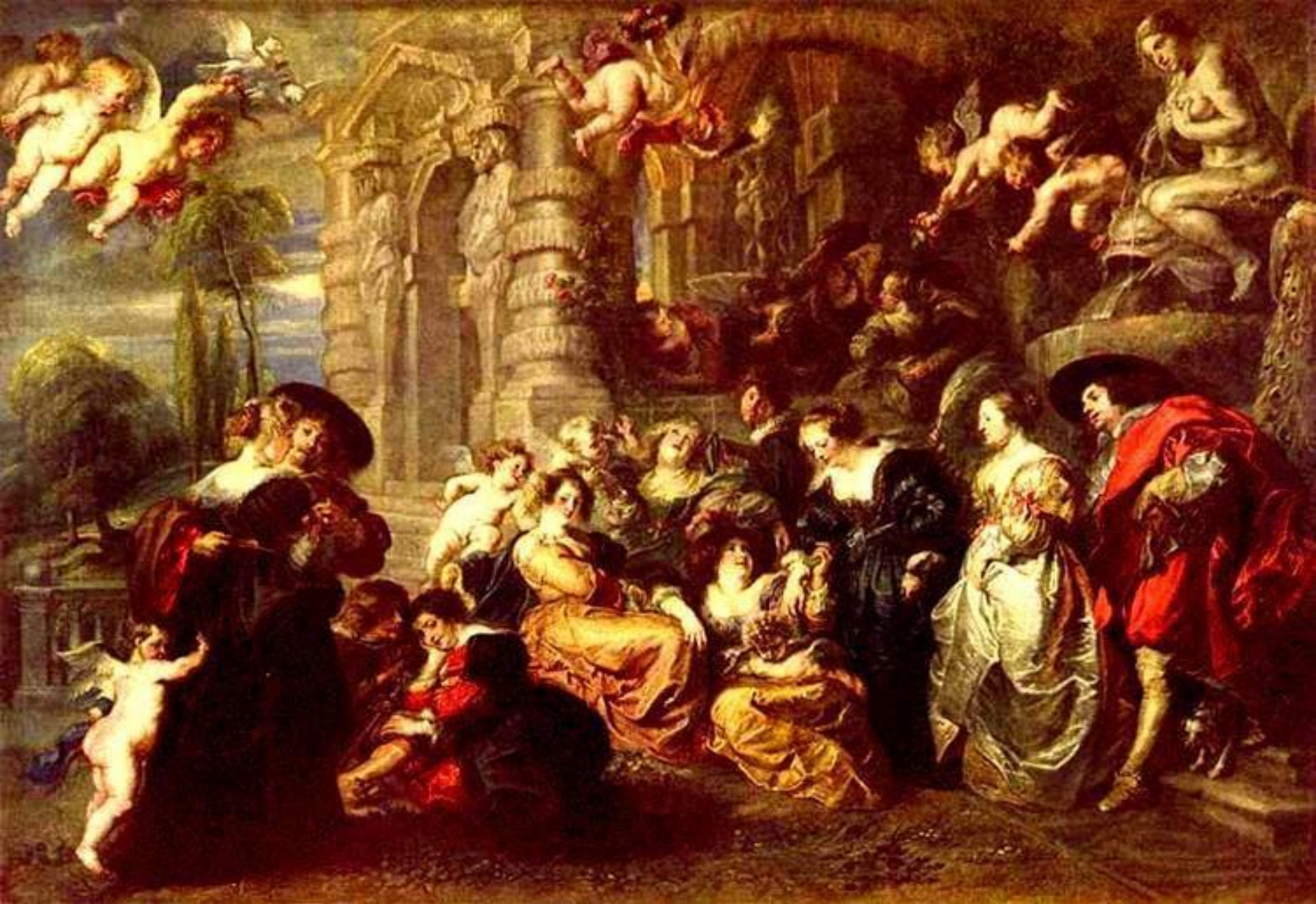
Сад любви 1631