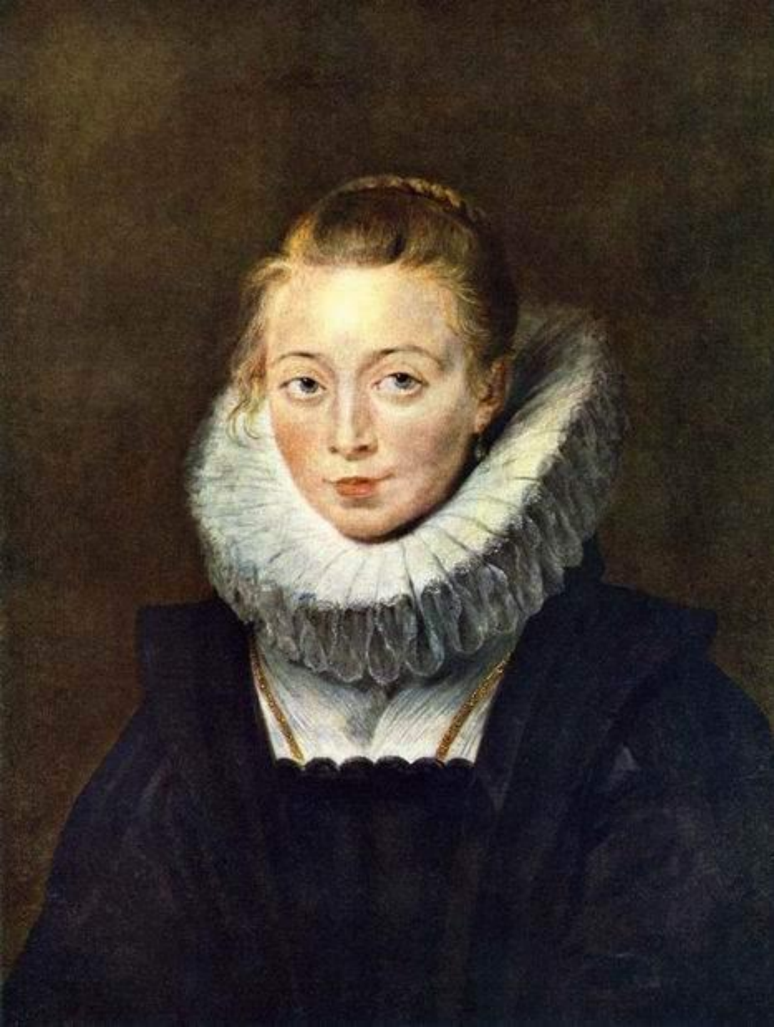
Питер Пауль Рубенс. Портрет камеристки, 1625