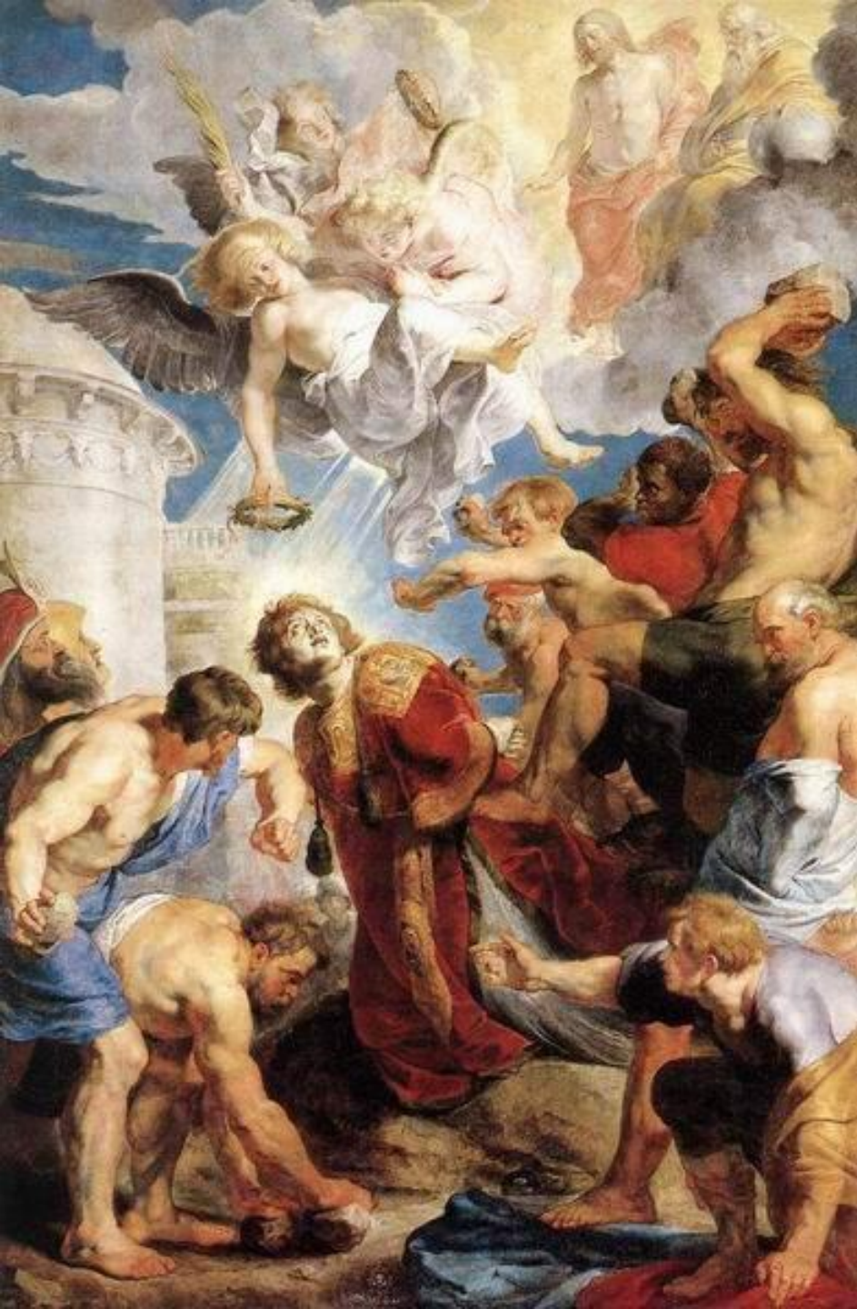
Мучения Святого Стефана, 1616-1617. Холст, масло, 437x278. Валенсия, Музей Изобразительных Искусств, Испания