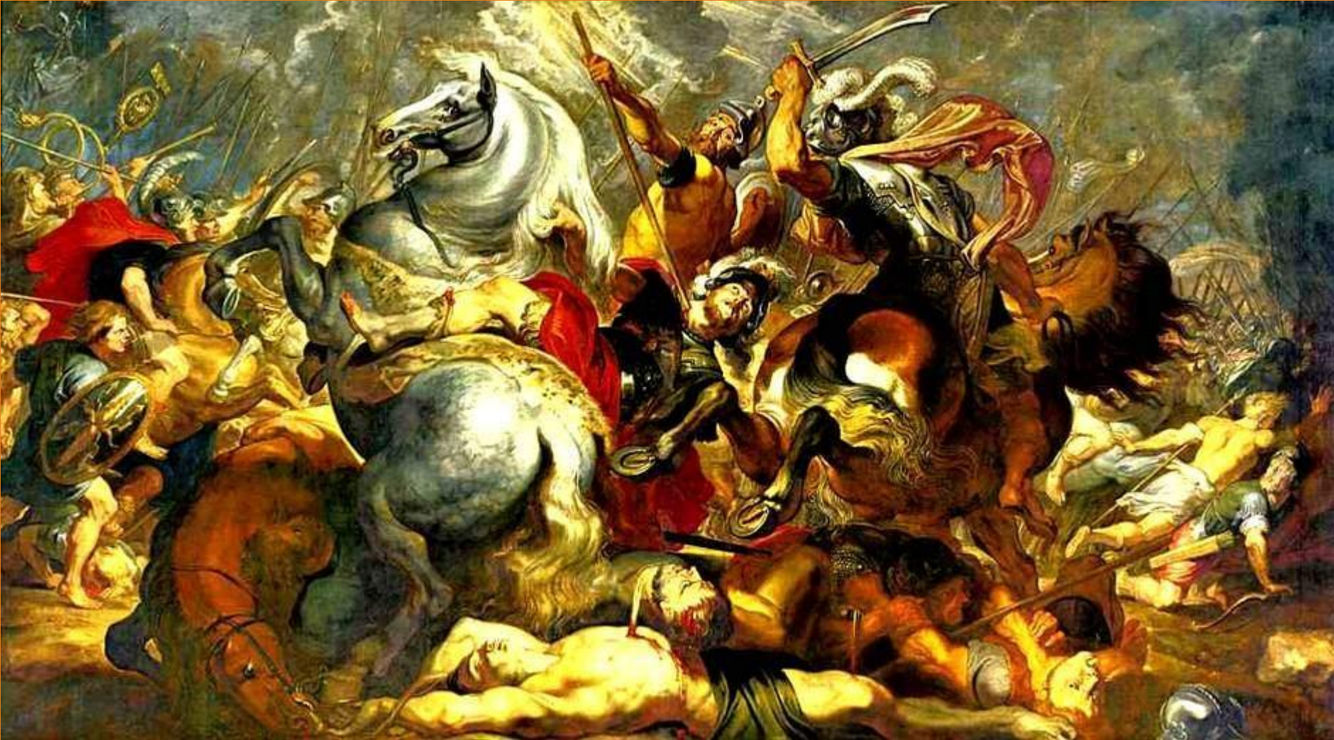
Победа и смерть консула Деция Муса в бою 1617