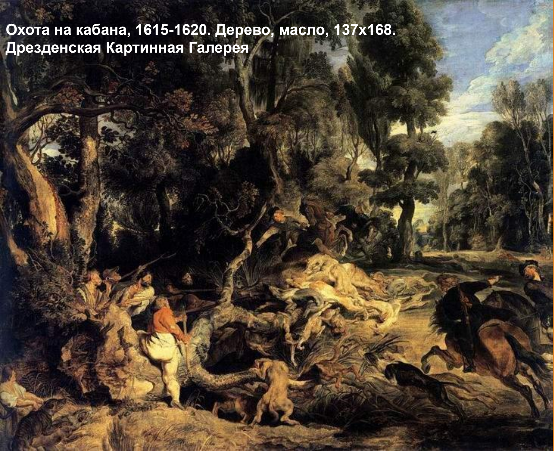
Охота на кабана, 1615-1620. Дерево, масло, 137x168. Дрезденская Картинная Галерея