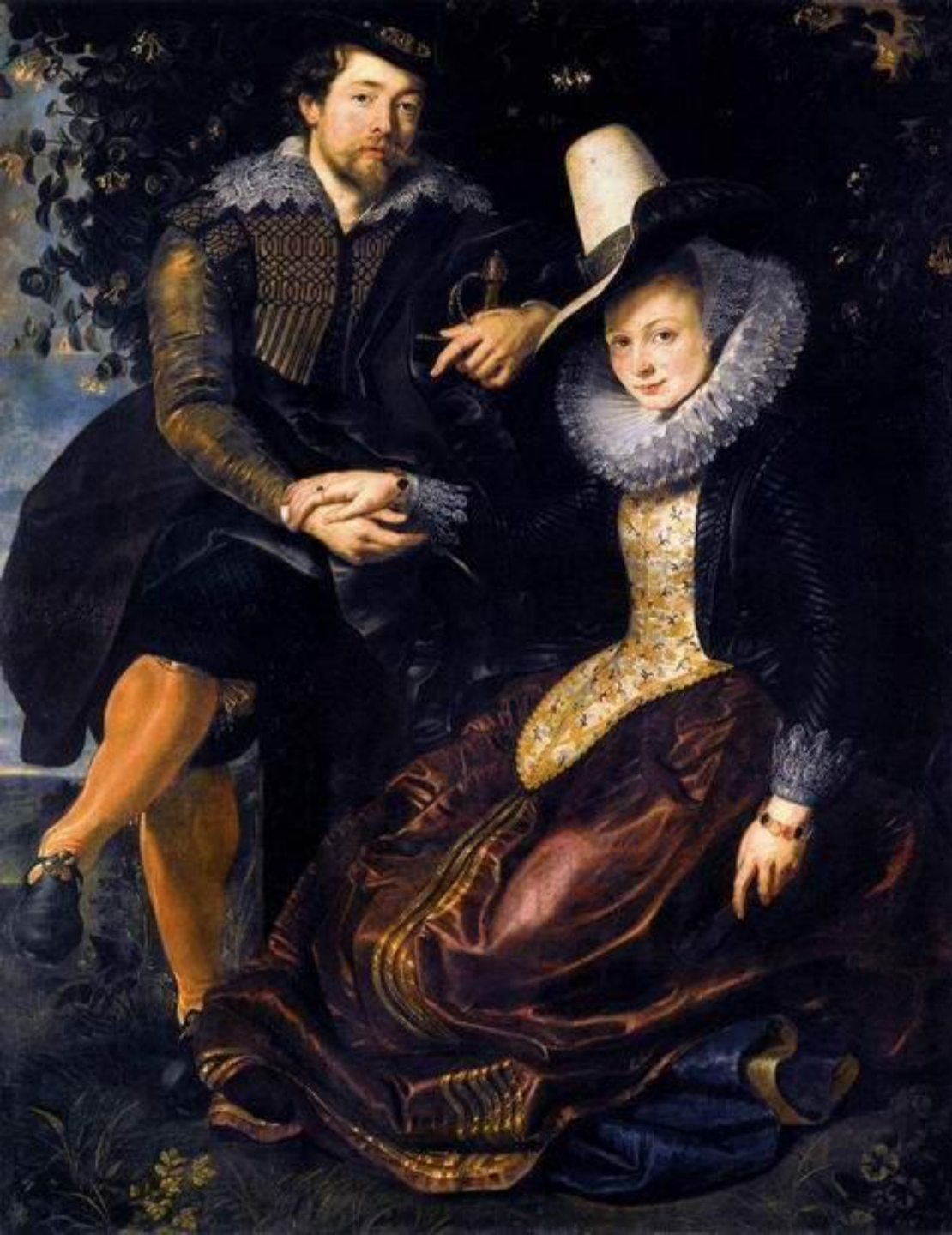
Автопортрет Рубенса с первой женой, Изабеллой Брандт, 1609-1610. Холст, масло, 178x136. Альт Пинакотека, Мюнхен