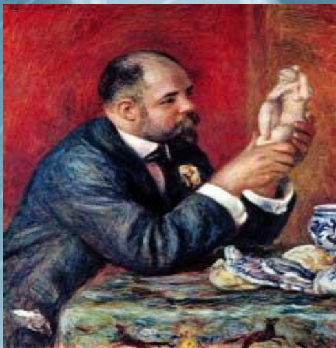
«Портрет Амбруаза Воллара»