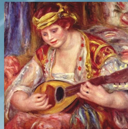
«Женщина с мандолиной»