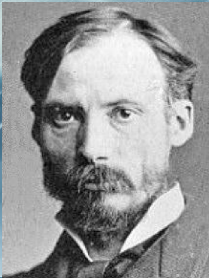
Ренуар, Пьер Огюст (25 февраля 1841-2 декабря 1919)