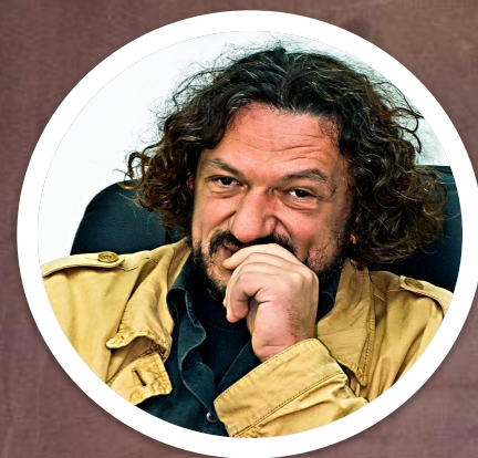
Концерт-перформанс "Сны заброшенной дороги" ЦСМ ДАХ, ДахаБраха, Режиссёр Влад Троицкий (концертная сцена)