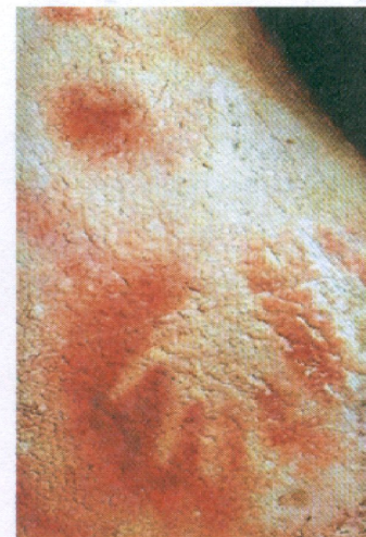
Оттиск человеческой руки. Палеолит. Пещера Пеш- Мерль, Франция