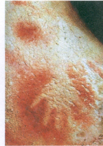
Оттиск человеческой руки. Палеолит. Пещера Пеш- Мерль, Франция

■ К древнейшим изображениям следует также отнести и оттиски человеческой руки с широко расставленными пальцами, обведенные контуром.