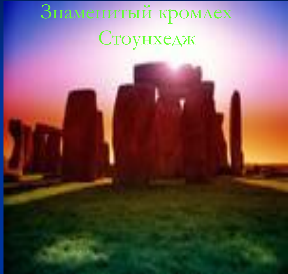
Знаменитый кромлех Стоунхедж