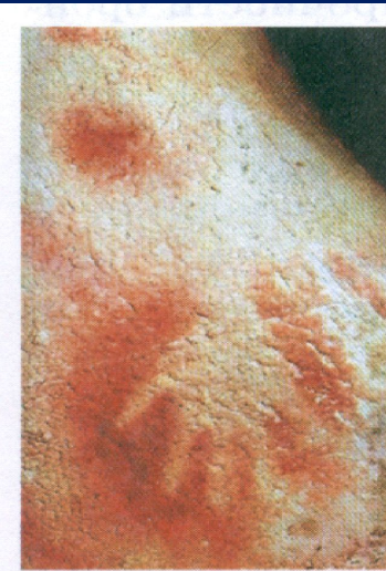
Оттиск человеческой руки. Палеолит. Пещера Пеш- Мерль, Франция