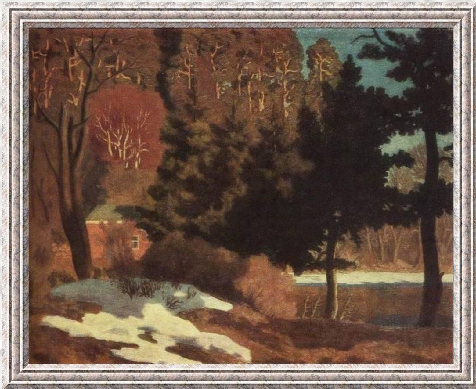
Николай Крымов. Первый снег.