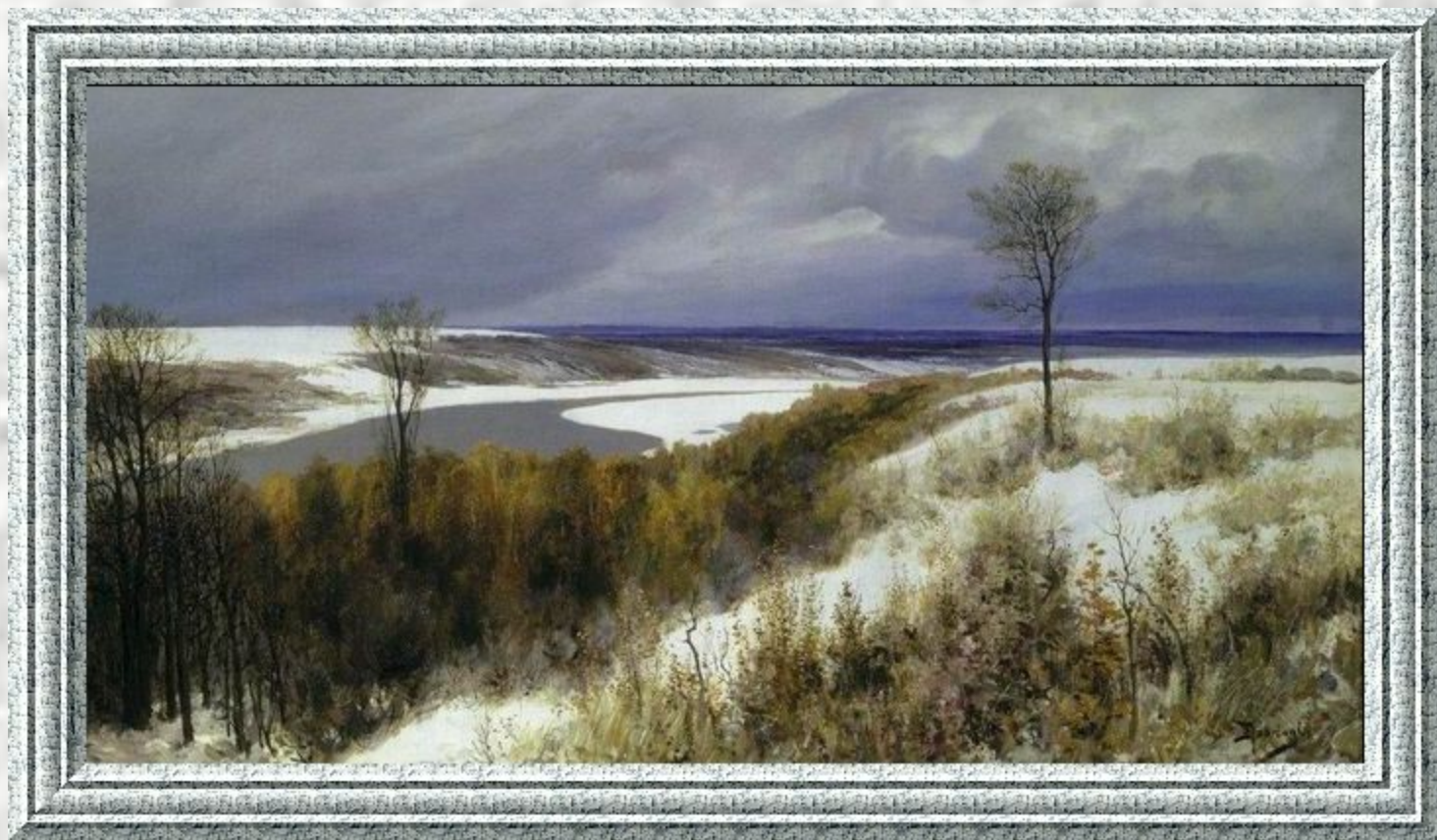
Василий Поленов. Первый снег.