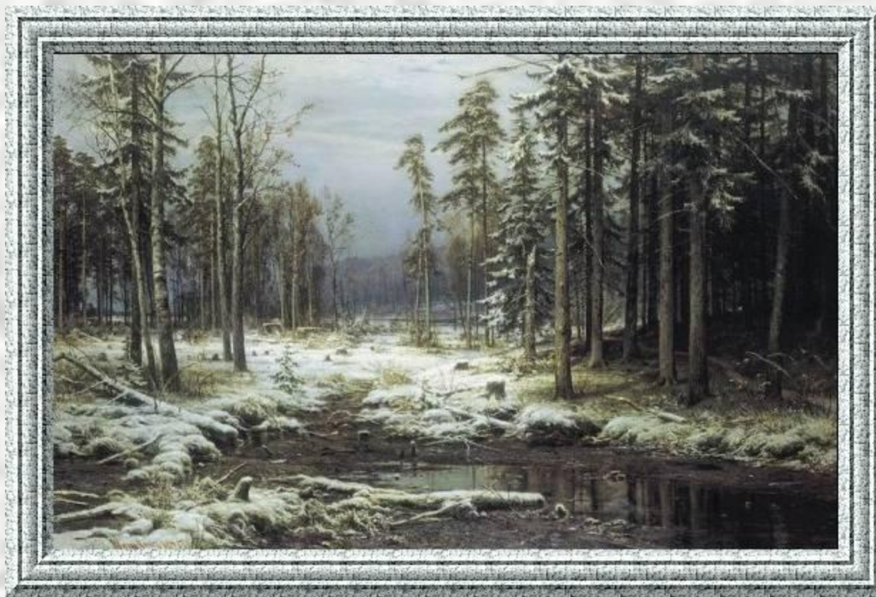
Иван Шишкин. Первый снег.