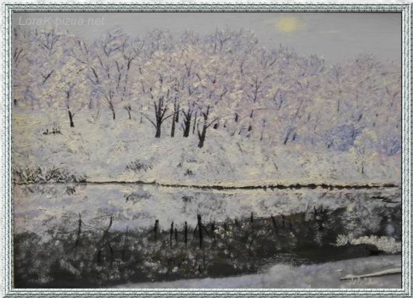
Лора К. Первый снег.