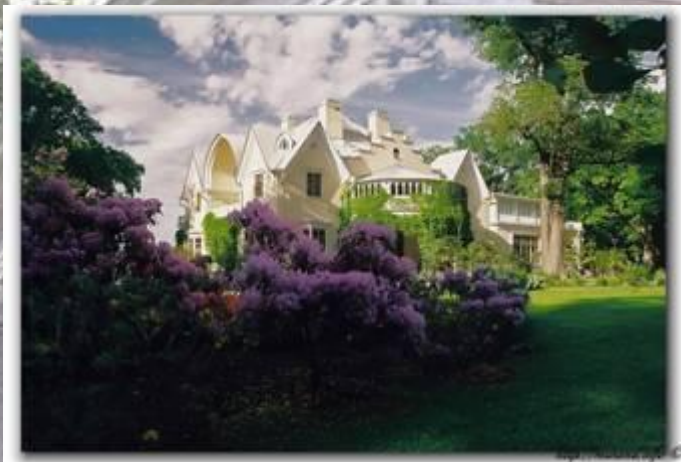
Дворец Коттедж – резиденция Николая II