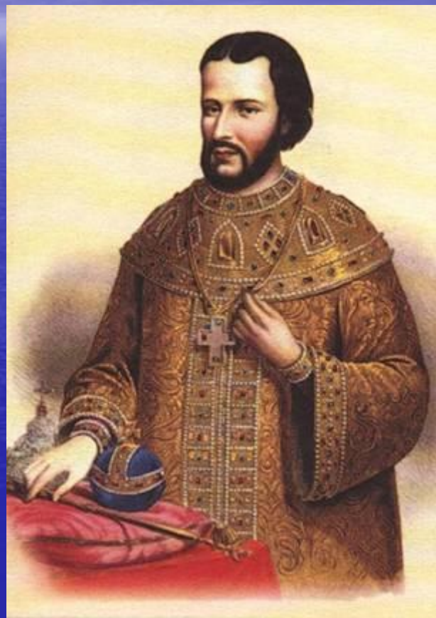
Царь Иоанн Алексеевич