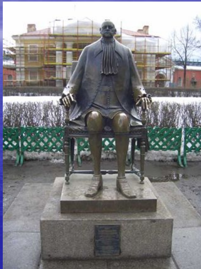
Памятник Петру I. Скульптор М.Шемакин.