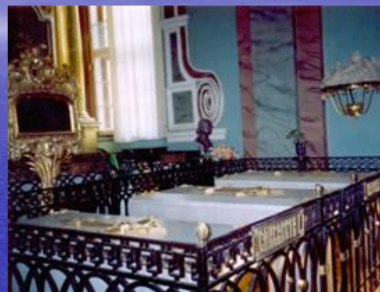
Надгробие могилы Елизаветы Петровны