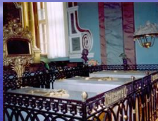
Надгробие могилы Елизаветы Петровны