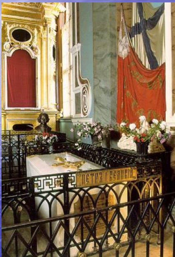
Надгробие могилы Петра I