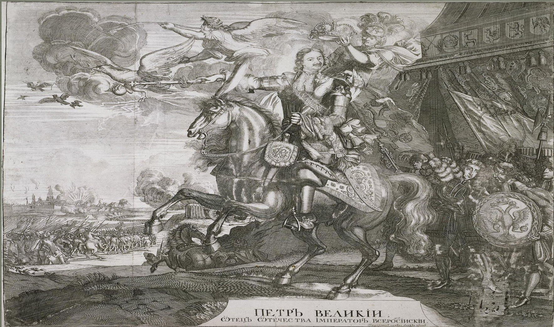
ПЕТРЪ ВЕЛИКІИ СѢТЕЦЪ СѢТЕЧЕСТВА ІМПЕРАТОРЪ ВСЕРОССІНСКІИ. А. Зубовъ иже и дѣлалъ оубо.