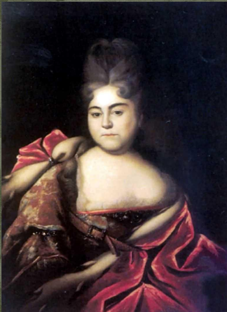
И. Никитин. Портрет царевны Натальи Алексеевны