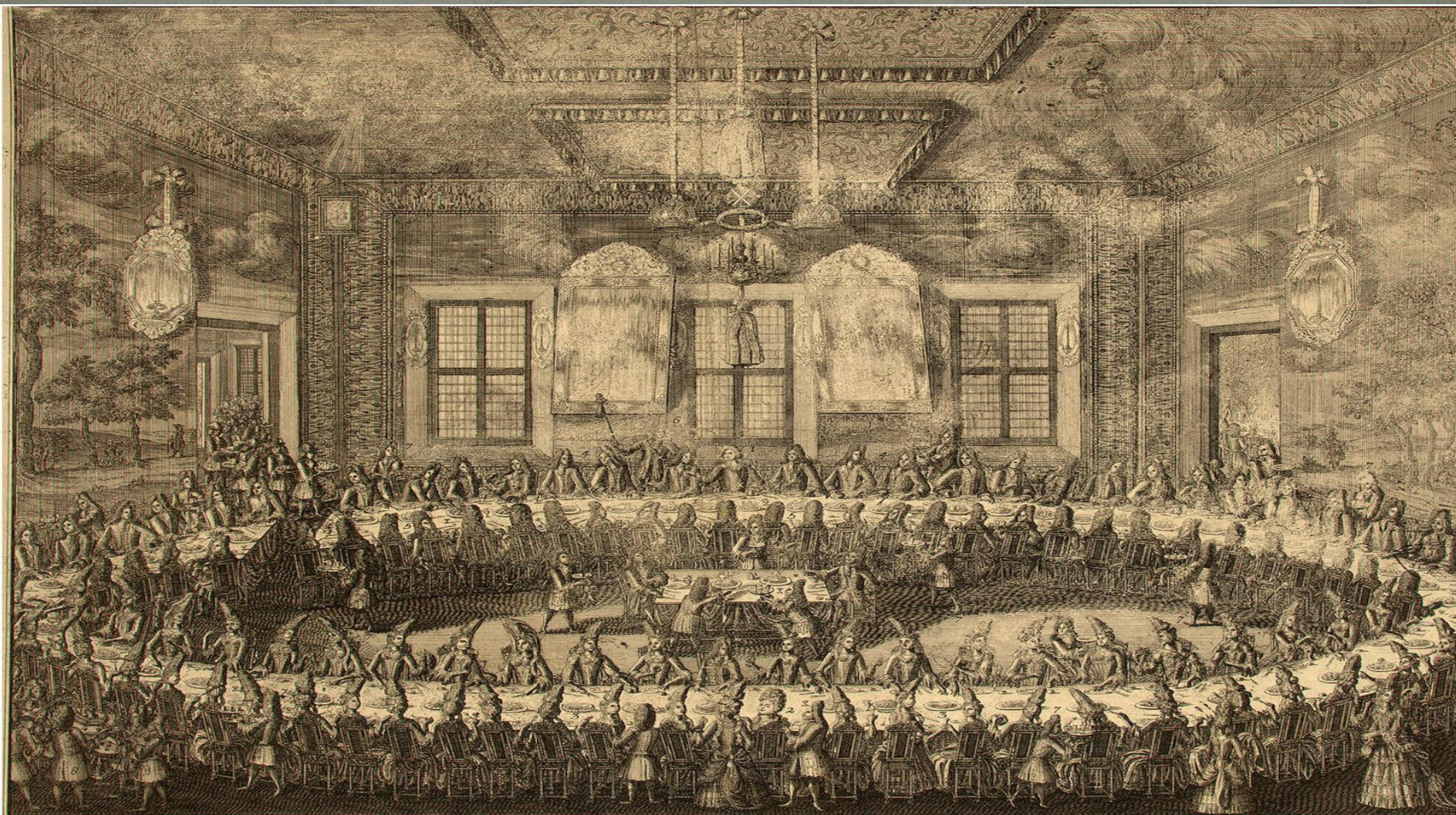
ИЗОБРАЖЕНІЕ БРАКА ЕГО ЦАРСКОГО ВЕЛИЧЕСТВА ПЕТРА ПЕРВАГО САМОДЕРЖЦА ВСЕРОССИЙСКАГО, и прѣдана . Ету чата, и прѣдана . Которой управляетъ всаиѣмъ петербурге Феврал 1742 1. Его Величество . 2. Её Величество . 3. Фамилія ихъ Величестваъ Курящихъ . 4. Министры . 5. Атдинсон . 6. Пѣлсон . 7. и прѣдана . 8. Росинские . Министры . 9. Адмиралъ . 10. Генералъ . 11. и прѣдана . 12. Маршалъ . 13. Его Величестваъ Князь . 14. Министръ . 15. Посла шафрам . 16. и прѣдана . 17. и прѣдана .