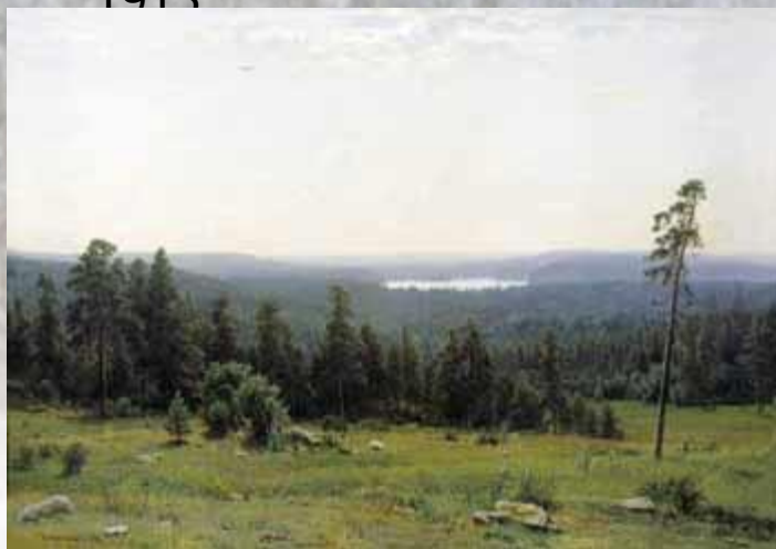
Иван Шишкин Лесные дали