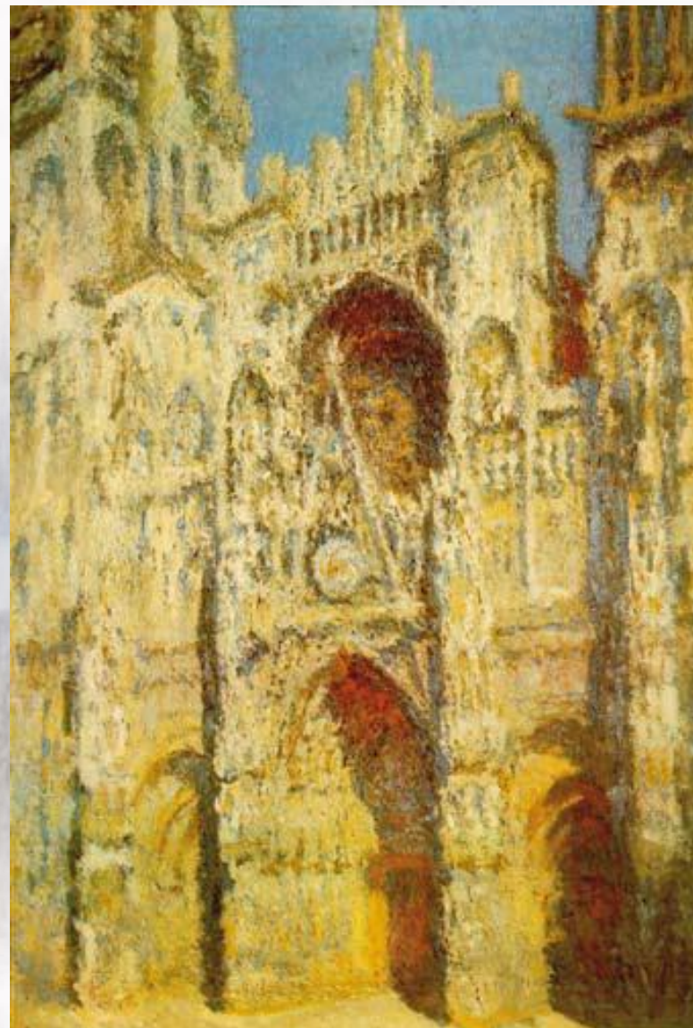
К. Моне. Реймский собор на восходе солнца

В XX в. в зарубежном изобразительном искусстве возникло направление, которое получило название «импрессионизм» (от франц. impression — впечатление). Художники-импрессионисты старались зафиксировать в своих картинах мимолетные впечатления от реально существующего мира.