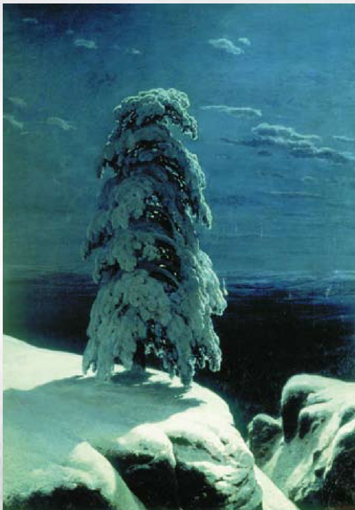
Иван Шишкин На севере диком

А. Пушкин называл искусство «магическим кристаллом» , сквозь грани которого по-новому видны окружающие нас люди, предметы и явления привычной жизни.