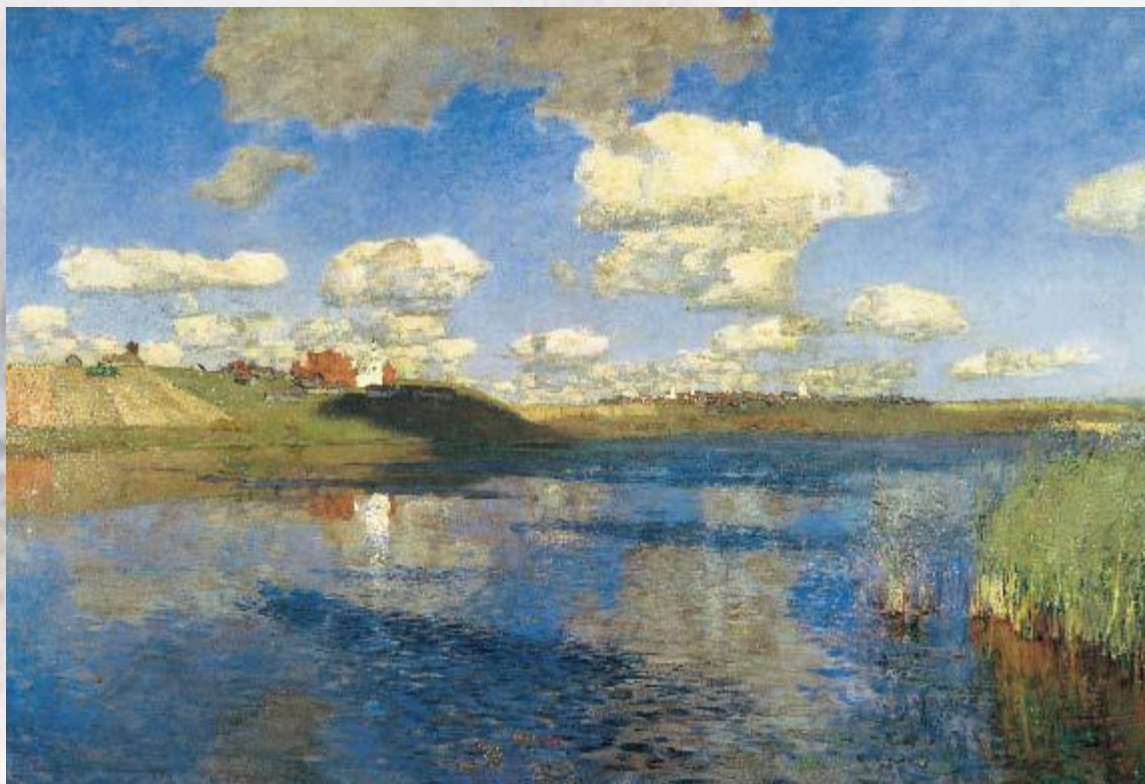
И. Левитан. Озеро. Русь