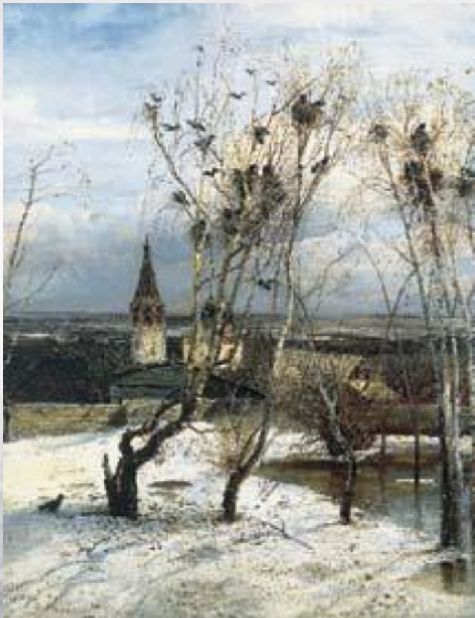
А. Саврасов. Грачи прилетели.

Русские художники XIX в. А. Саврасов, И. Левитан, И. Шишкин и другие открыли красоту родной земли.