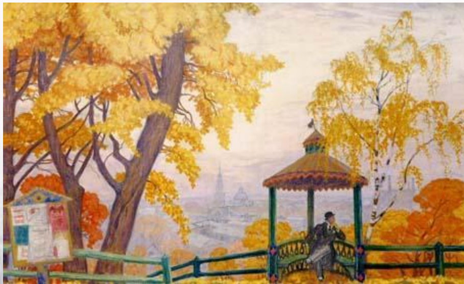
Борис Кустодиев. Осень. 1915

Во все времена живописцы, композиторы и писатели воплощают в своих произведениях различные явления природы, волновавшие их.