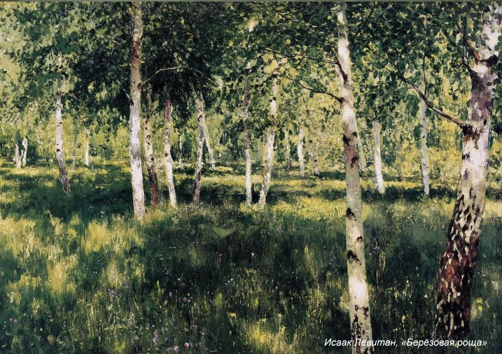
Исаак Левитан, «Берёзовая роща»