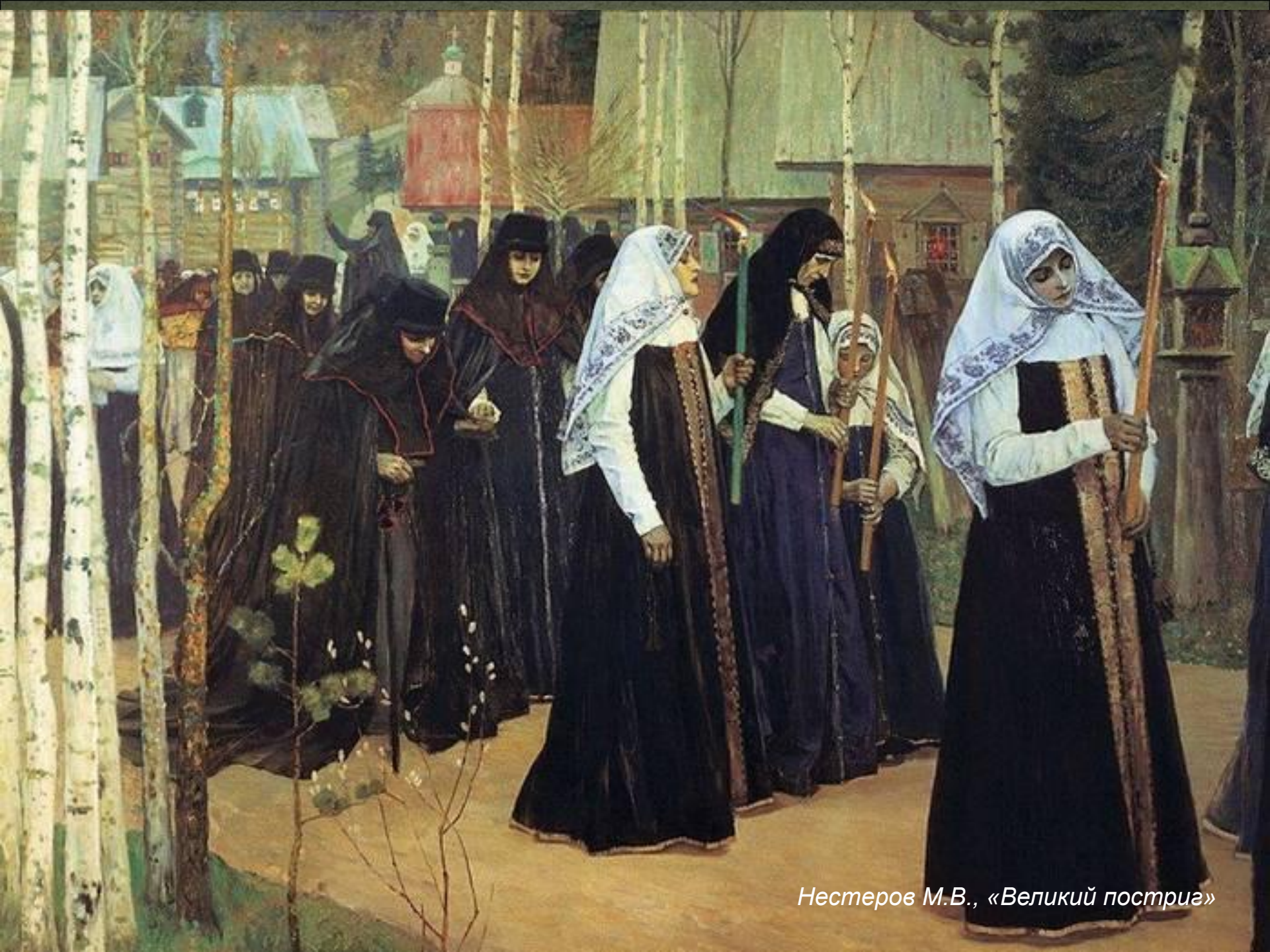
Нестеров М.В., «Великий постриг»