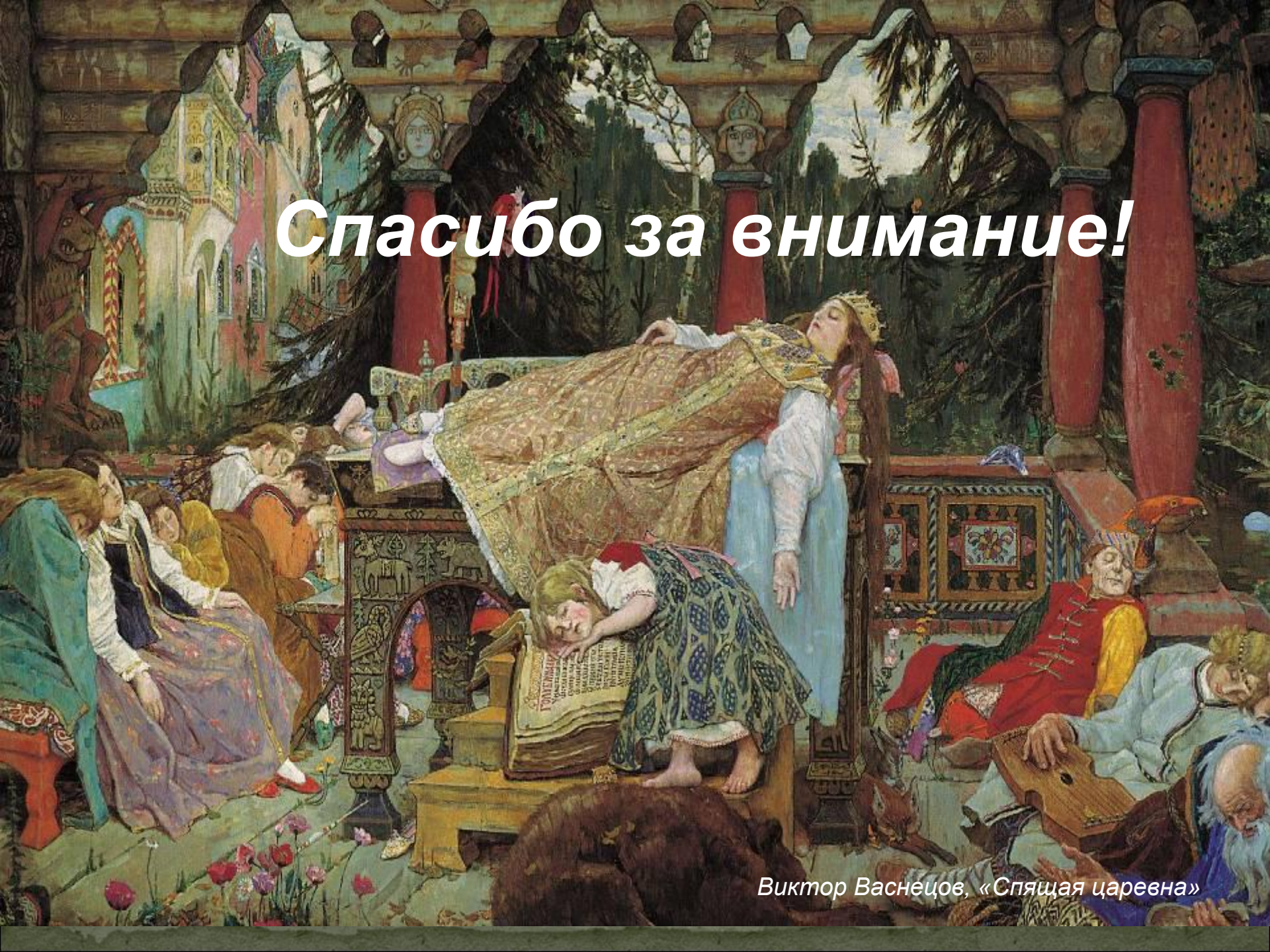
Виктор Васнецов, «Спящая царевна»