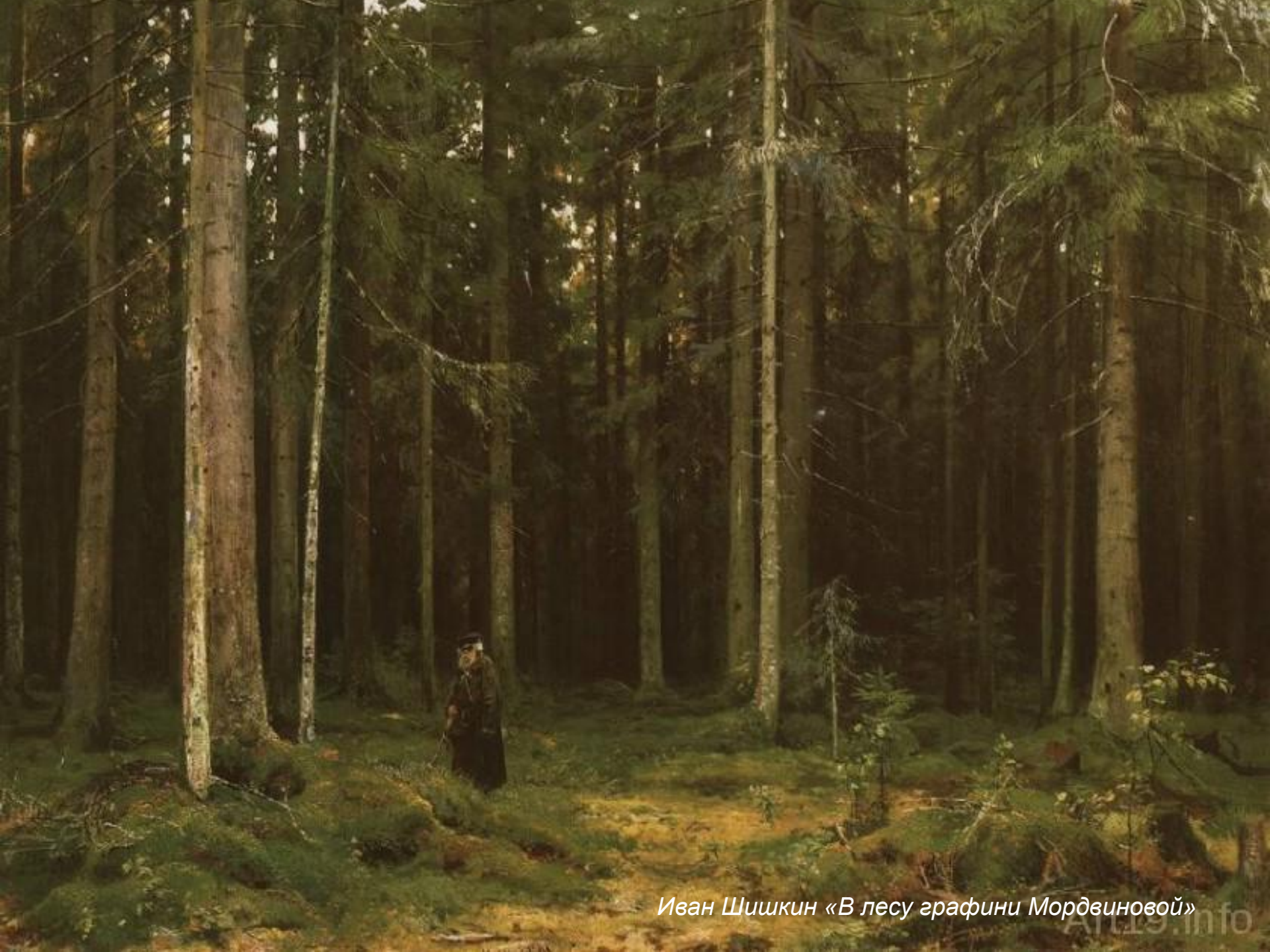
Иван Шишкин «В лесу графини Мордвиновой»