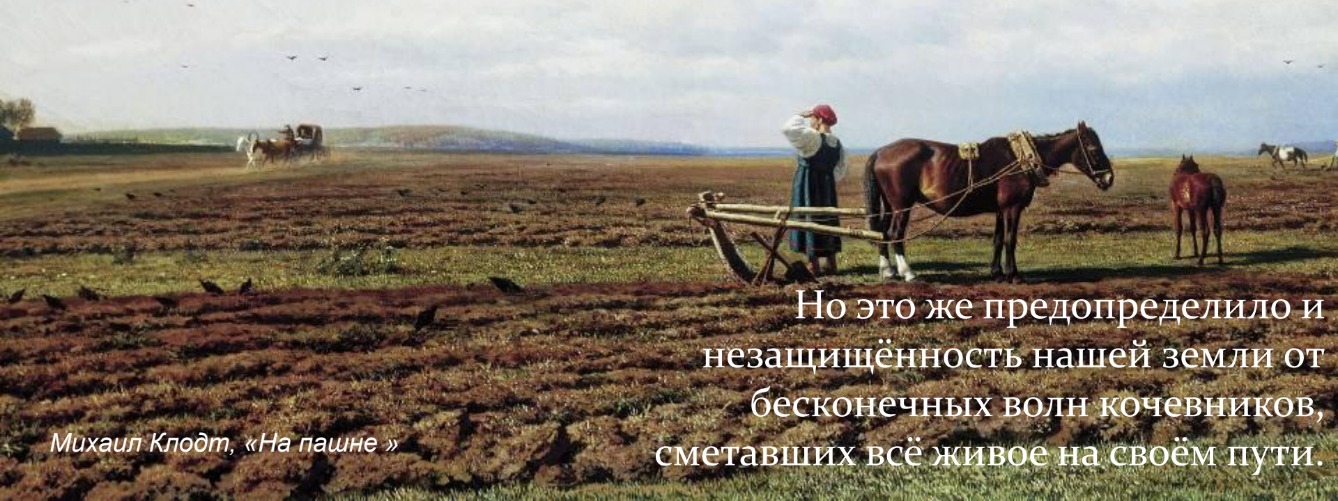
Михаил Клодт, «На пашне»

Открытость Восточно-Европейской равнины, не пересечённость горными хребтами или иными непроходимыми препятствиями, породила такую особенность русского характера, как открытость души.