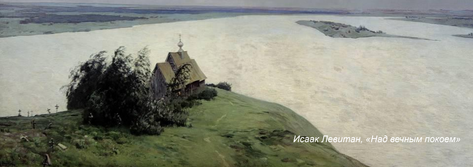
Исаак Левитан, «Над вечным покоем»

Реки не только кормили русского человека своими обильными запасами, но они предоставляли в его распоряжение удобную сеть летних и зимних путей сообщения. По реке шла русская колонизация, по берегам рек строились города, села, маленькие деревушки, рыбацьи и охотничьи хижины. Взаимная близость речных бассейнов способствовала общению и сближению населения различных областей.