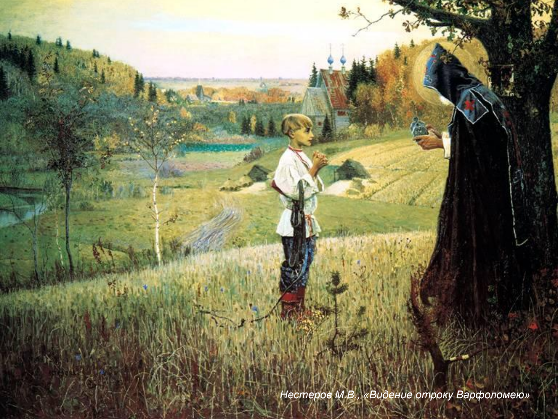
Нестеров М.В., «Видение отроку Варфоломею»