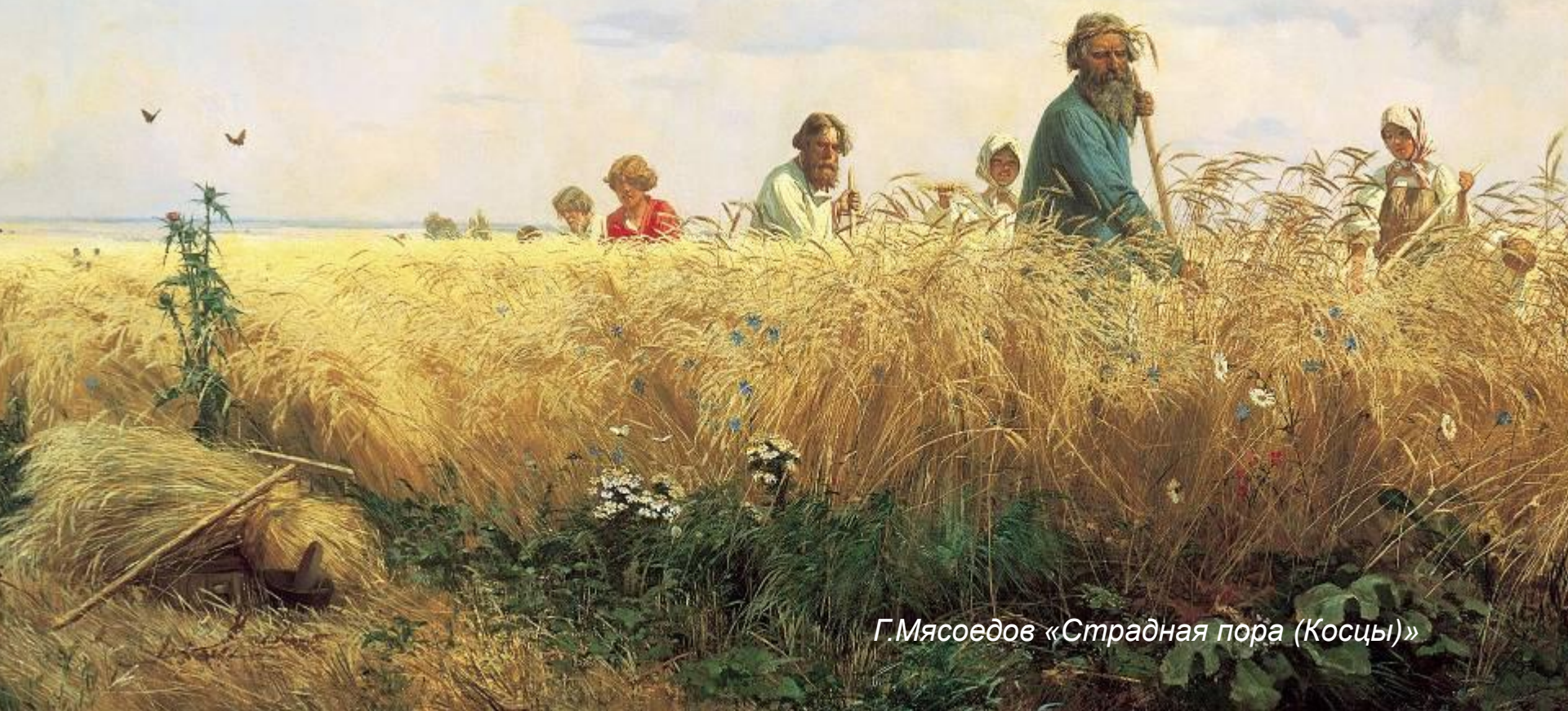
Г. Мясоедов «Страдная пора (Косцы)»

Пропитание наши предки издревле добывали охотой, рыболовством и хлебопашеством. При этом пахотные земли приходилось «отвоёвывать» у лесов и болот упорным трудом. Таким образом, вырабатывалось в русском народе упорство.