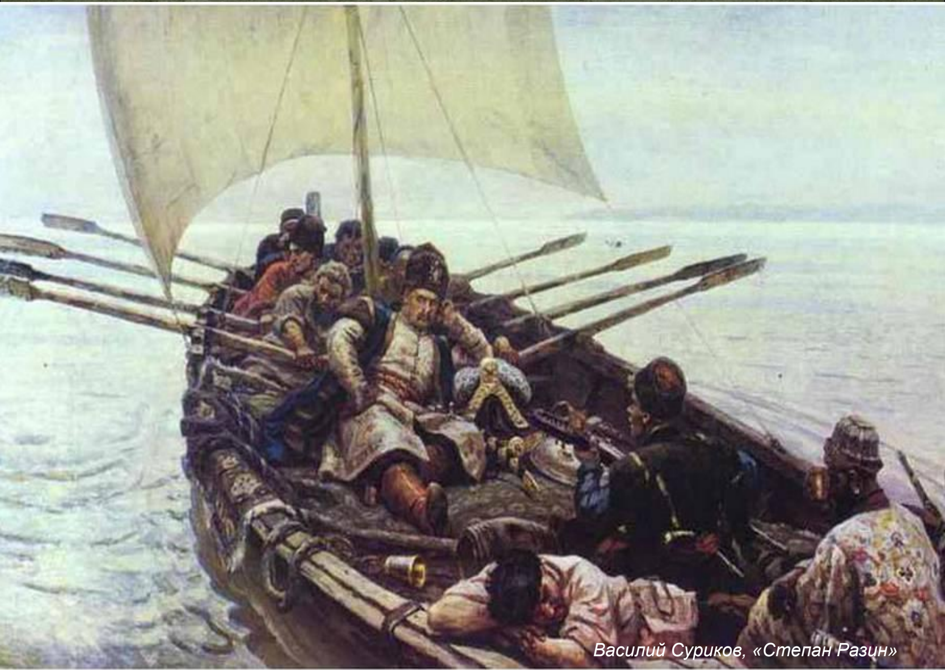
Василий Суриков, «Степан Разин»