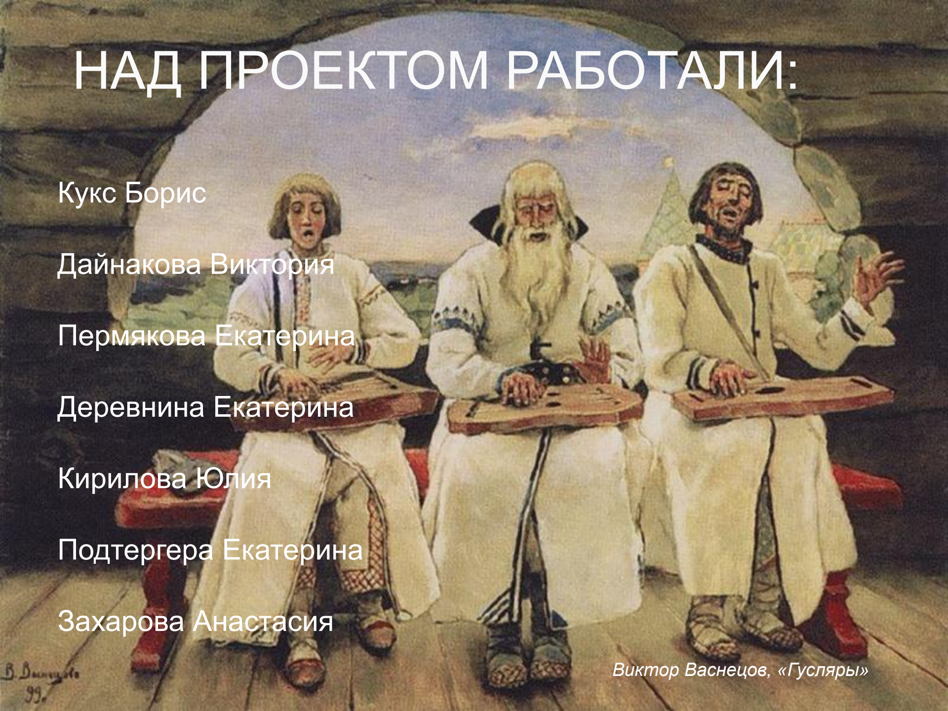
Виктор Васнецов, «Гусляры»