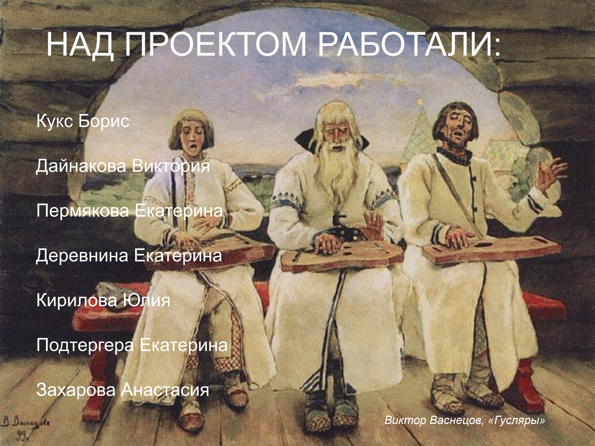
Виктор Васнецов, «Гусляры»