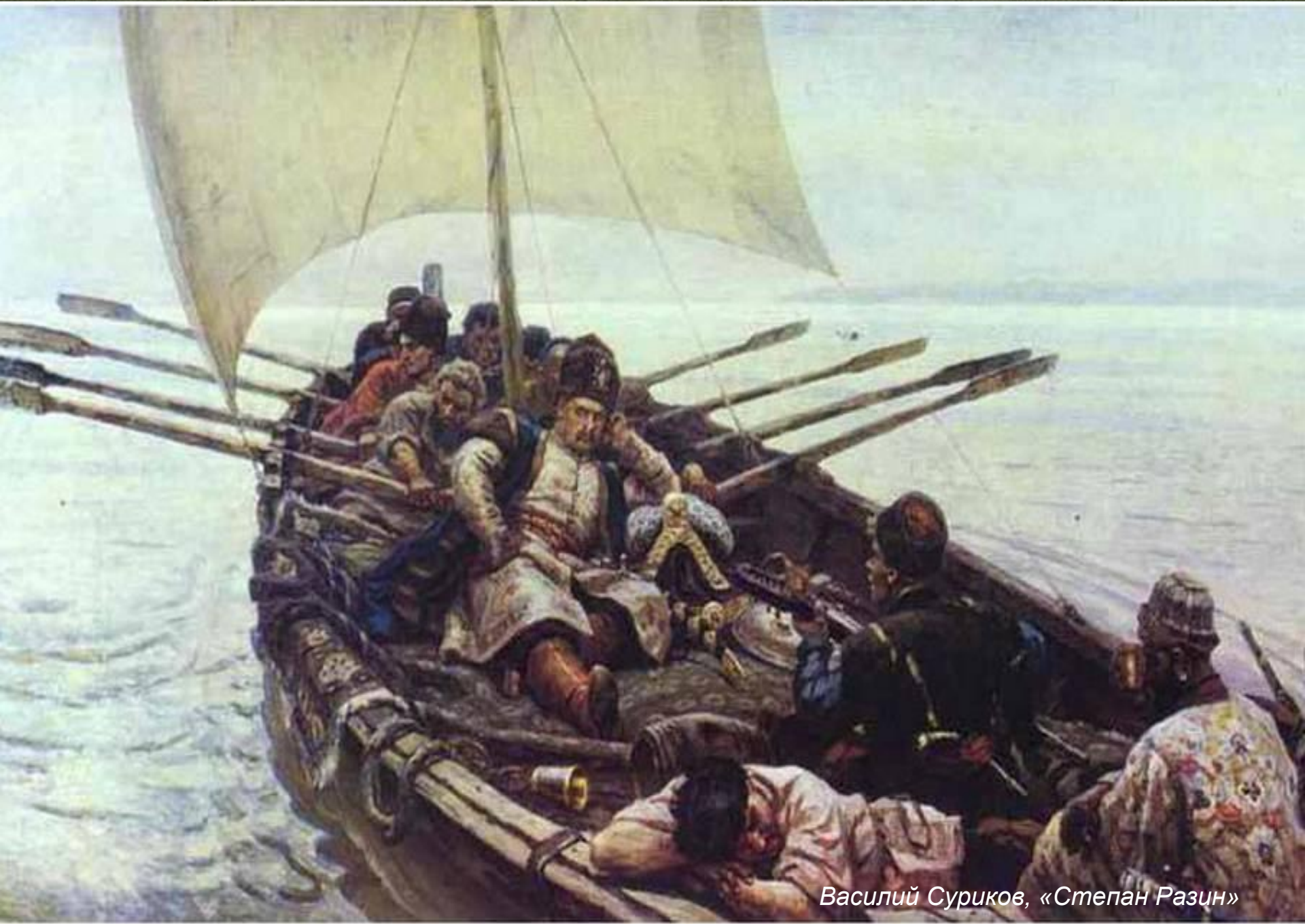
Василий Суриков, «Степан Разин»