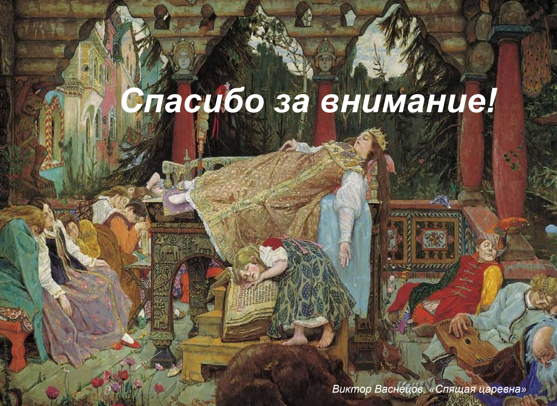
Виктор Васнецов, «Спящая царевна»