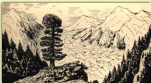
М. Туганов. Горный пейзаж.

Такие рисунки, сделанные карандашом, пером, углем, разнообразные по мотивам и авторскому видению и служат ему творческой кладовой, то есть материалом для создания произведений.