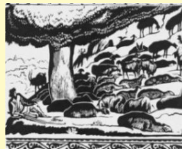
В.А. Фаворский. Отдых стада