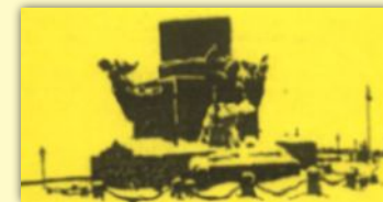
А. П. Остроумова-Лебедева. Ростральная колонна