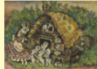
Е. И. Чарушин «Семеро козлят»