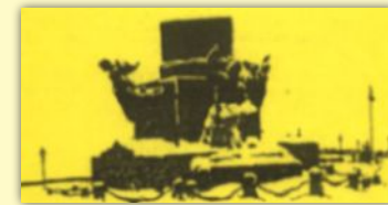
А. П. Остроумова-Лебедева. Ростральная колонна