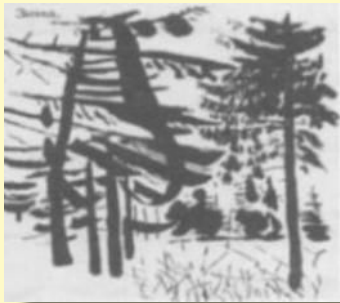
М. Митурич. Зима. Тушь, кисть.

Материалы используемые ХУДОЖНИКАМИ –ГРАФИКАМИ : тушь, акварель, пастель, мел, уголь, сангина, карандаш и т. д.