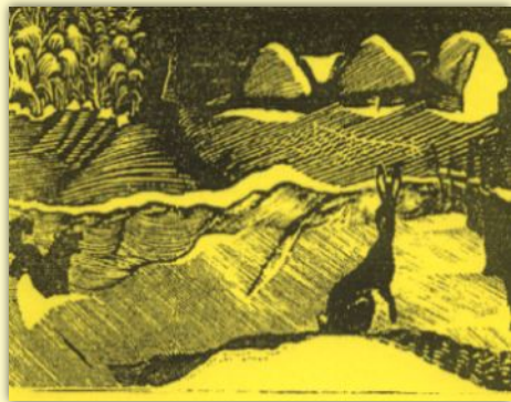
В. Фаворский «Рассказы о животных» Гравюра.