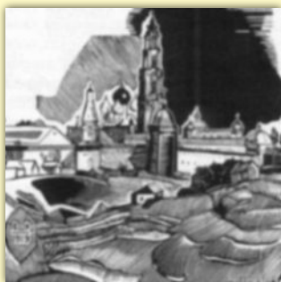
В.А. Фаворский. Иллюстрация. Новостройка в Сергиев- Посаде

Мастера-граверы все большее внимание уделяли разнообразию и выразительности штриха – графической разработанности и орнаментальности изображения.