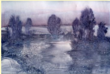
Сыров Валерий. Пейзаж.

Монотипия выполняется так. Покрой влажной и густой краской лист бумаги и нарисуй на нем сверху карандашом линейный рисунок. Затем прогладь его пальцем или боком ладони там, где это имеет смысл, с разной силой нажима. Теперь аккуратно сними листок с отпечатком пейзажа. Эта техника требует умение экспериментировать.