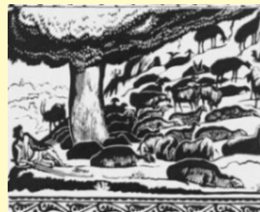
В.А. Фаворский. Отдых стада