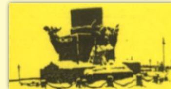
А. П. Остроумова-Лебедева. Ростральная колонна