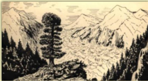
М. Туганов. Горный пейзаж.

Такие рисунки, сделанные карандашом, пером, углем, разнообразные по мотивам и авторскому видению и служат ему творческой кладовой, то есть материалом для создания произведений.