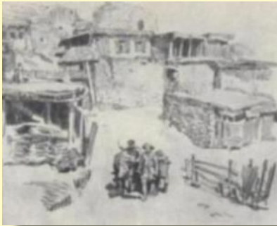
Из серии «В горах».