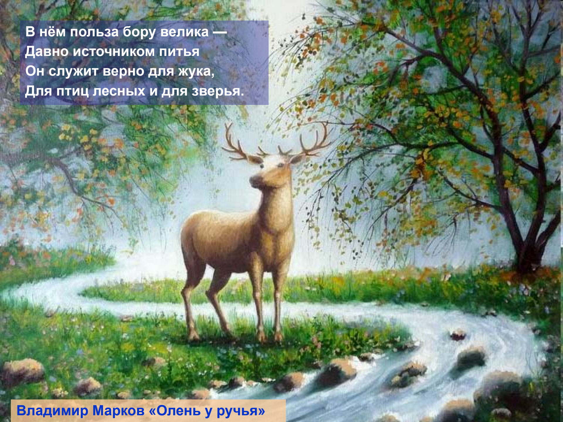
Владимир Марков «Олень у ручья»

В нём польза бору велика — Давно источником питья Он служит верно для жука, Для птиц лесных и для зверья.