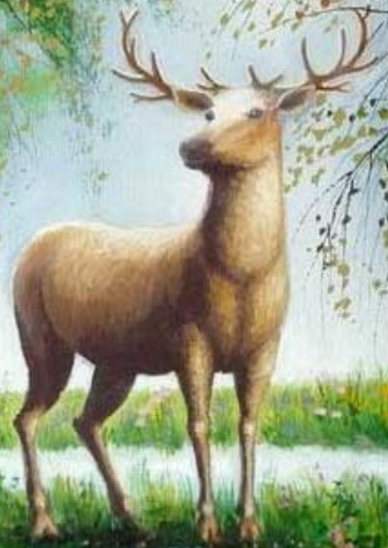
Владимир Марков «Олень у ручья»

В нём польза бору велика — Давно источником питья Он служит верно для жука, Для птиц лесных и для зверья.