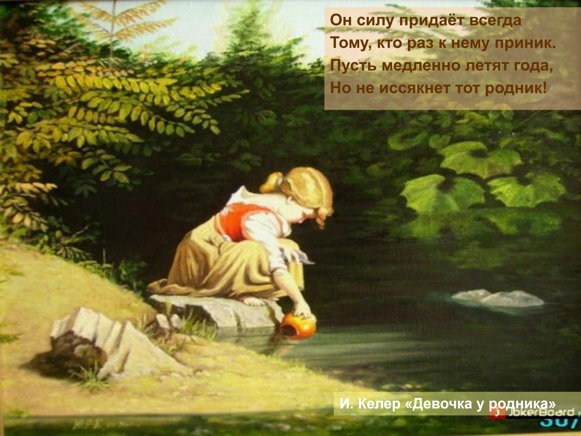
И. Келер «Девочка у родника»

Он силу придаёт всегда Тому, кто раз к нему приник. Пусть медленно летят года, Но не иссякнет тот родник!