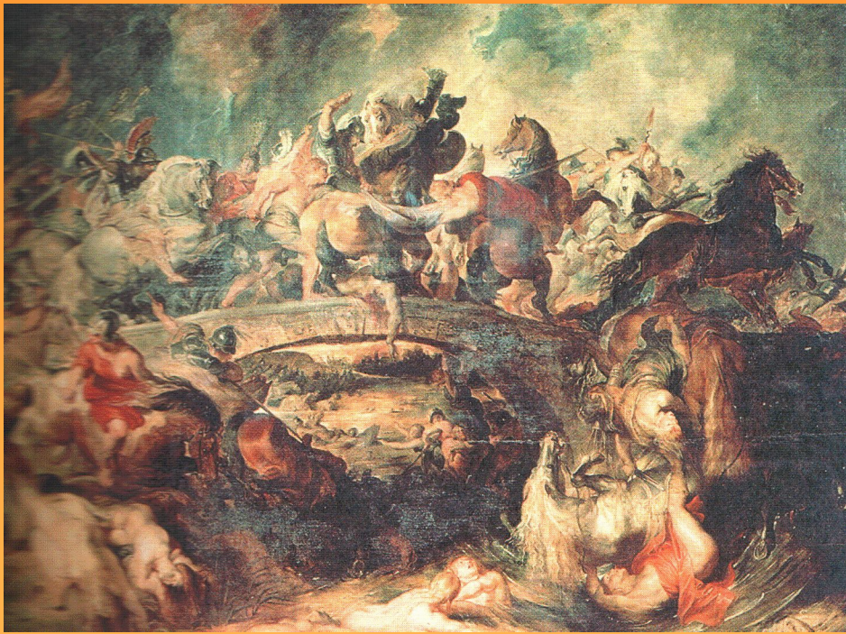
Битва греков с амазонками 1615 – 1619 г.

Картина находится: Старая Пинакотека, Мюнхен