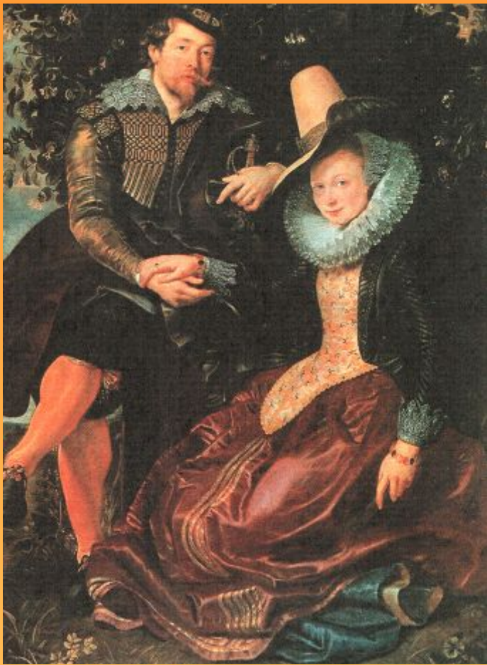
Автопортрет с женой Изабеллой Брандт (Жимолостная беседка) 1609г.