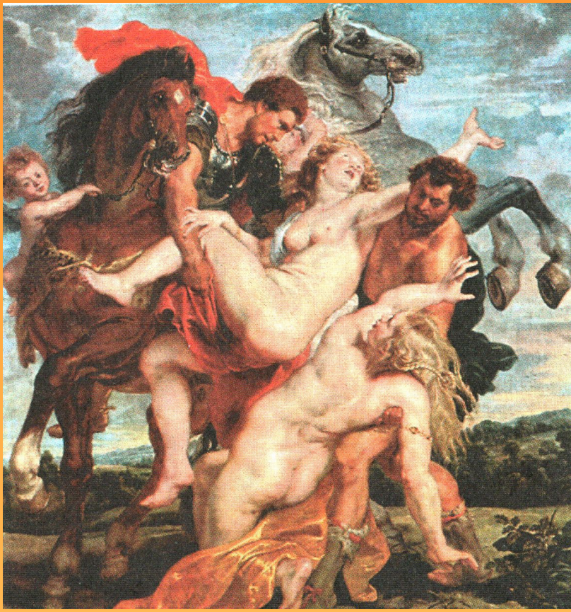
Похищение дочерей Левкиппа 1619-1620 г.

Картина находится: Старая Пинакотека, Мюнхен