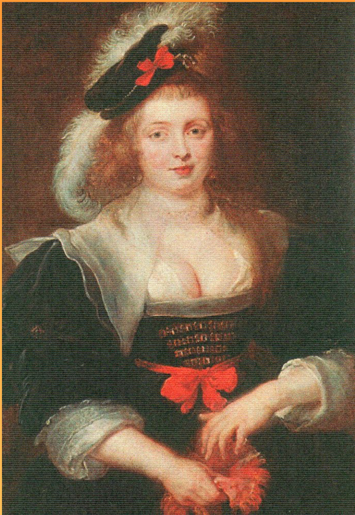
Портрет Елены Фоурмен 1633 г.

Картина находится: Старая Пинакотека, Мюнхен