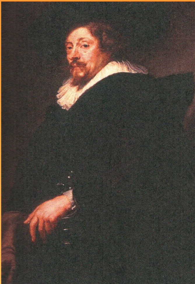
Автопортрет 1639 г.

Картина находится: Художественно – исторический музей, Вены