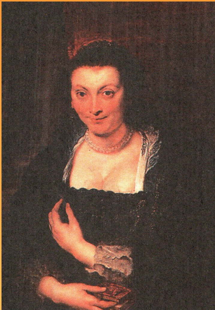
Портрет Изабеллы Брандт 1625 г.

Картина находится: Галерея Уффици, Флоренция