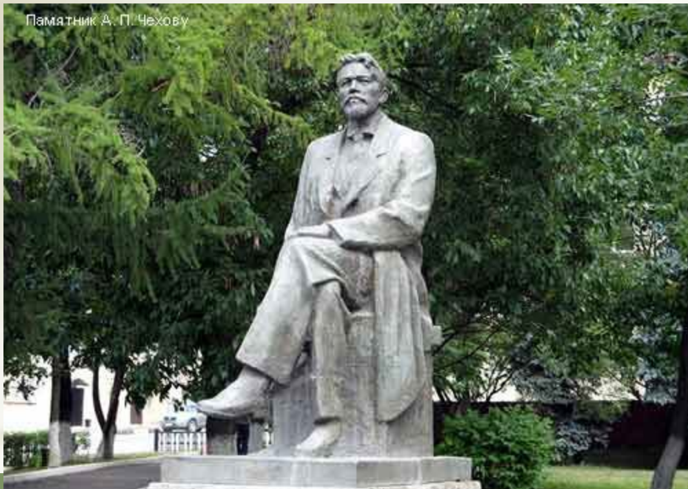
Памятник А. П. Чехову