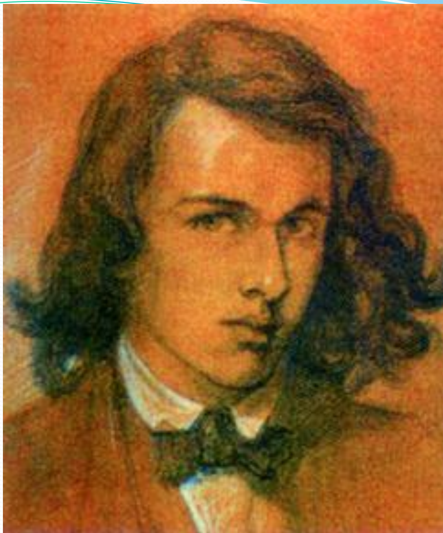
Данте Габриэль Россетти. Автопортрет. 1847