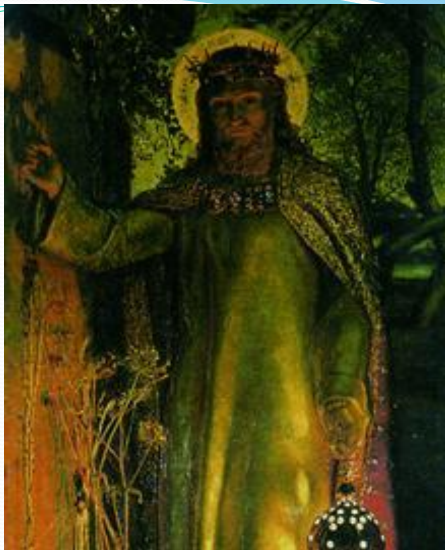
У. Х. Хант. Светоч мира (фрагмент). 1853