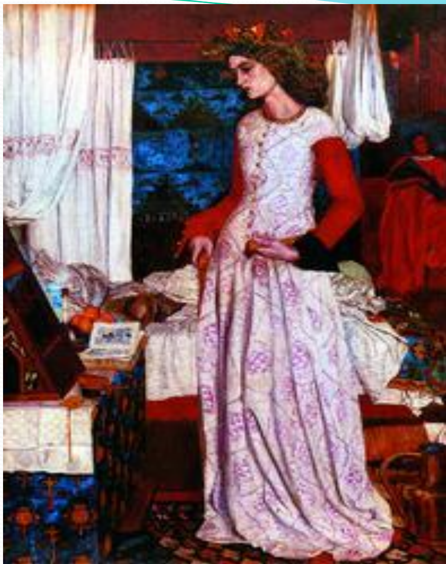
У. Моррис. Королева Гвинивера. 1857