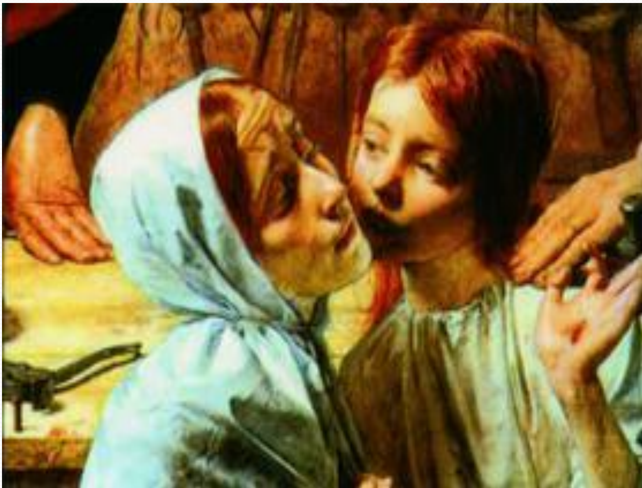
Д. Э. Миллес. Христос в доме своих родителей (фрагмент). 1850