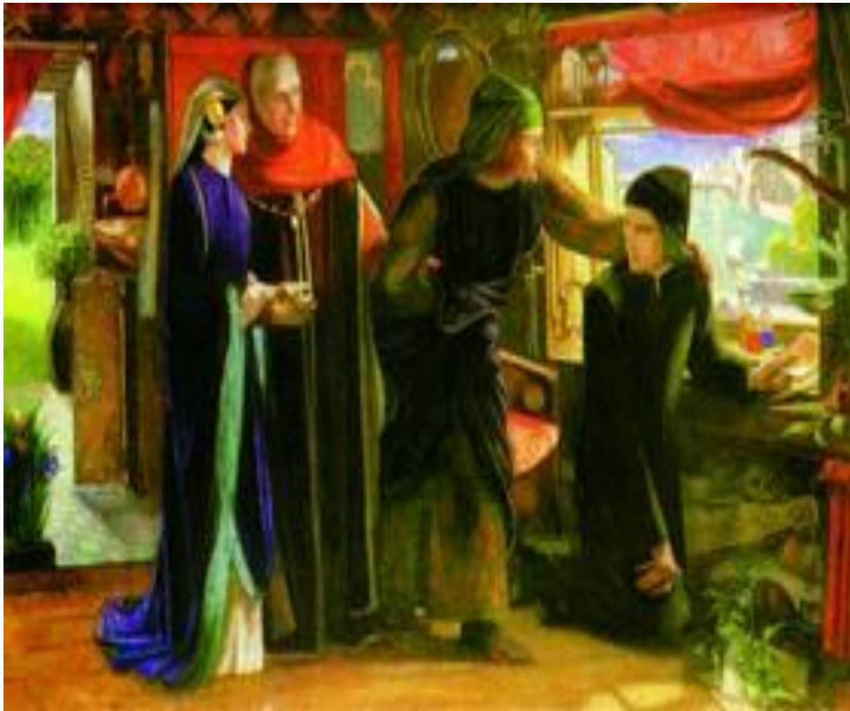
Д. Г. Россетти. Первая годовщина смерти Беатриче. 1854