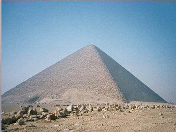
Розовая пирамида, Снофру (IV династия) : 219 м (105 м)