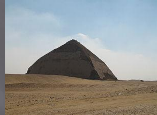
Пирамида в Мейдуме, Снофру (IV династия) : 144 м (94 м)