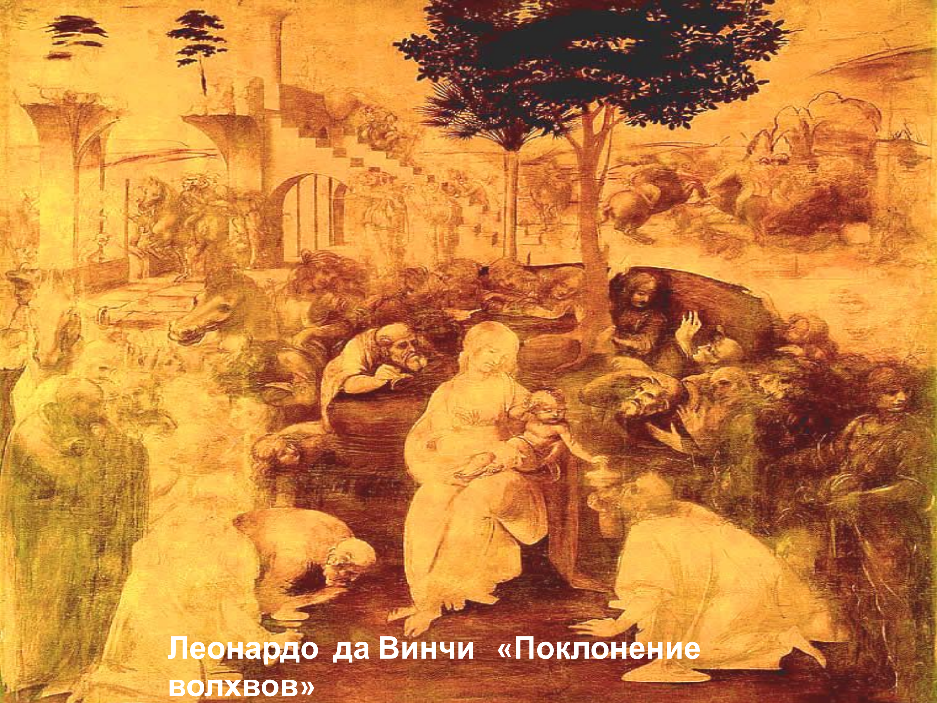
Леонардо да Винчи «Поклонение волхвов»