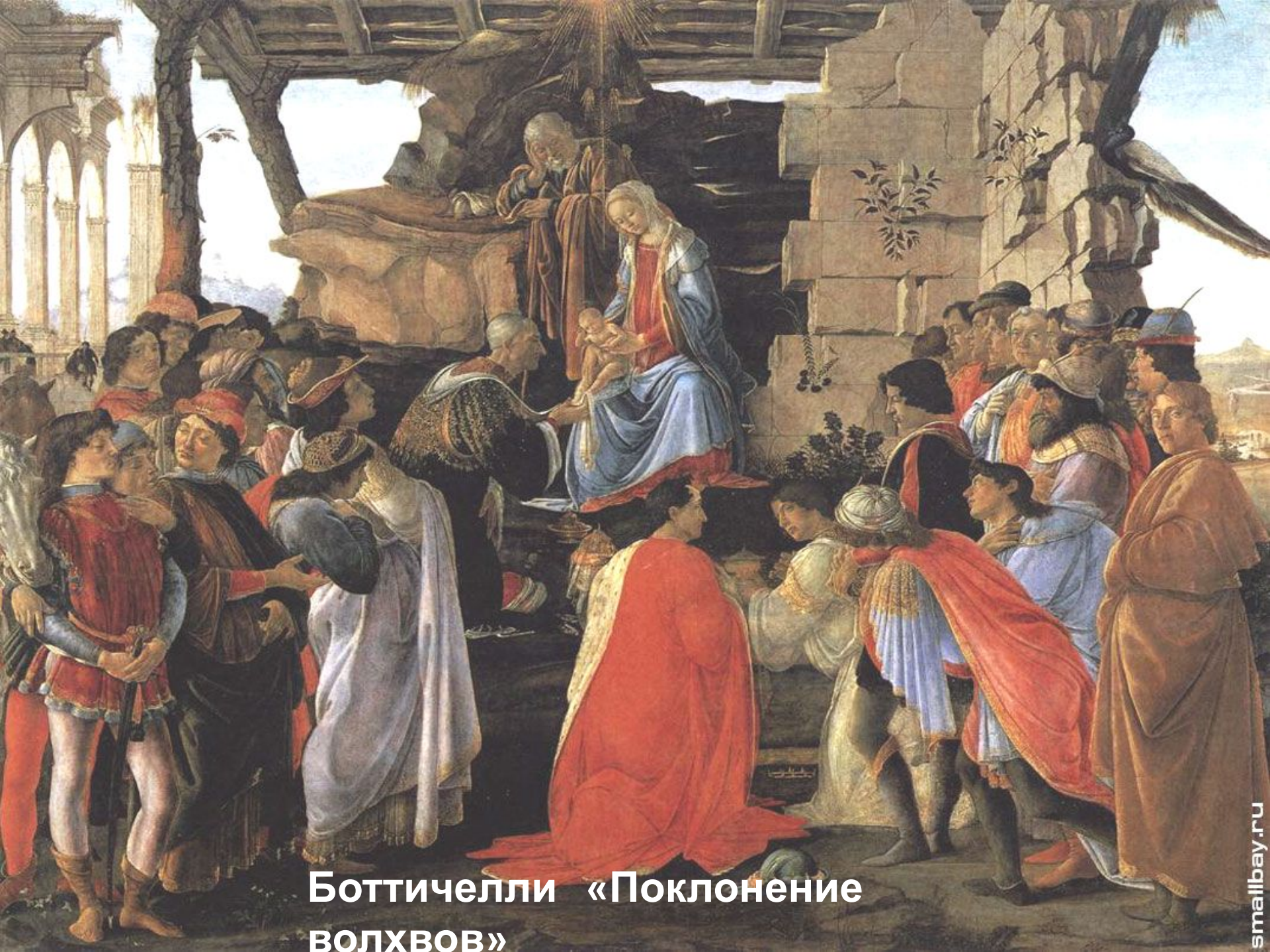
Боттичелли «Поклонение ВОЛХВОВ»