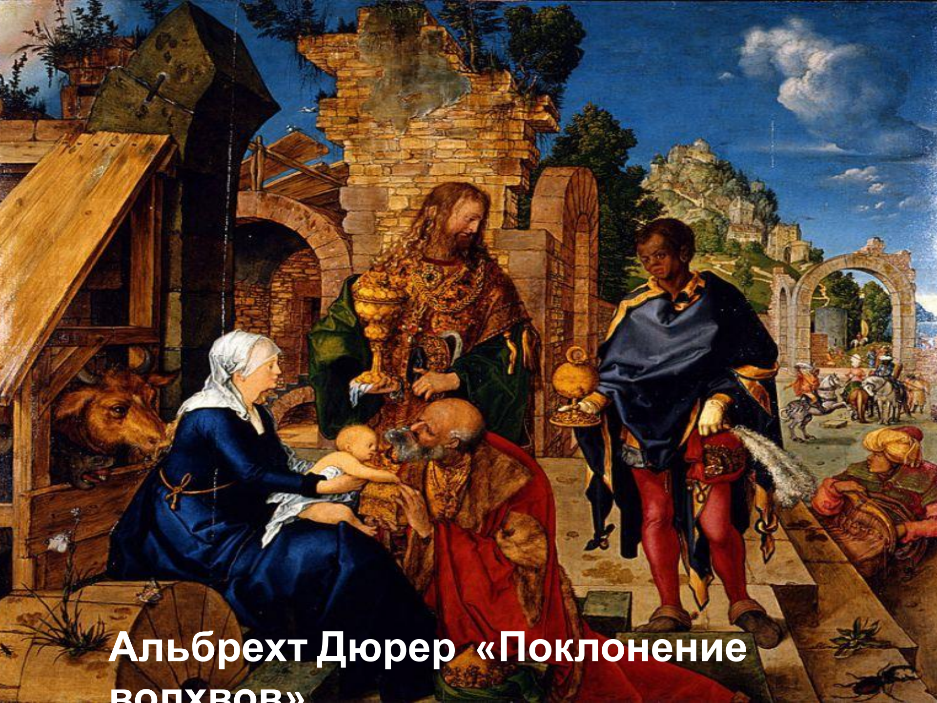
Альбрехт Дюрер «Поклонение вопущов»