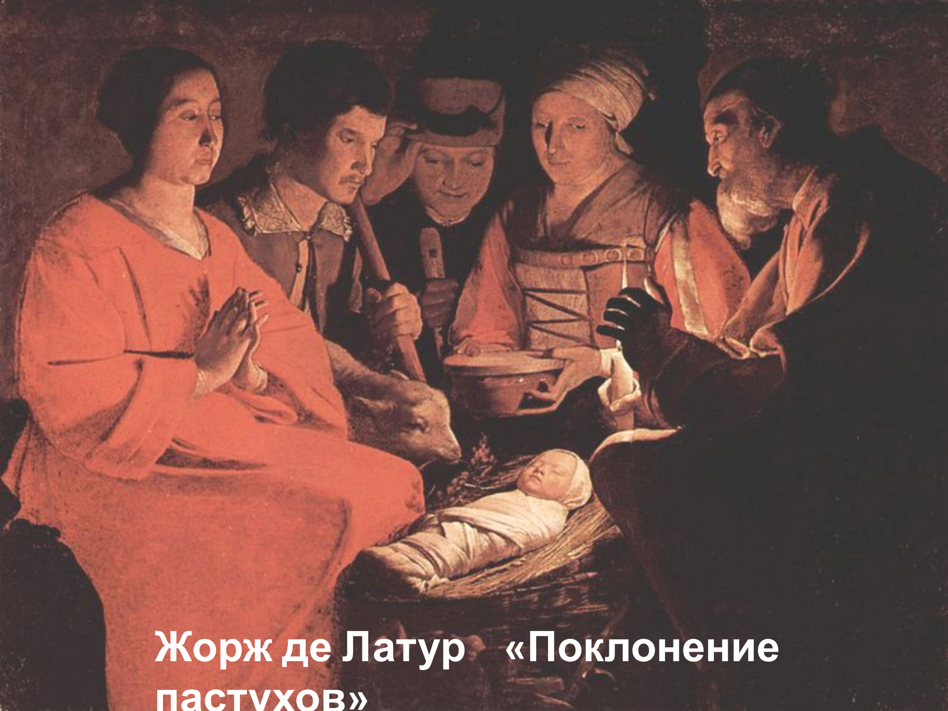
Жорж де Латур «Поклонение пастухов»