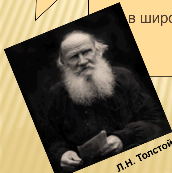
Л.Н. Толстой (1828-1910)

в широком смысле совокупность любых письменных текстов.