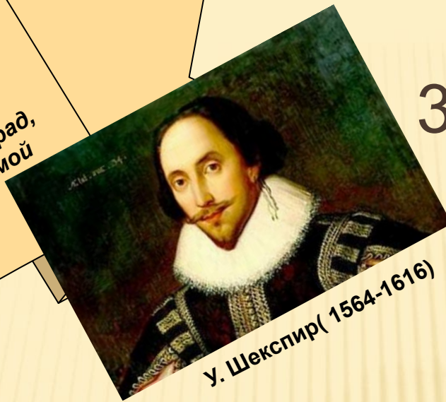
У. Шекспир (1564-1616)

В своем несчастье одному я рад, Что ты - мой грех и ты - мой вечный ад. (У. Шекспир)