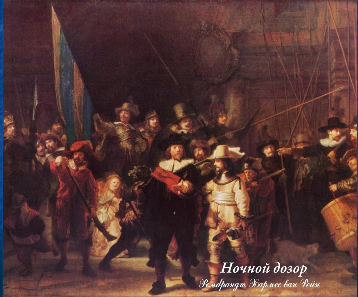
Ночной дозор Рембрандт Хармес ван Рейн

■ Групповой портрет-портрет, включающий не менее трех персонажей