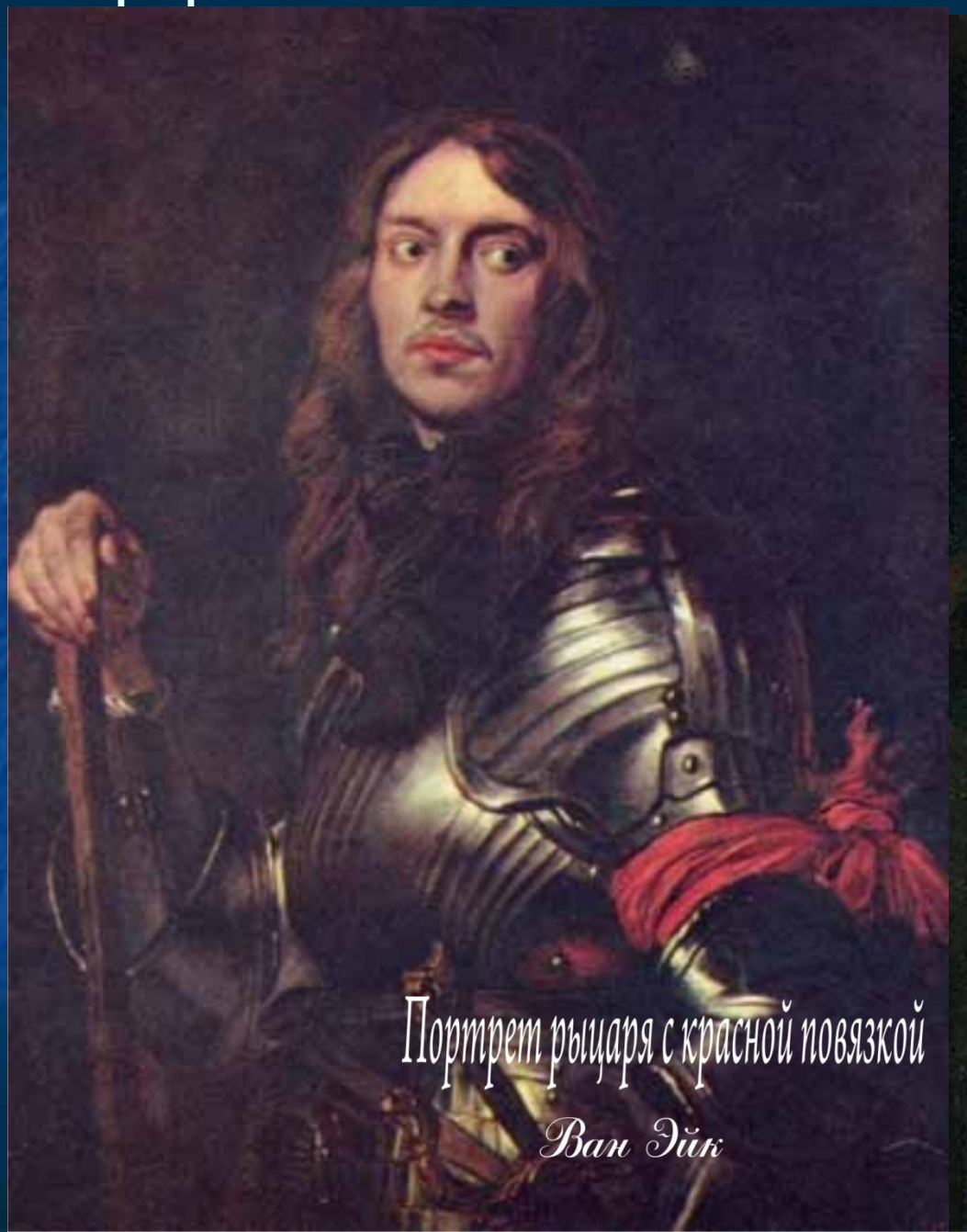
Портрет рыцаря с красной повязкой