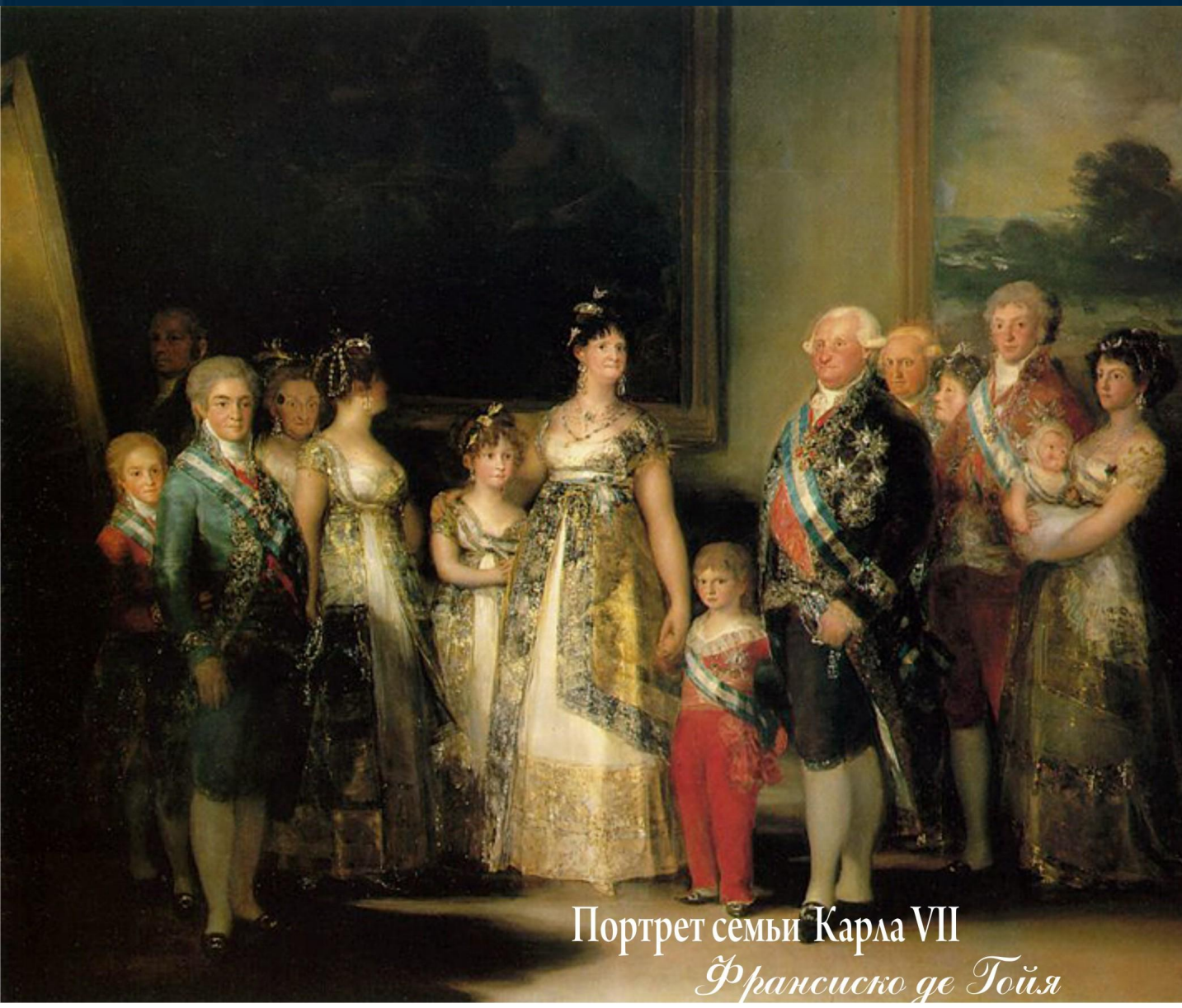
Портрет семьи Карла VII Франсиско де Гойя