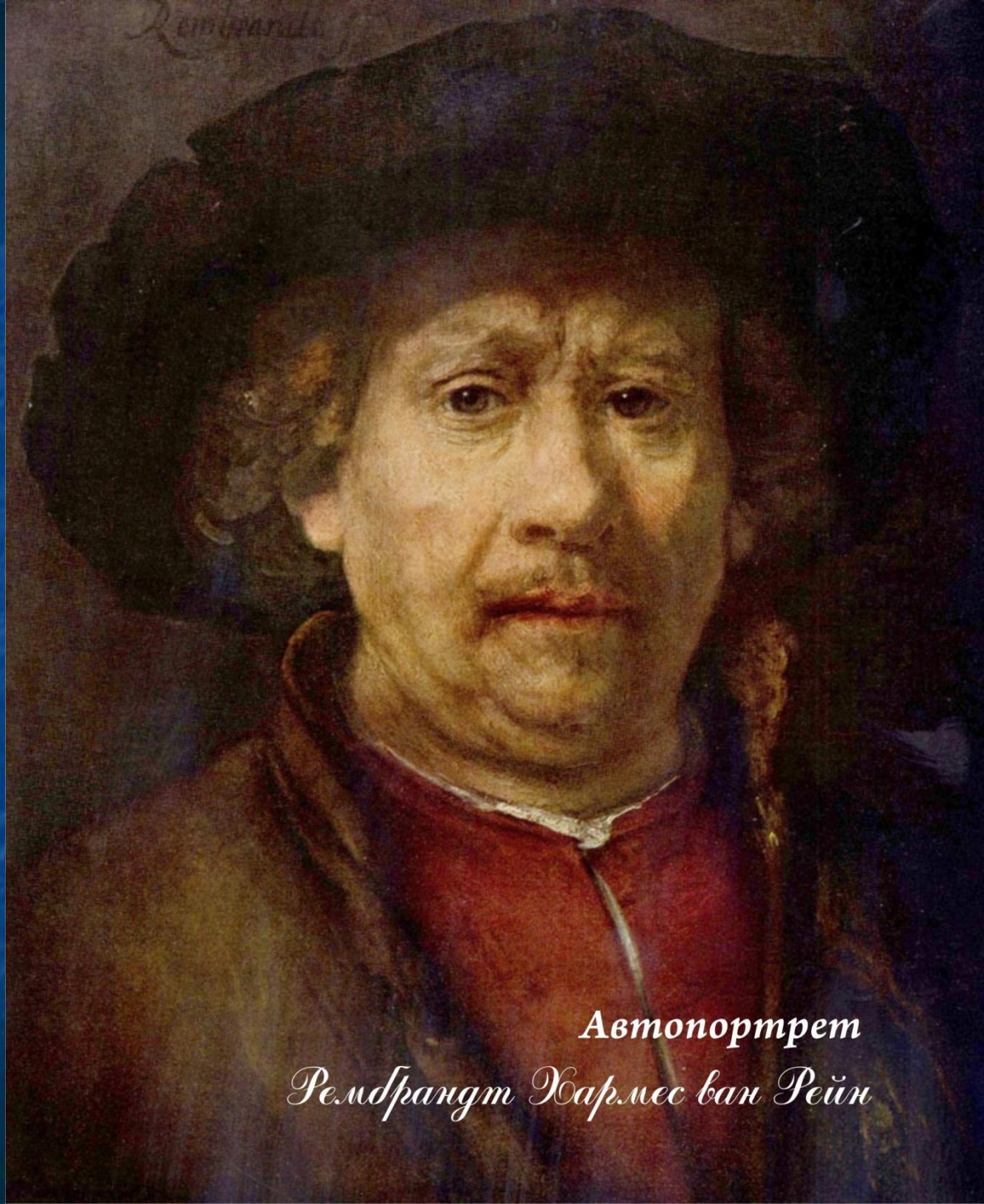
Автопортрет Рембрандт Хармес ван Рейн