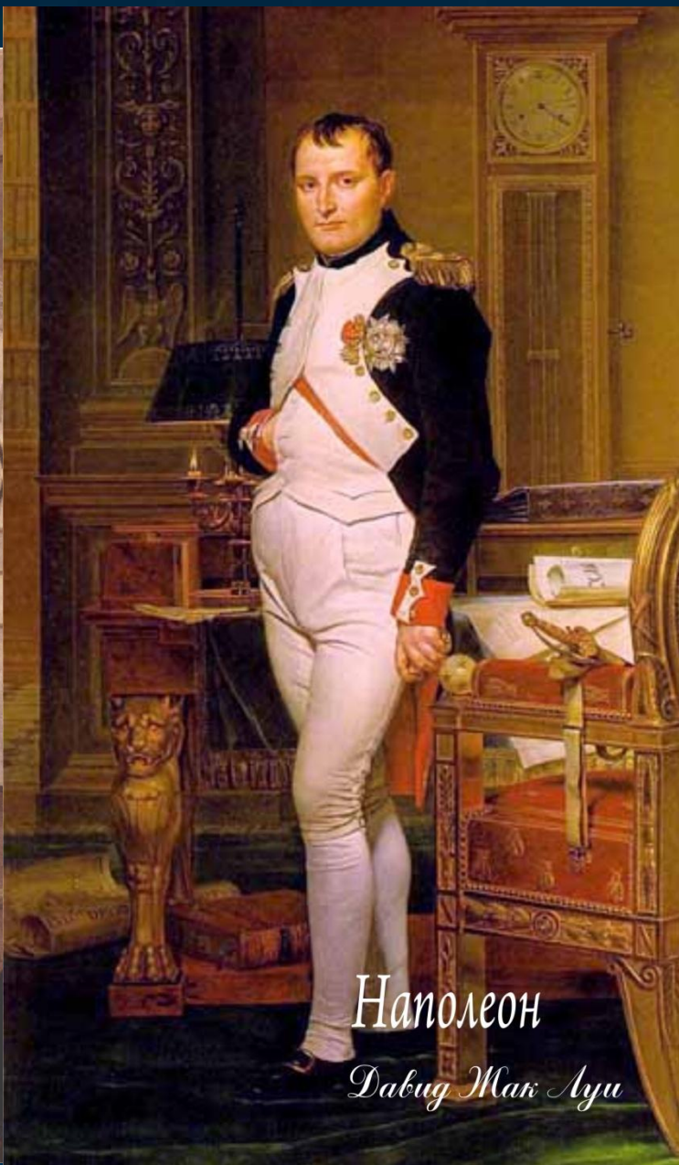
Наполеон Давид Жак Луи