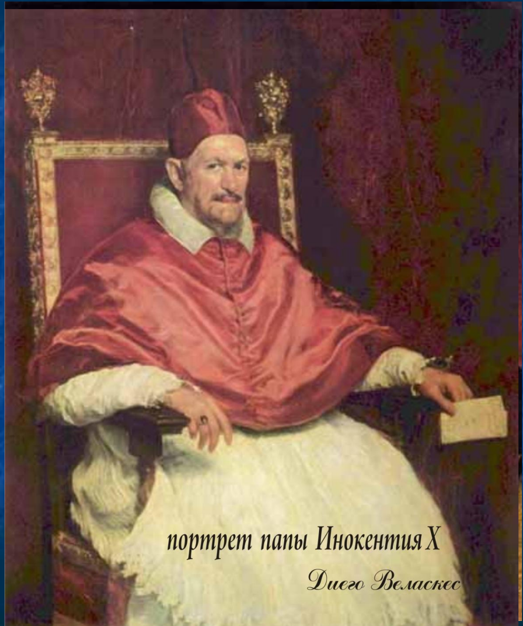
портрет папы Иннокентия X