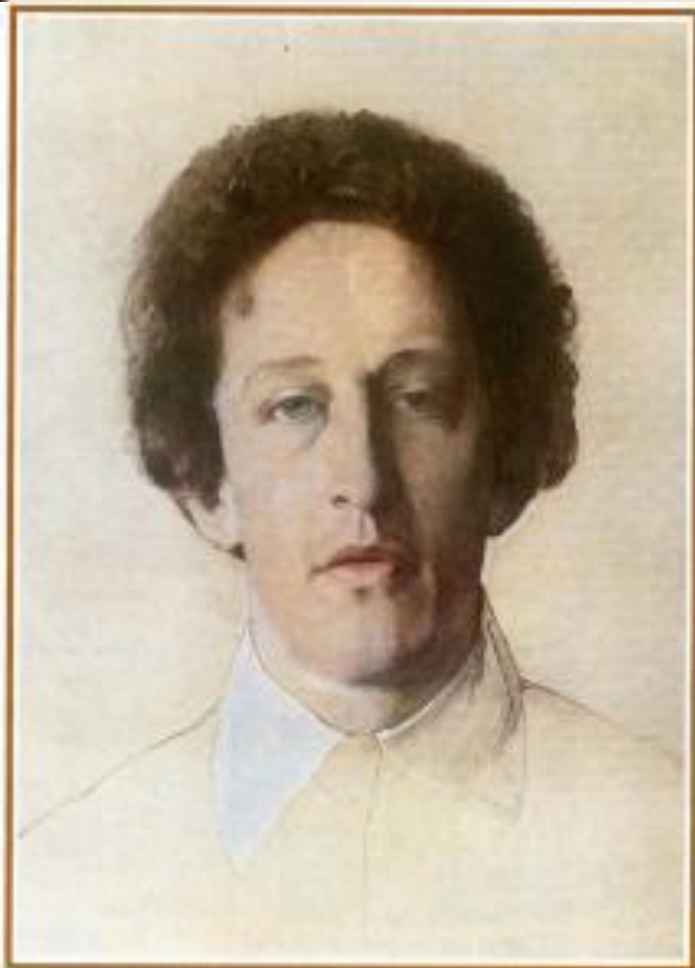
К. Сомов А. Блок 1907 г