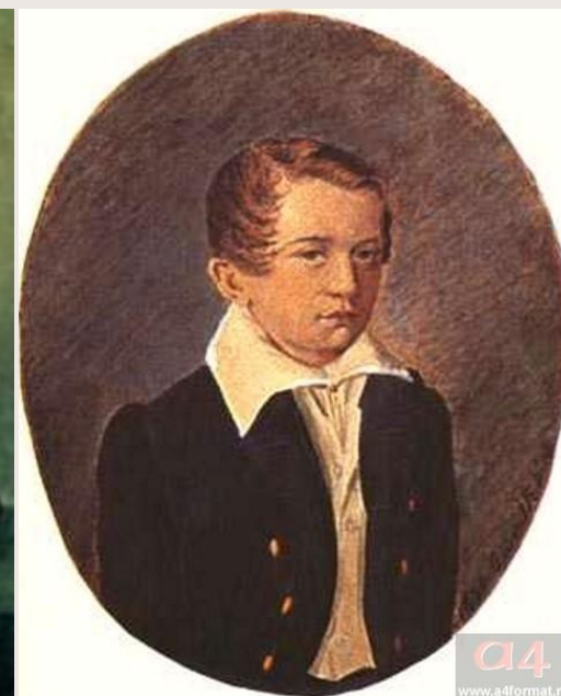
И. Тургенев Неизвестный художник