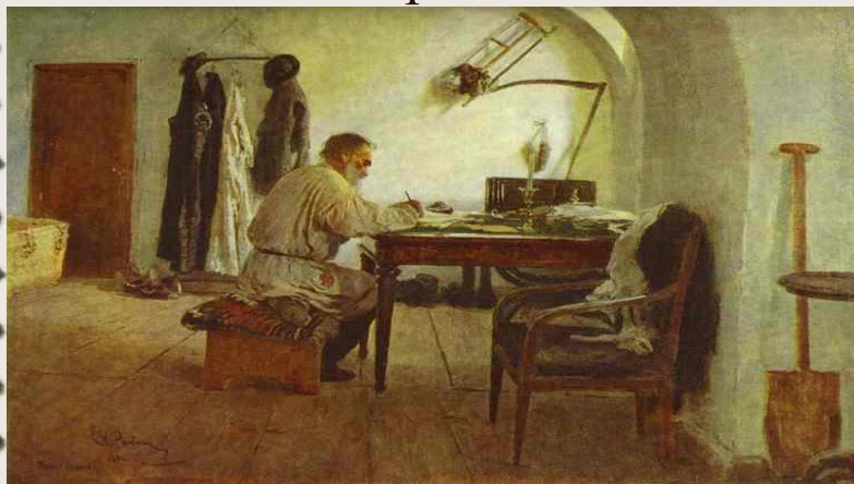
Толстой за работой