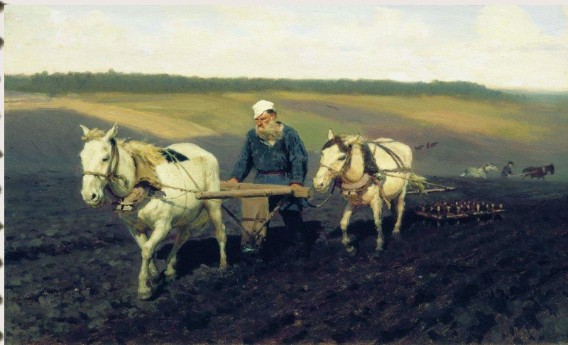
Толстой на пашне