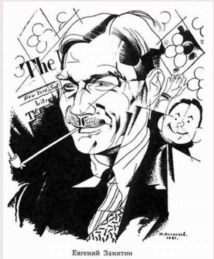
Б.М. Кустодиев Портрет Е. Замятина