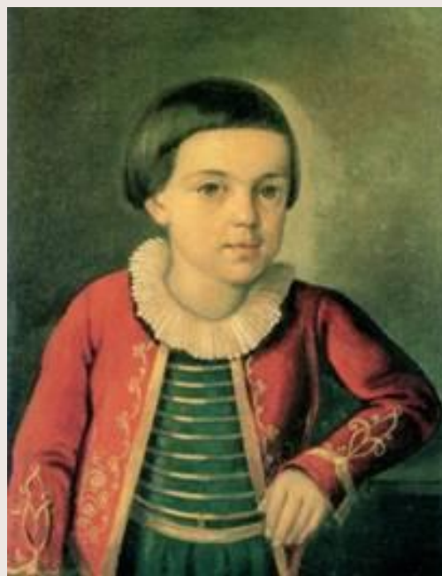
Лермонтов в детстве Неизвестный художник