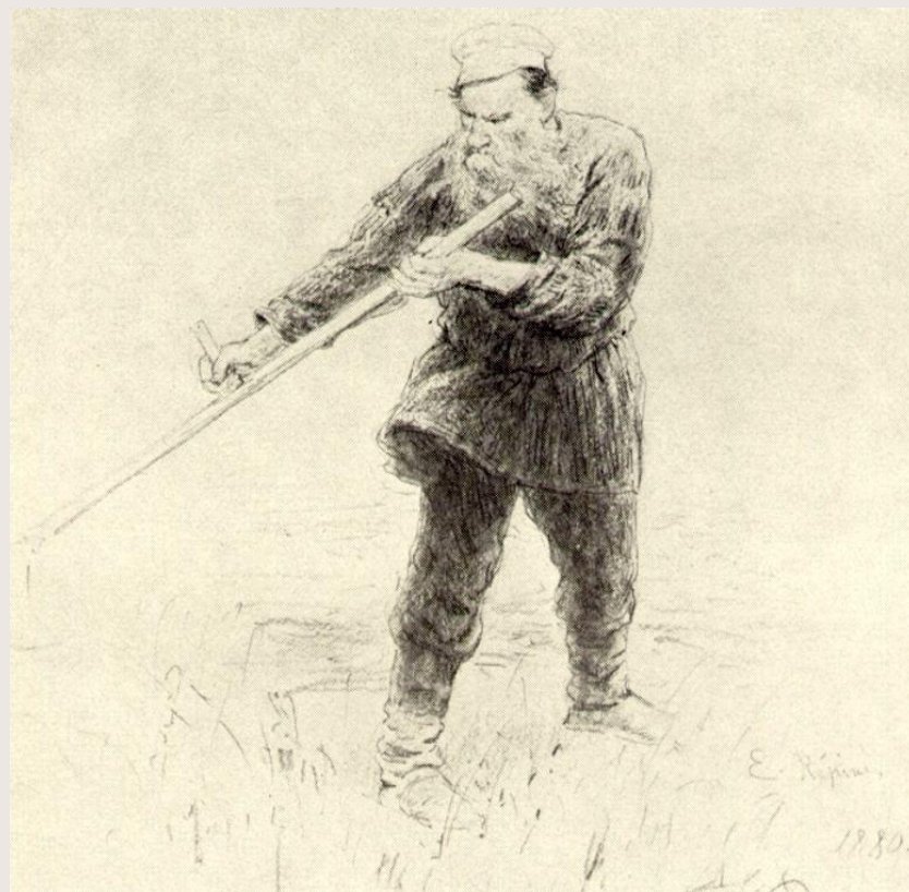
Толстой на покосе