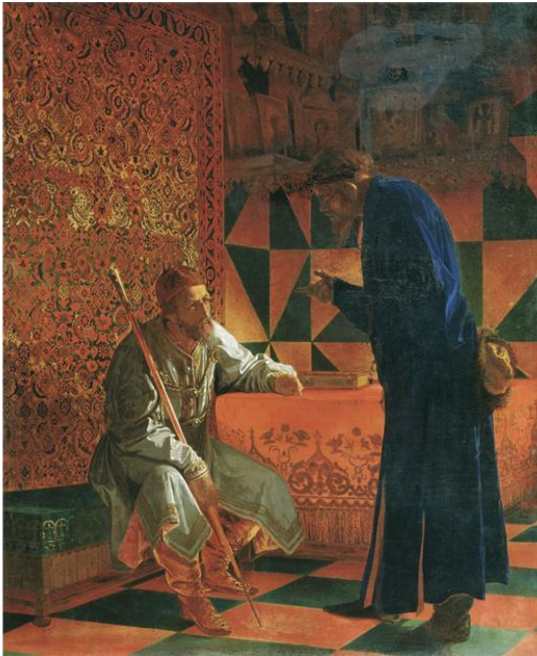
Иван Грозный и Малюта Скуратов