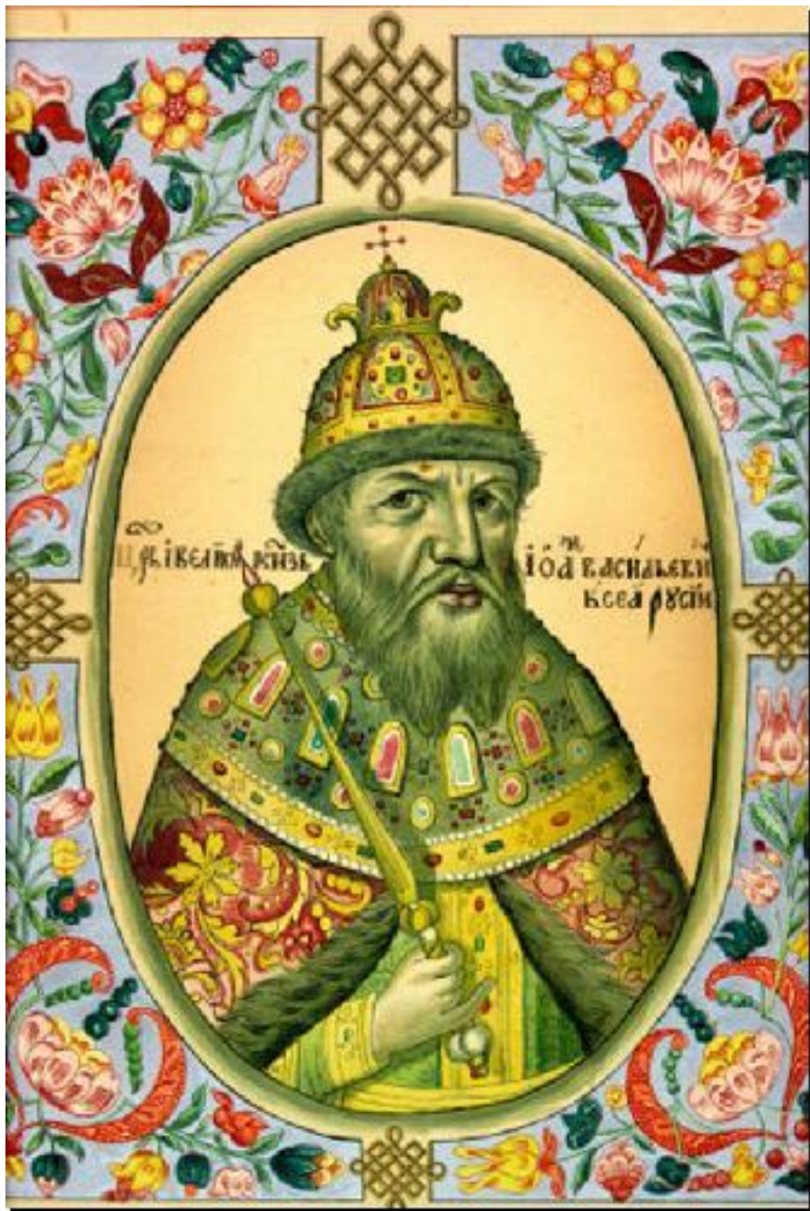
Миниатюра из царского «Титулярника», 1672 год.