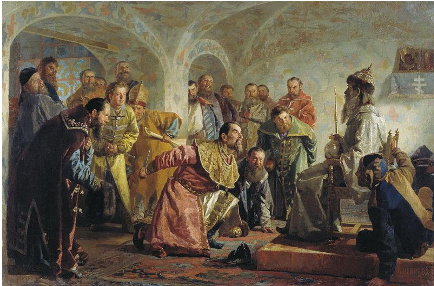
Н.В. Неврев «Опричники»