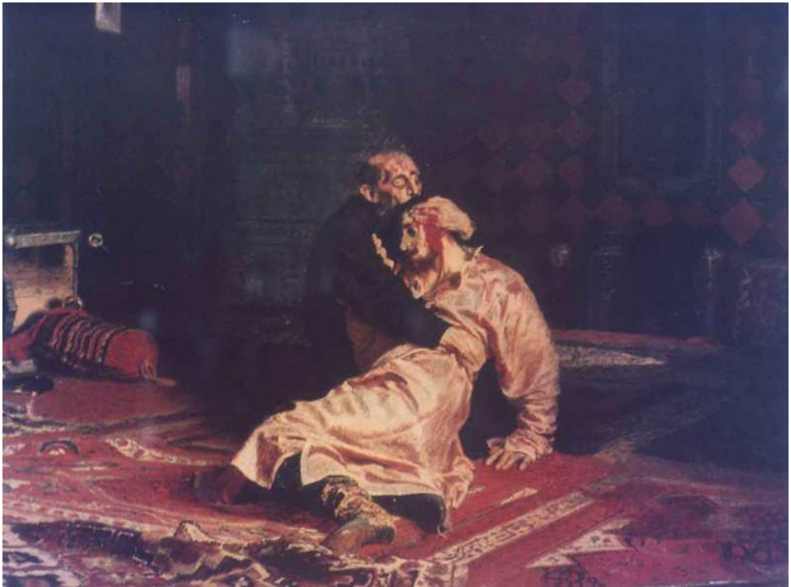
И.Е. Репин «Иван Грозный и сын его Иван»