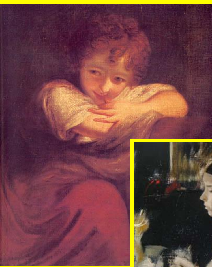
Д.Рейнольдс • Плутовка

Вызвать у детей интерес к новому жанру живописи – портрету, желание его внимательно рассматривать, эмоционально откликаться на настроение художественного образа, испытывать удовольствие и радость от встречи с ним. Развивать воображение и образное мышление.