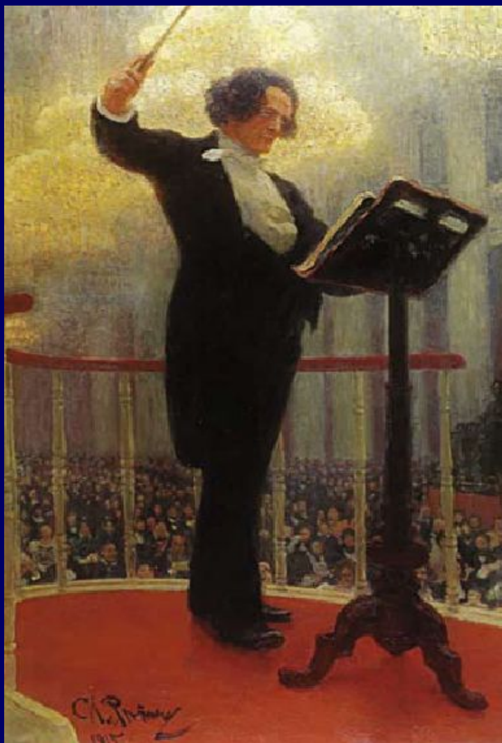
И.Репин. Портрет Антона Рубинштейна