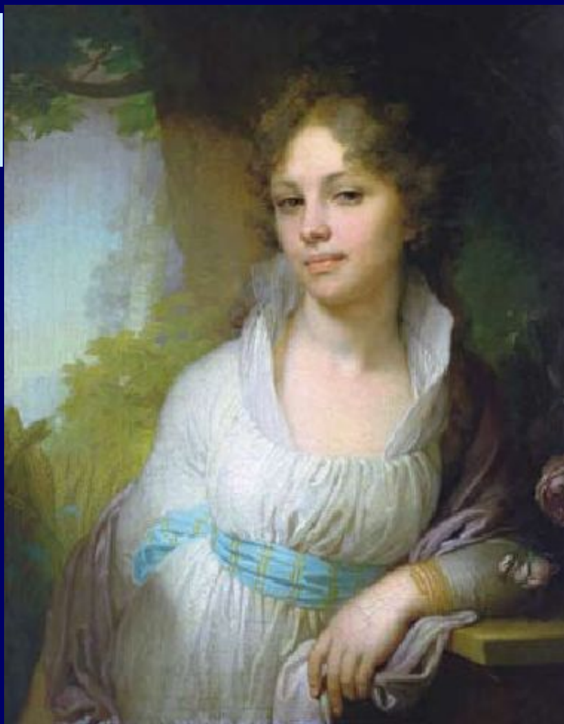
В.Боровиковский. Портрет Марии Лопухиной