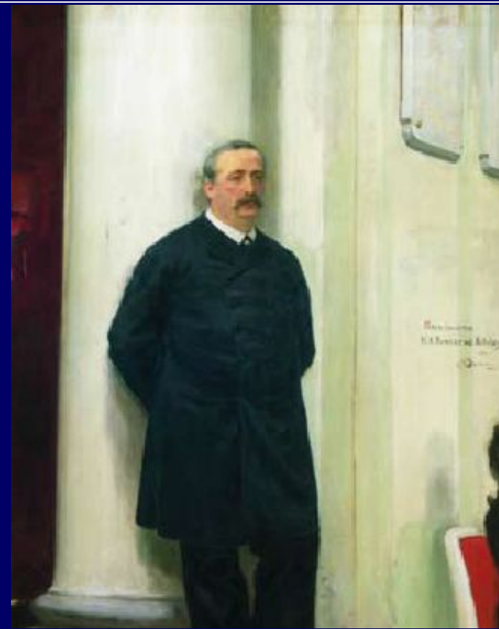
И.Репин. Портрет А.Бородина