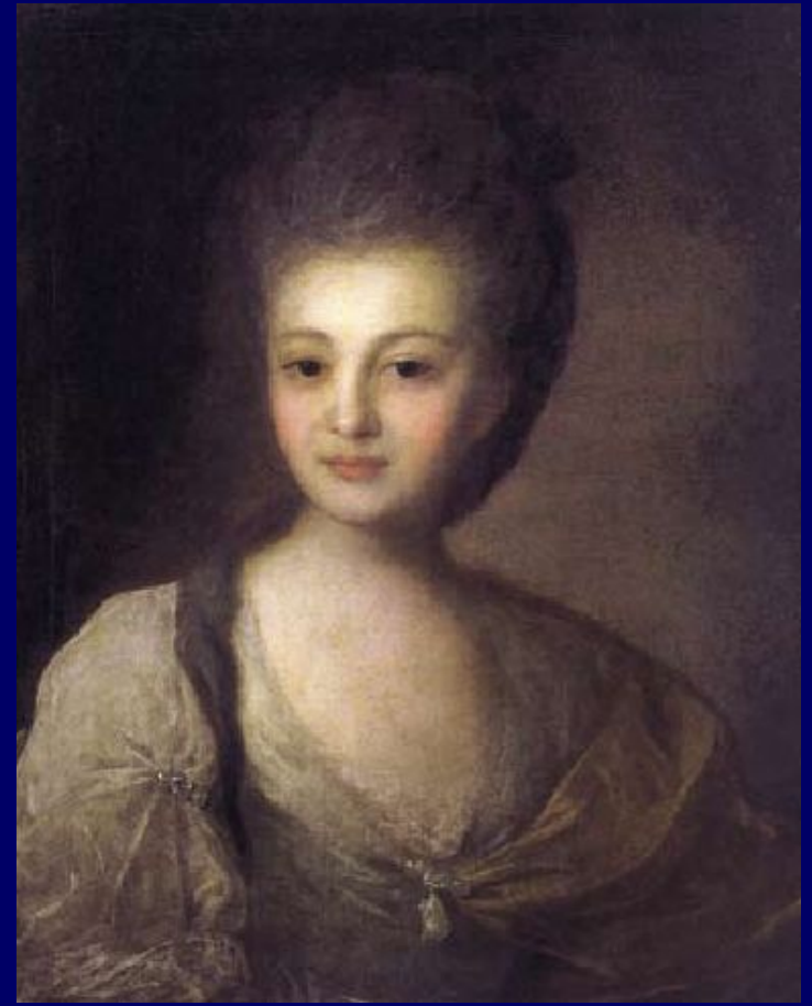
Портрет А.Струйской (1772)