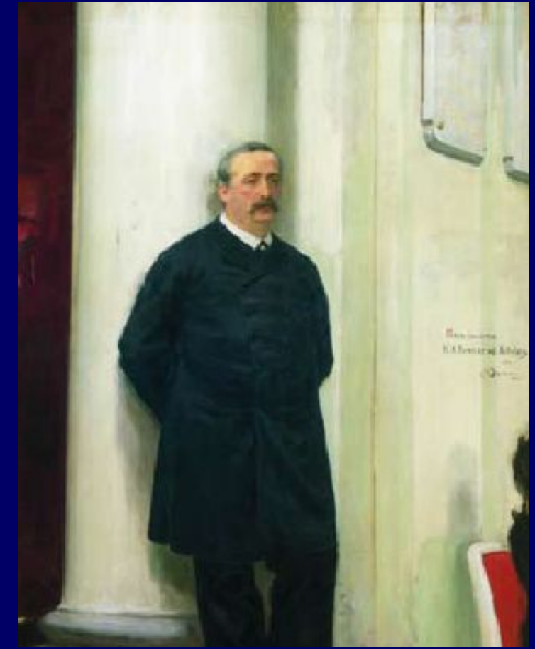
И.Репин. Портрет А.Бородина