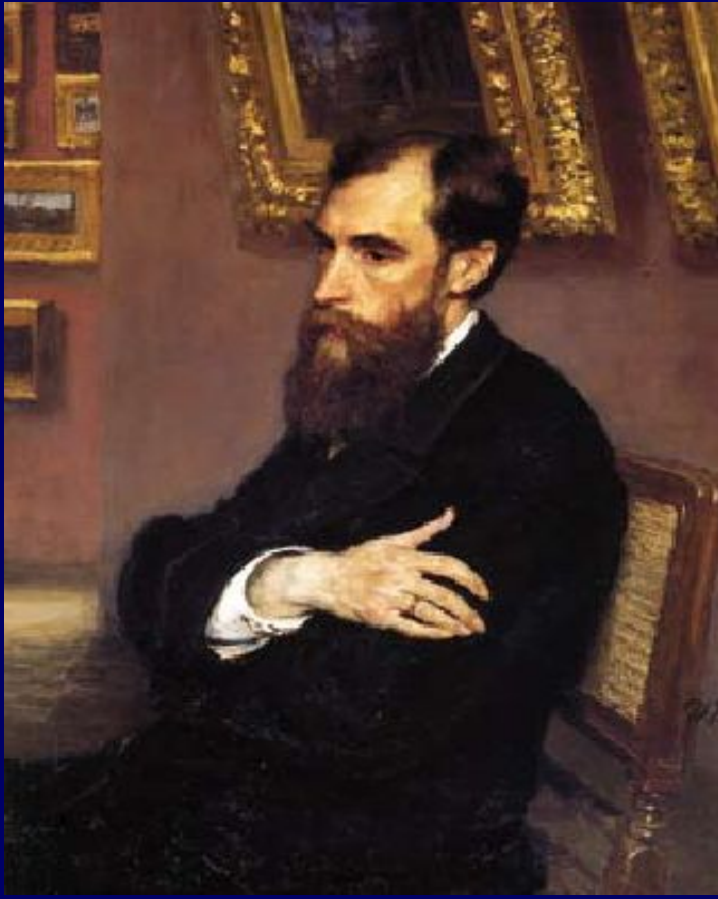
И.Репин. Портрет П.М. Третьякова

Павел Михайлович Третьяков (1832—1898) — российский предприниматель, меценат , собиратель произведений русского изобразительного искусства, основатель Третьяковской галереи .