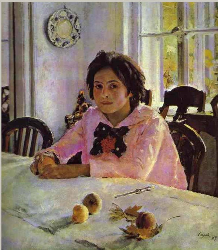
Девочка с персиками