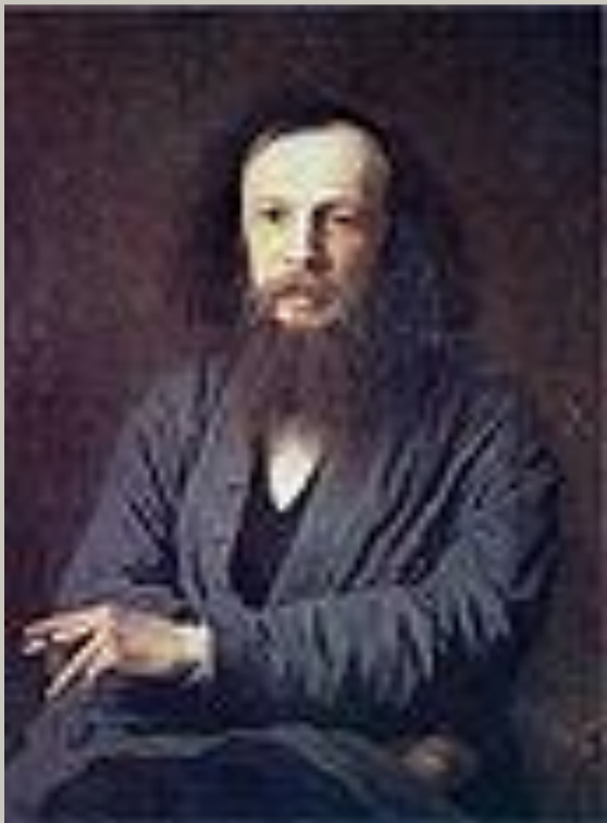
Портрет Д.И. Менделеева