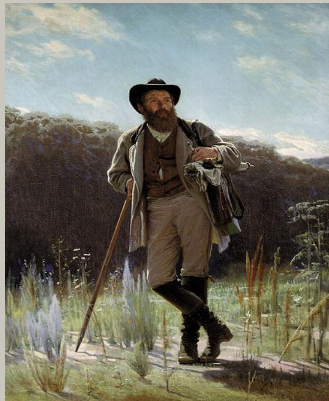
Портрет художника И. Шишкина