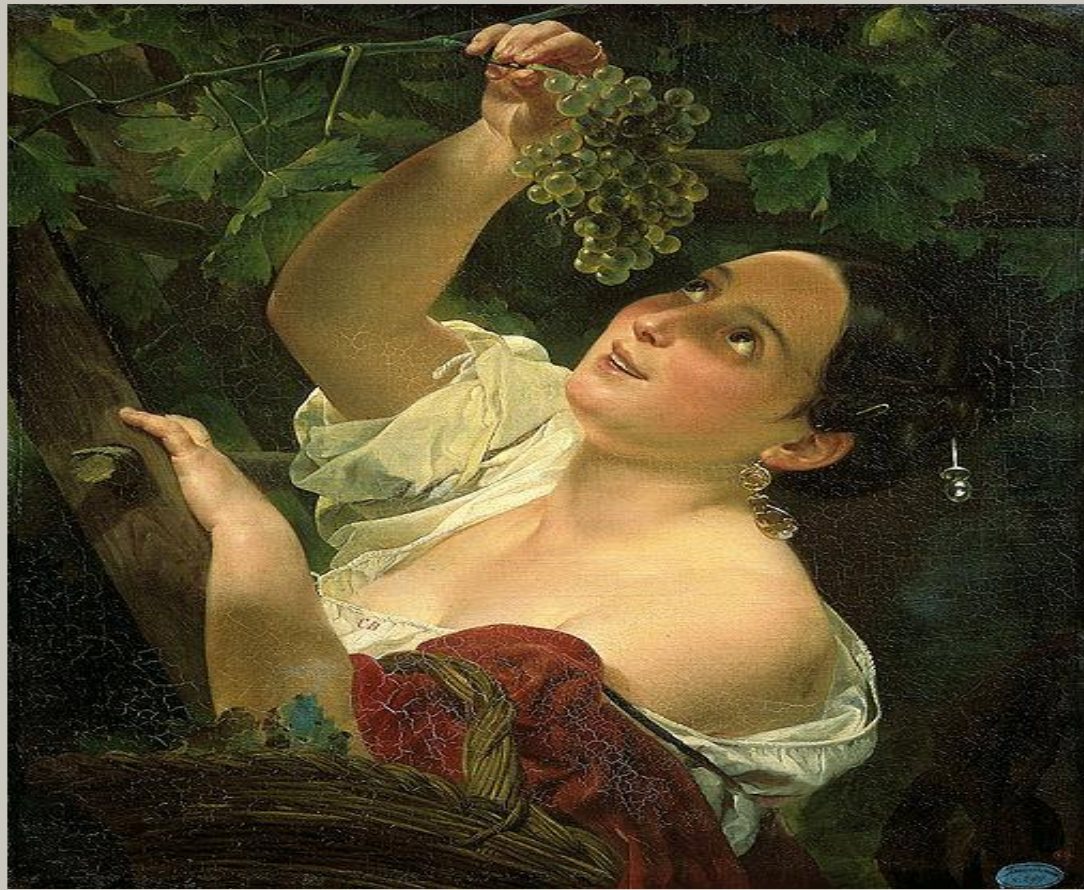
К.Брюллов «Итальянский полдень»