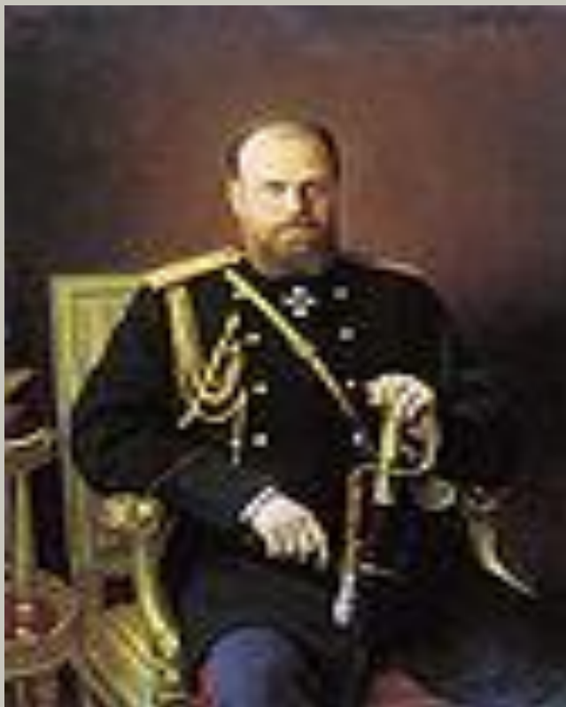
Портрет Александра III