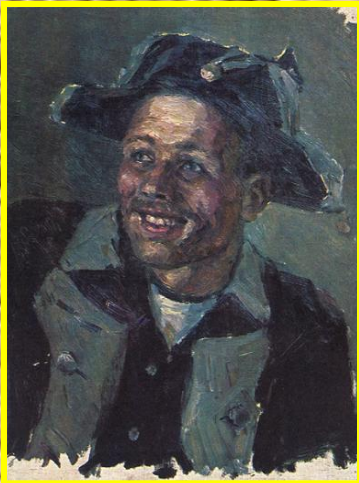
В.Суриков Смеющийся солдат