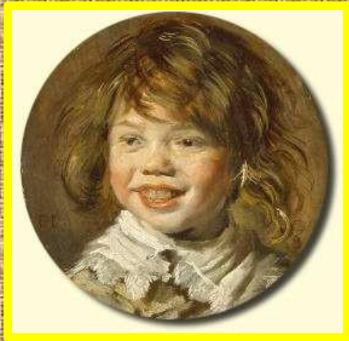
Ф.Хальс Смеющийся мальчик