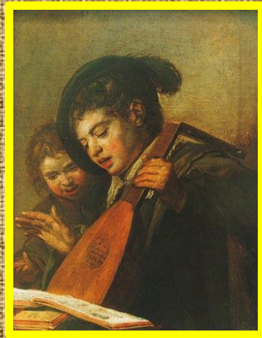
Ф.Хальс Поющие мальчики