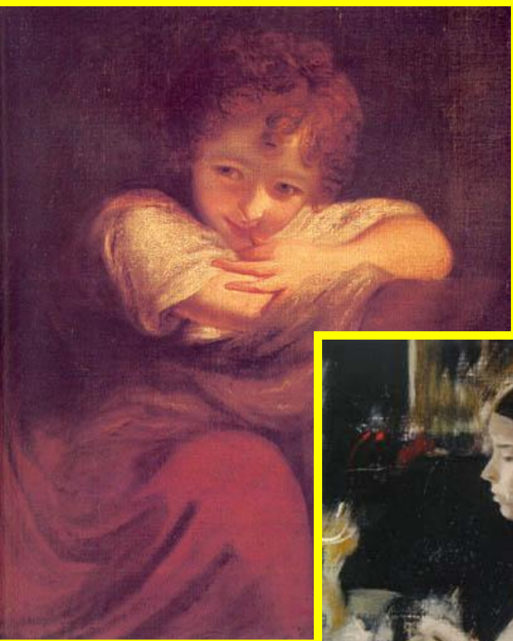
Д.Рейнольдс • Плутовка

Вызвать у детей интерес к новому жанру живописи – портрету, желание его внимательно рассматривать, эмоционально откликаться на настроение художественного образа, испытывать удовольствие и радость от встречи с ним. Развивать воображение и образное мышление.