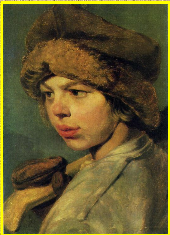
А. Венецианов Захарка