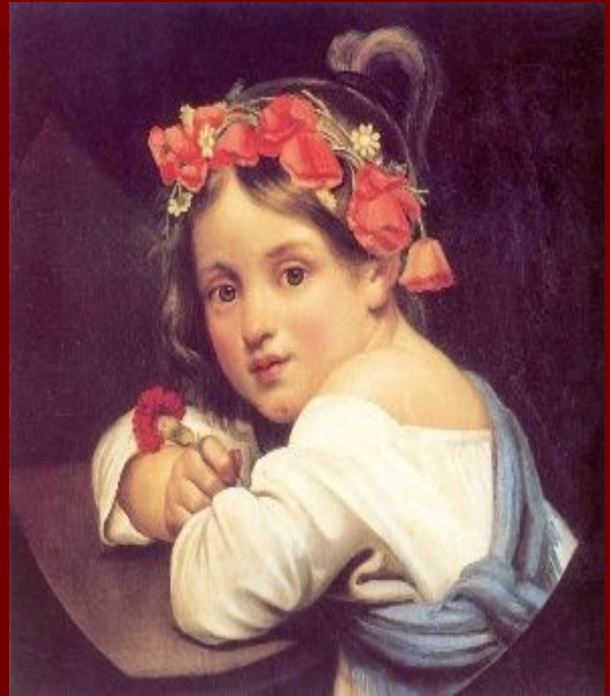
Портрет работы Крамского.