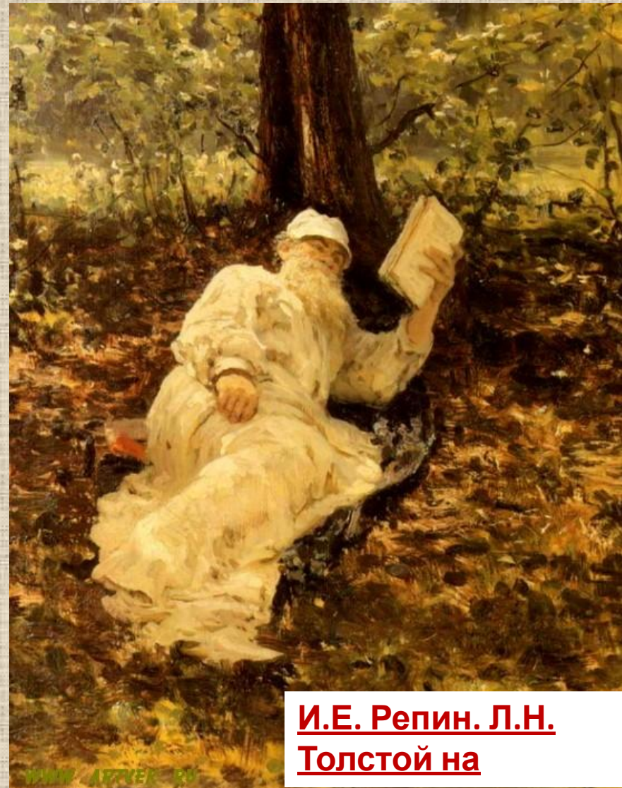
И.Е. Репин. Л.Н. Толстой на отдыхе

Образ великого русского писателя Льва Николаевича Толстого с глубоким проникновением и правдивостью запечатлён на полотне И. Репина.