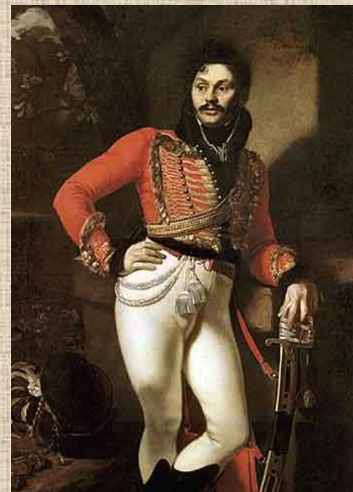
О.А. Кипренский. Портрет Д.В.