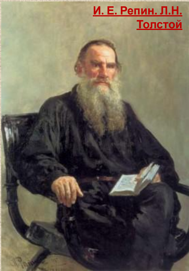
И. Е. Репин. Л.Н. Толстой