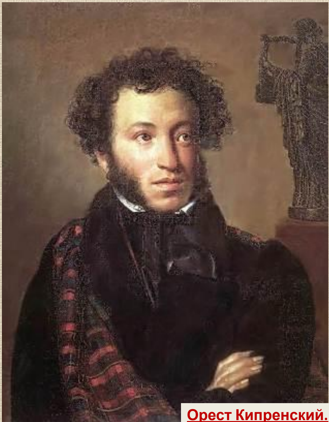
Орест Кипренский. Портрет А.С. Пушкина

Пушкинский портрет исполнен О. Кипренским с большим вдохновением и с полным сознанием огромной исторической ответственности. Первое впечатление от портрета - впечатление предельной завершенности. Тщательная отделка деталей, строгая гармония целого создают ощущение торжественной тишины. На светлом желто-зеленом фоне рисуется изображение поэта, одетого в строгий сюртук с перекинутым через плечо клетчатым красно-зеленым шотландским пледом (некоторые исследователи называют его плащом). Изящная фигура написана в фас, лицо поэта обращено слегка направо, в ту сторону, где в глубине, за креслом, стоит бронзовая статуэтка Гения с кифарой в руках. В лице поэта О. Кипренский мягко передает его характерные "арапские" черты, густые