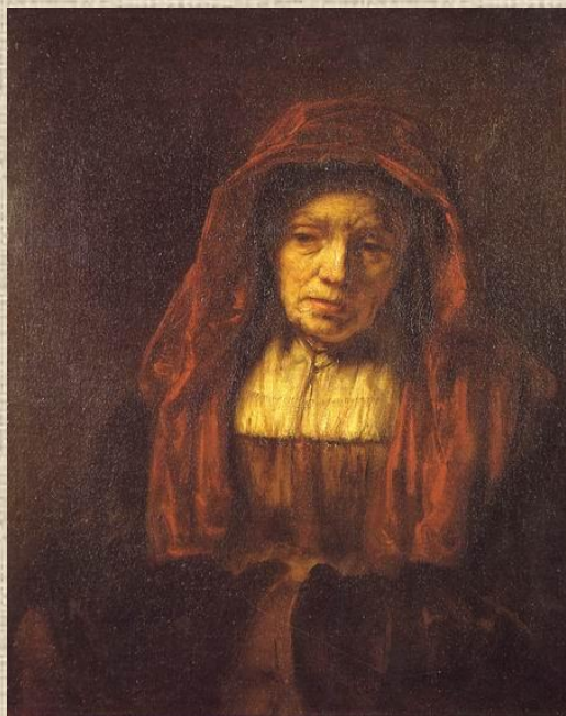
Рембрандт. Портрет старушки.

В портрете художник не только передаёт внешнее сходство, но и старается раскрыть характер человека, рассказать о его жизни, занятиях.