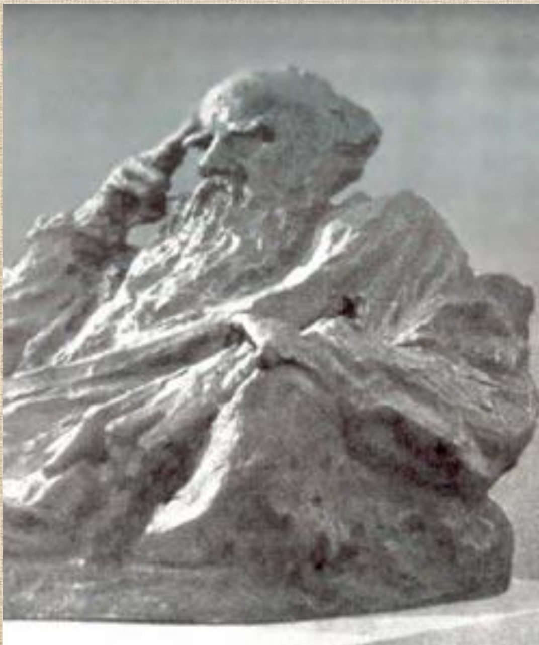
А. Голубкина. Л.Н. Толстой. Скульптура.