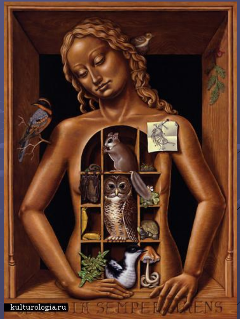
картина Мэделин фон Фосторс