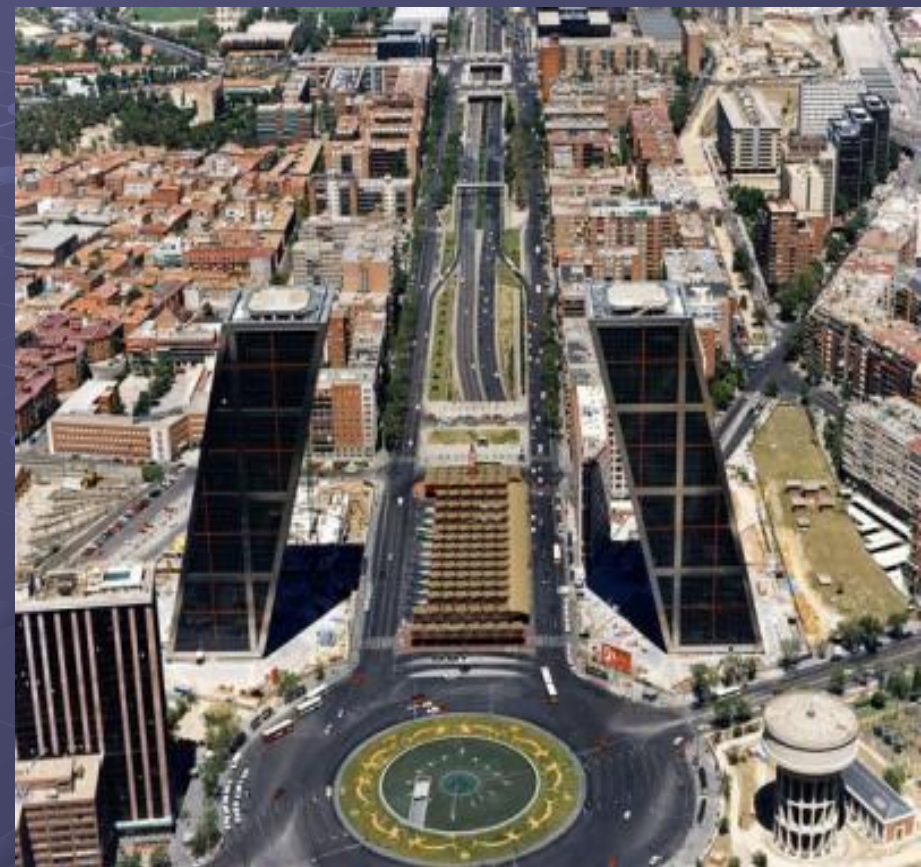
Ворота Европы, Мадрид