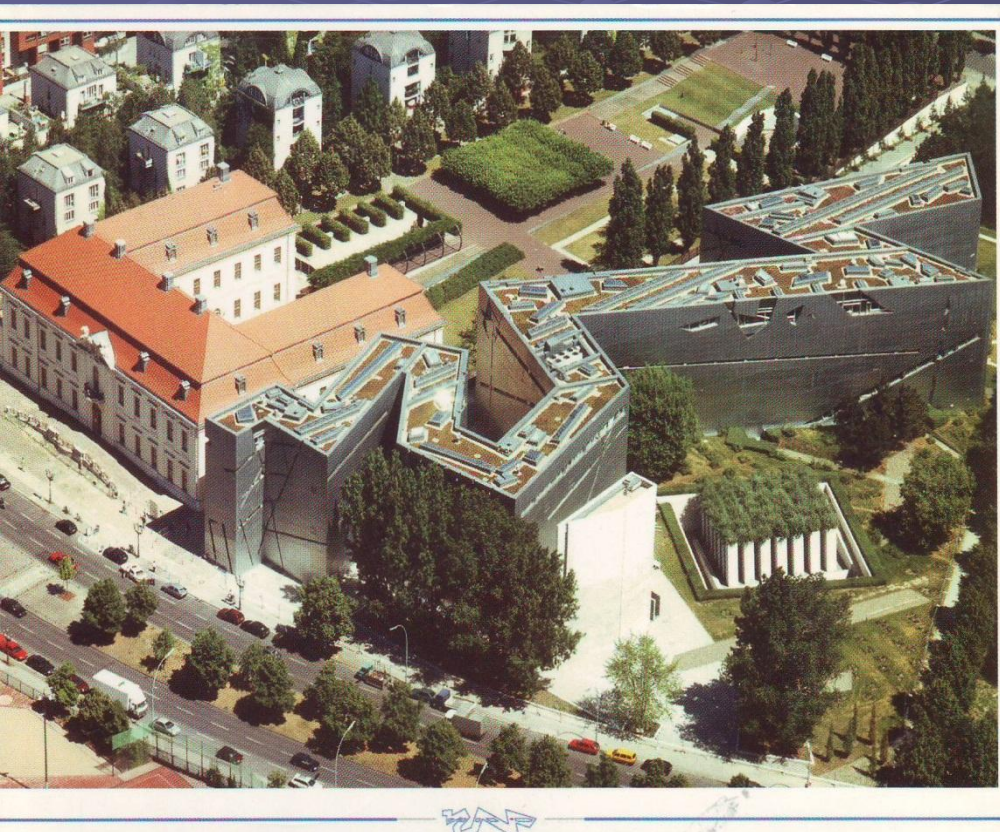
Музей в Берлине