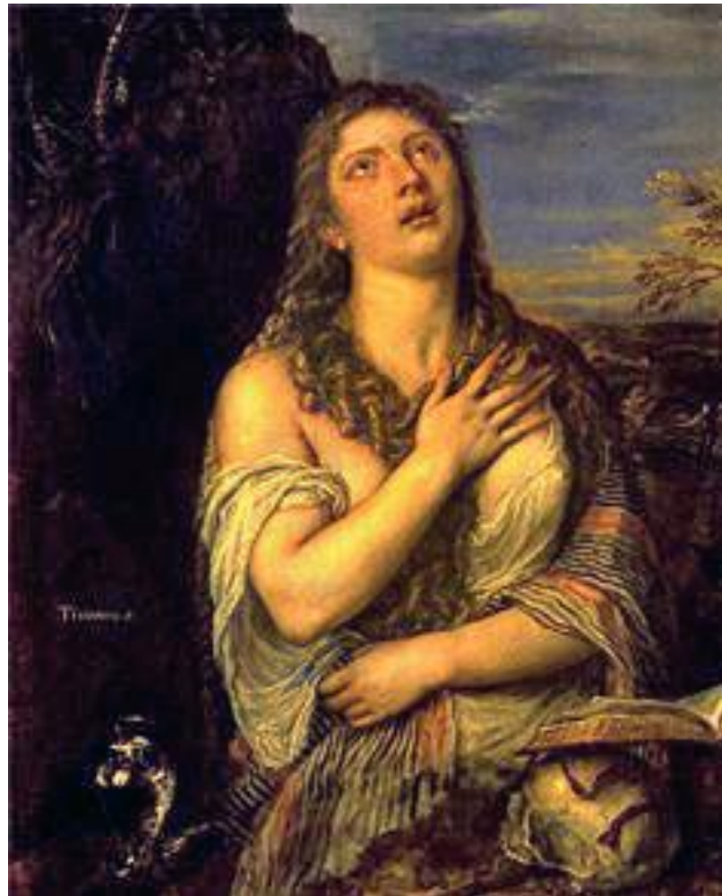
"Кающаяся Мария Магдалина", 1560-е гг.

КОЛОРИТ – гармония различных цветов картины.