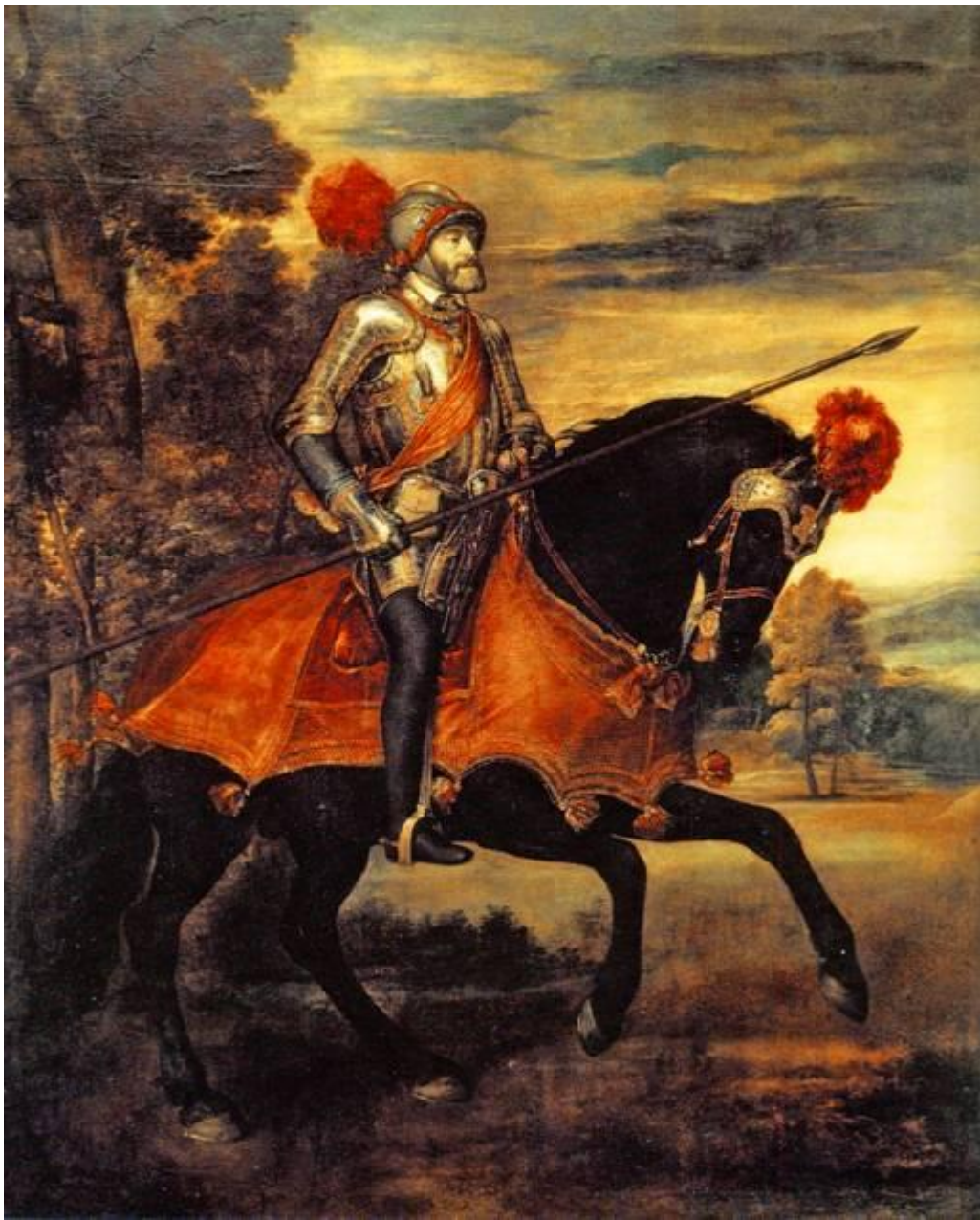
«Портрет Карла V»