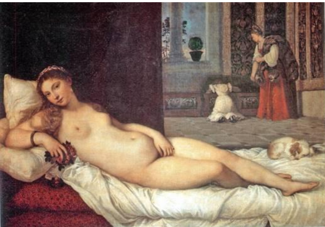
"Венера Урбинская", 1538 г.

В основе колорита Тициана - Золотистая цветовая гамма, которая строится на тонких оттенках цветов.