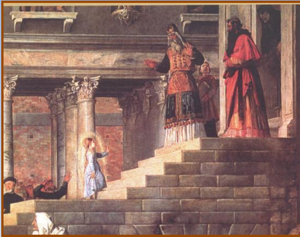
Тициан «Введение Марии во Храм», фрагмент, 1538 г., Венеция.

В 3 года Мария стала просить родителей отдать её в храм, чтобы служить Богу . 4 декабря маленькую Марию возвели к огромному Иерусалимскому храму. И здесь сошла на Марию благодать Божия .