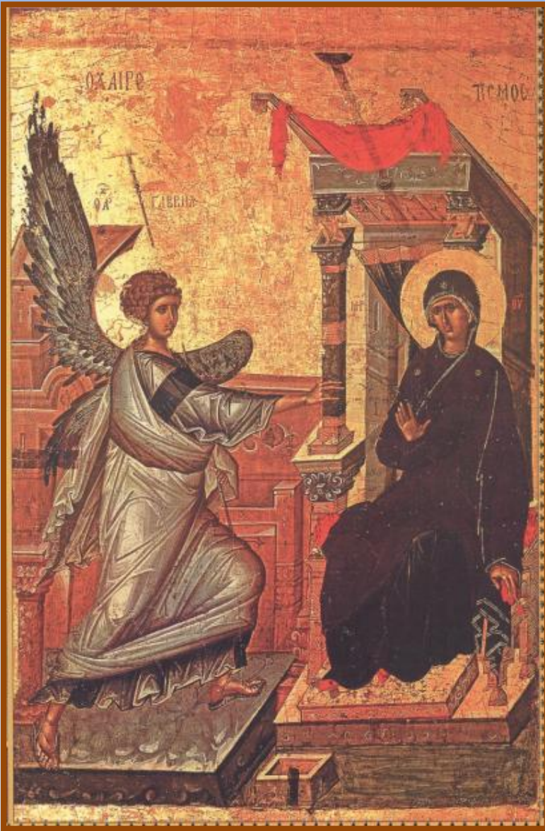
Икона «Благовещение», XIV в.

Священники выдали замуж Марию за старца Иосифа, которого убедили быть хранителем и служителем высокой святости и чистоты Марии.