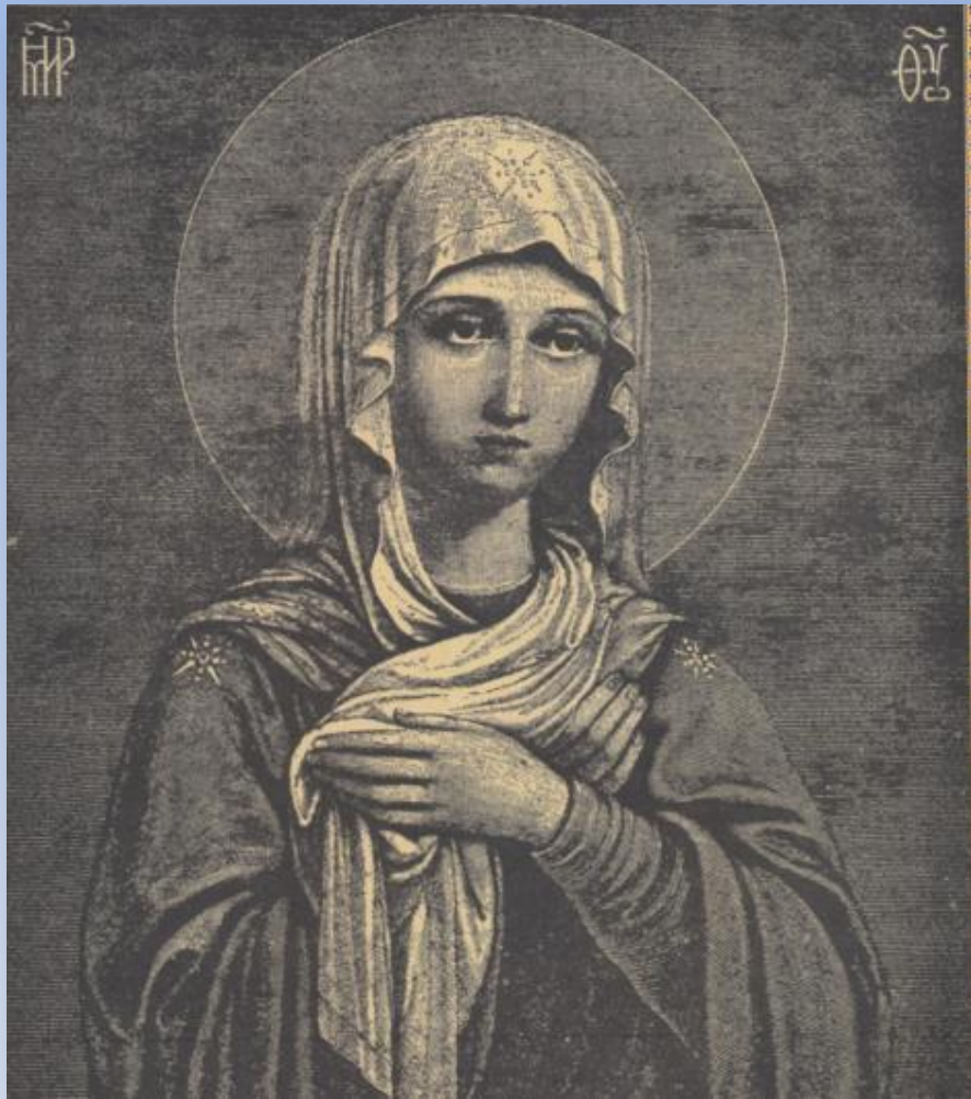
«Пресвятая Дева Мария», гравюра XIX в.