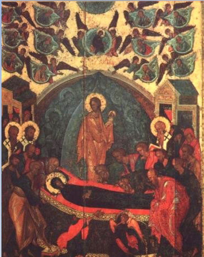
«Успения Пресвятой Богородицы», икона XIV в.