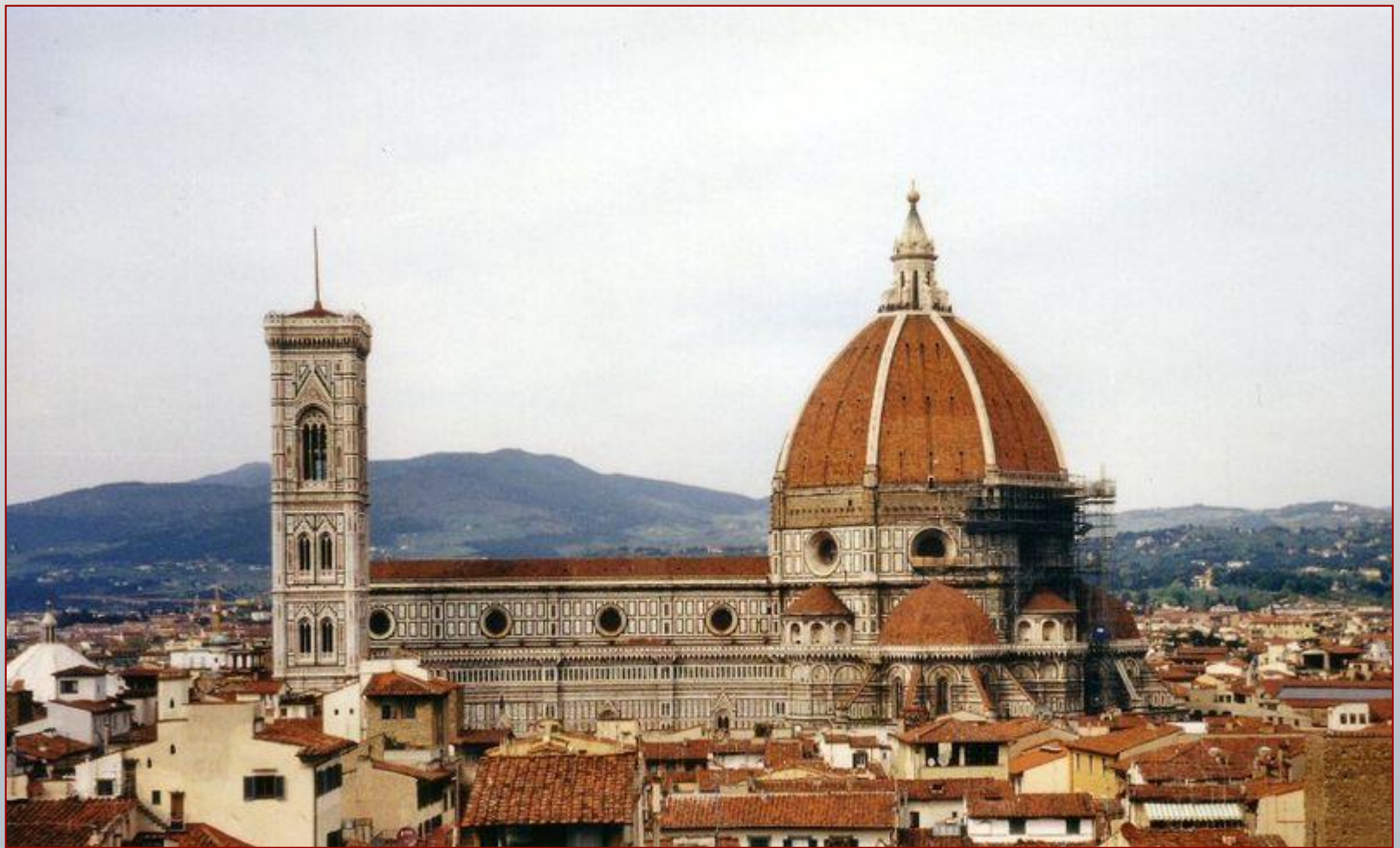
Собор Санта Мария дель Фьоре во Флоренции.