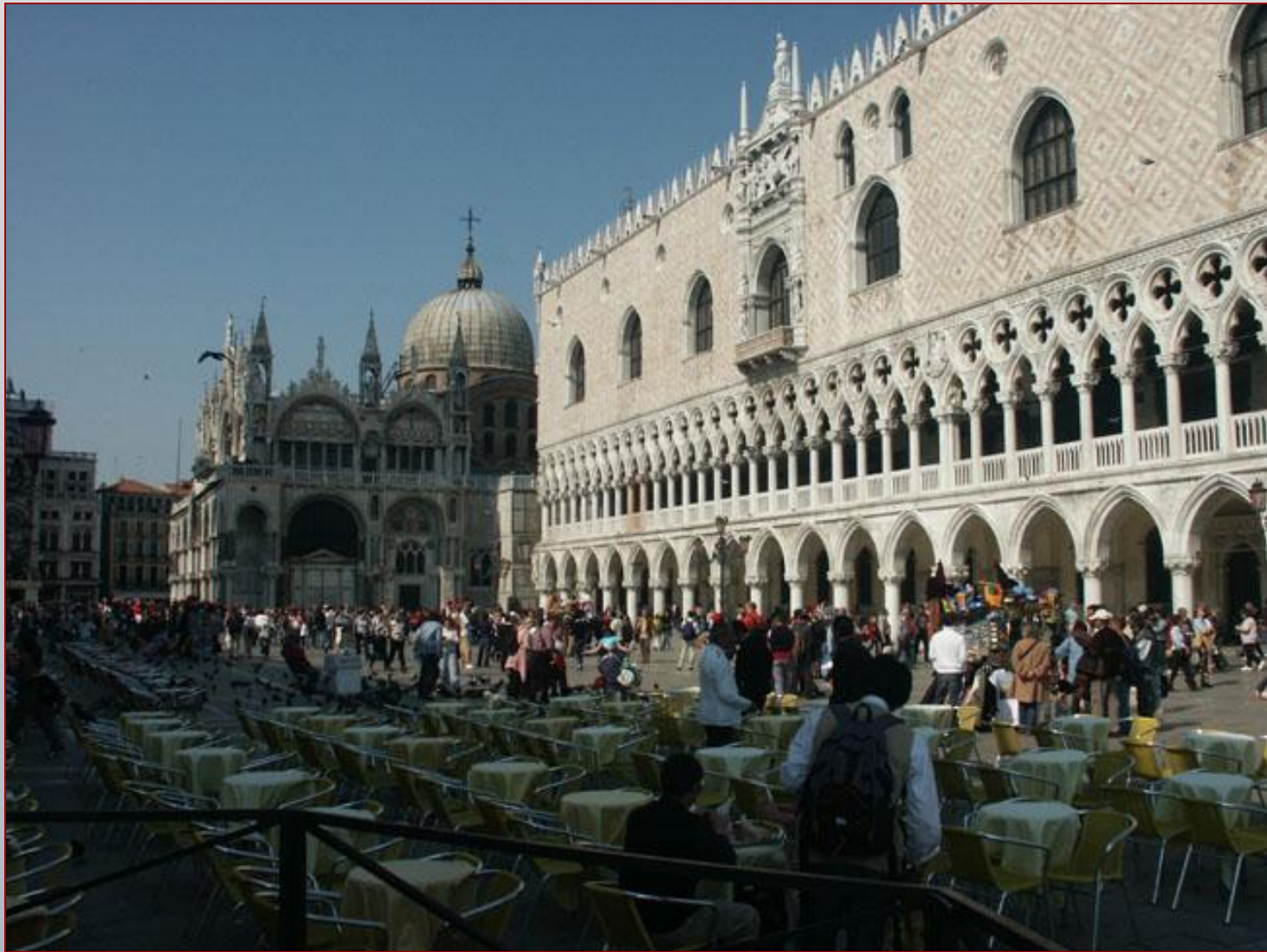
Дворец дождей в Венеции