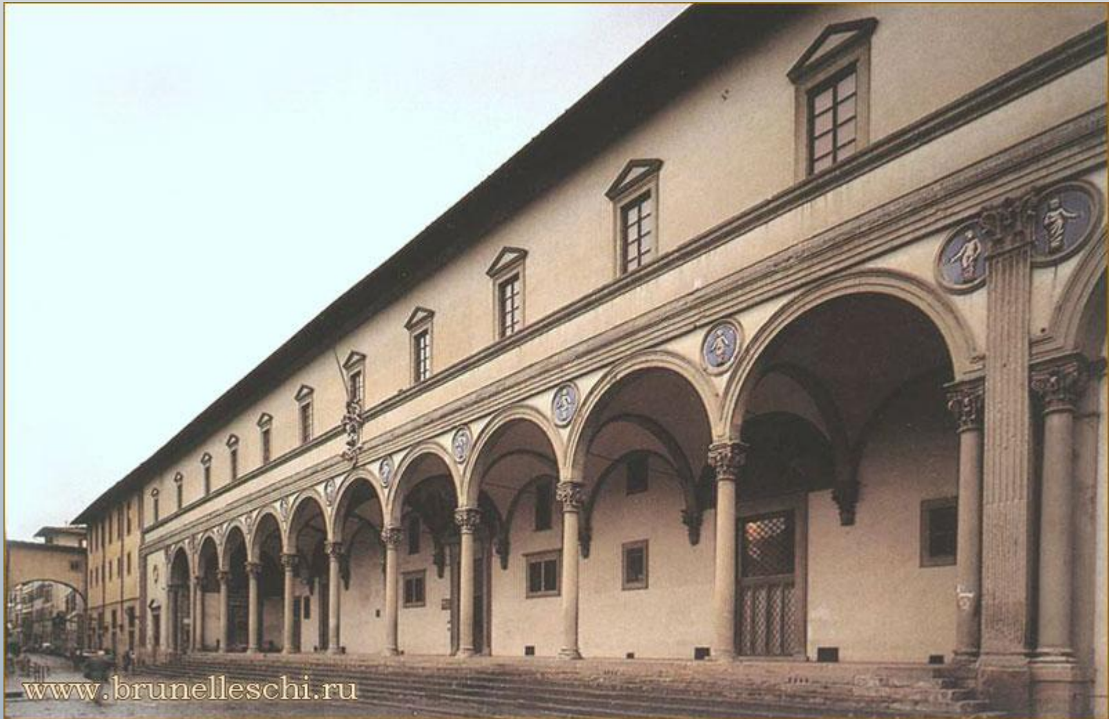
Воспитательный дом во Флоренции (1421-1444)