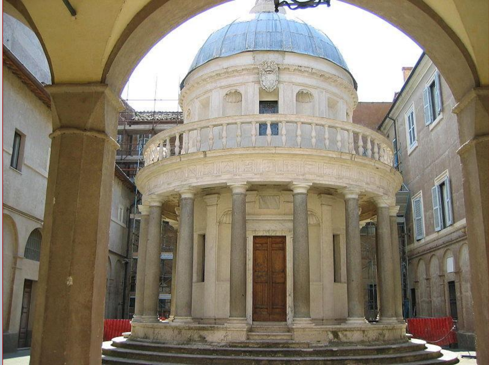
Церковь Сан-Пьетро. Рим. 1502г.